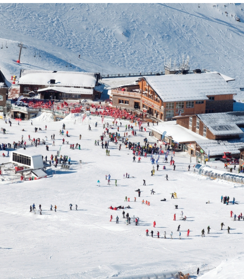
▼ SIERRA NEVADA