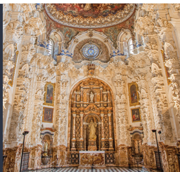
▲ KLASZTOR LA CARTUJA