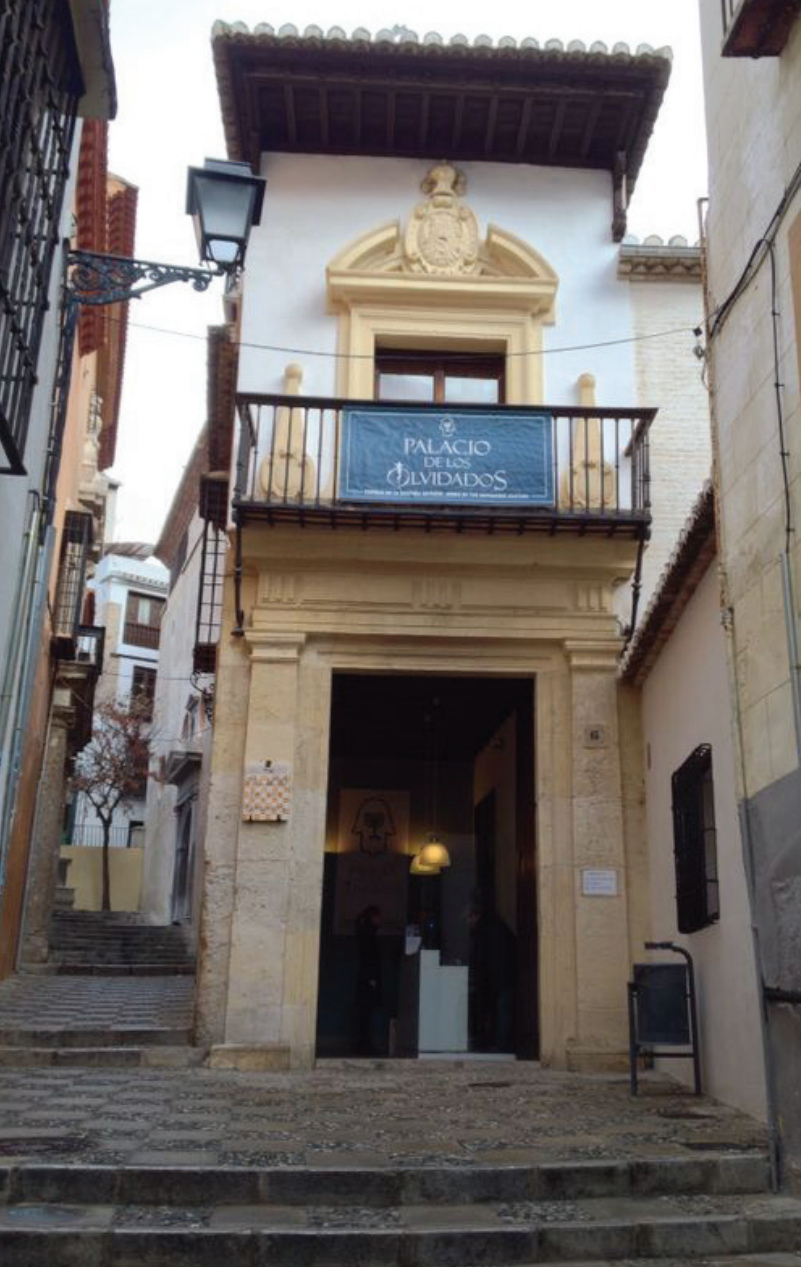
▲ PAŁAC LOS OLVIDADOS

Ministerstwo Przemysłu, Handlu i Turystyki Wydane przez: © Turespaña Projekt: Lionbridge NIPO: 219-24-015-9