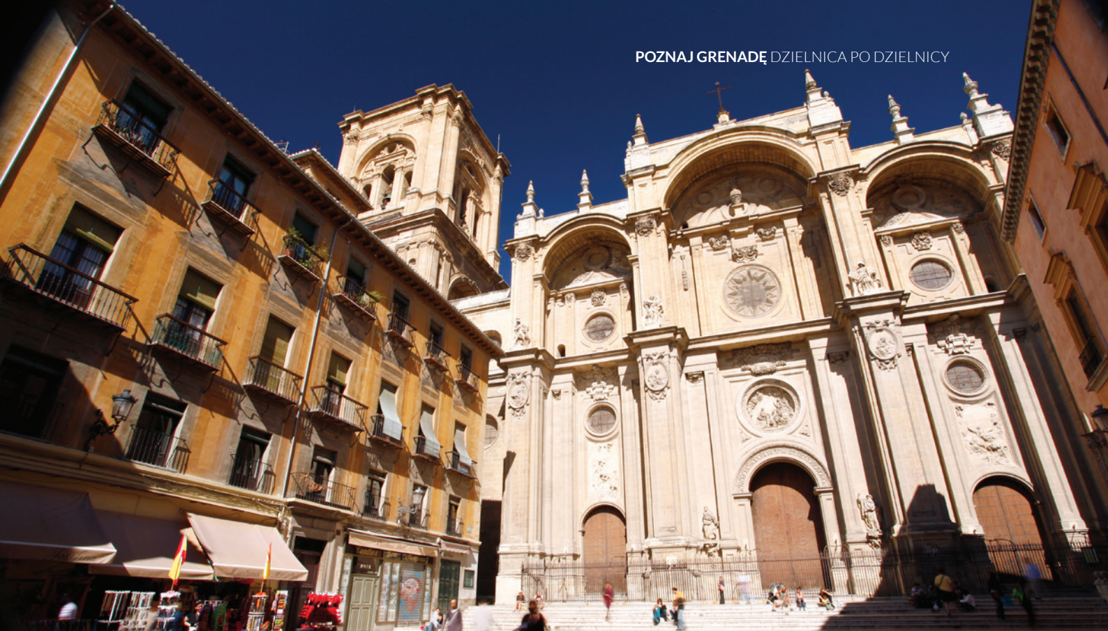
▲ KATEDRA LA ENCARNACIÓN