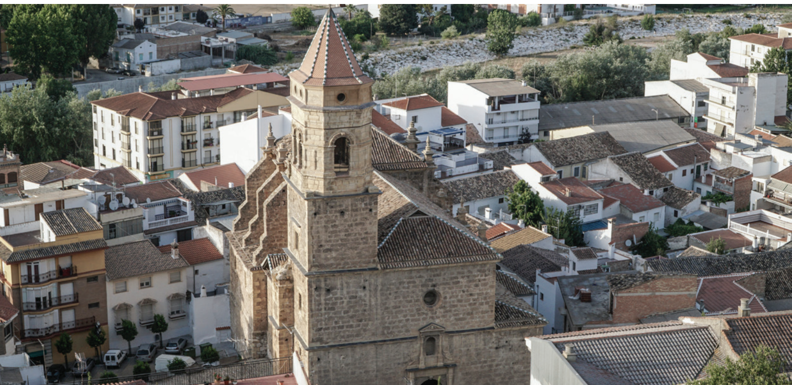
▲ LOJA GRENADA