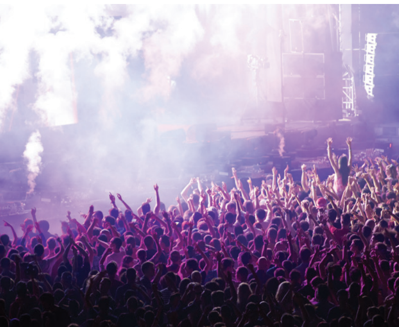
▲ GRANADA SOUND