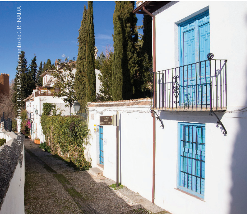
▲ DOM MUZEUM MANUELA DE FALLI