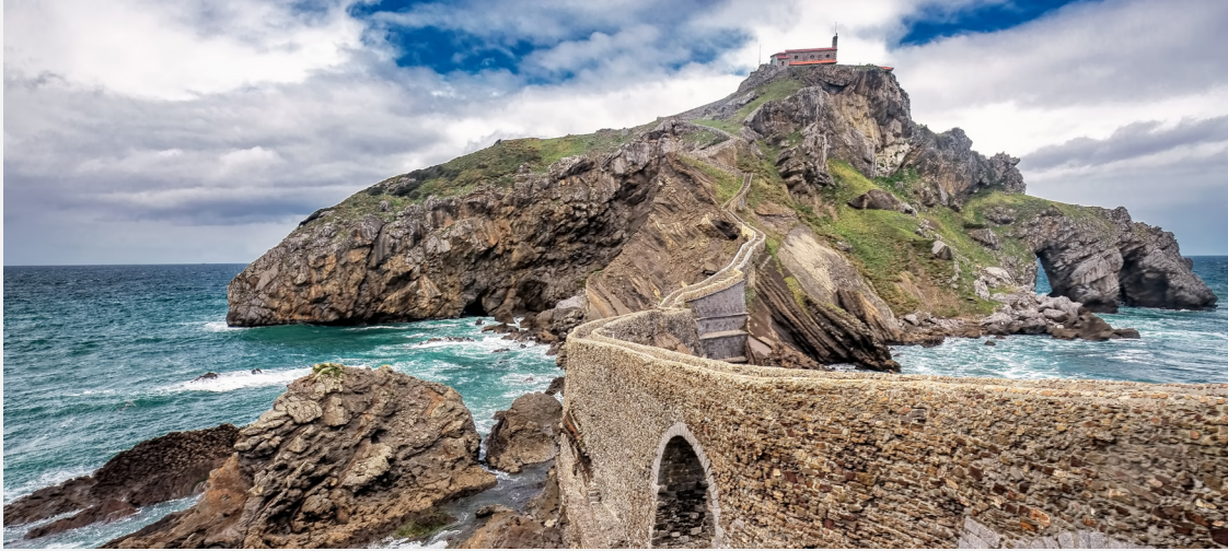
▲ SAN JUAN DE GAZTELUGATXE BERMEO, BASKIMAA

Haluaisitko käydä Game of Thrones -sarjan maisemissa tai James Bondin, Indiana Jonesin tai Anakin Skywalkerin seikkailujen kuvauspaikoilla? Espanja on suosittu elokuvakohde, ja monet kaupungit tarjoavat tähän seitsemänteen taiteeseen liittyvää koettavaa. Valitse omasi.