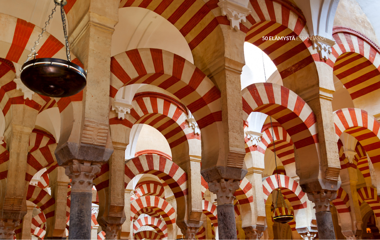
▲ CÓRDOBAN SUURMOSKEIJA