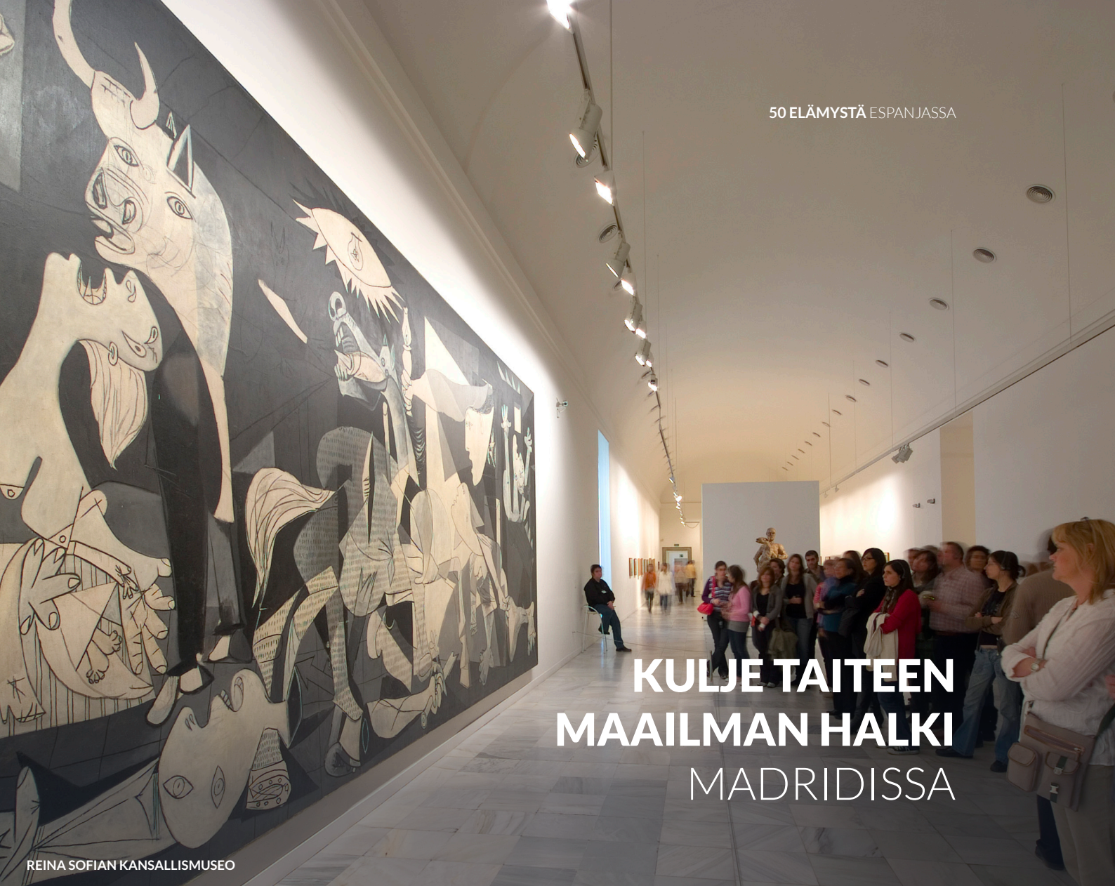
REINA SOFIAN KANSALLISMUSEO