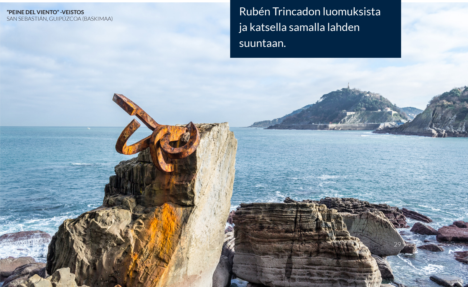
"PEINE DEL VIENTO" -VEISTOS SAN SEBASTIÁN, GUIPÚZCOA (BASKIMAA)