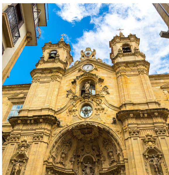
▲ BASILIQUE SANTA MARÍA DEL CORO

d'arbres. Vous pourrez admirer la cathédrale Buen Pastor, le Théâtre Victoria Eugenia ou l'hôtel de ville dont la belle bâtisse a abrité le grand casino de la ville jusqu'à la prohibition du jeu en 1924.