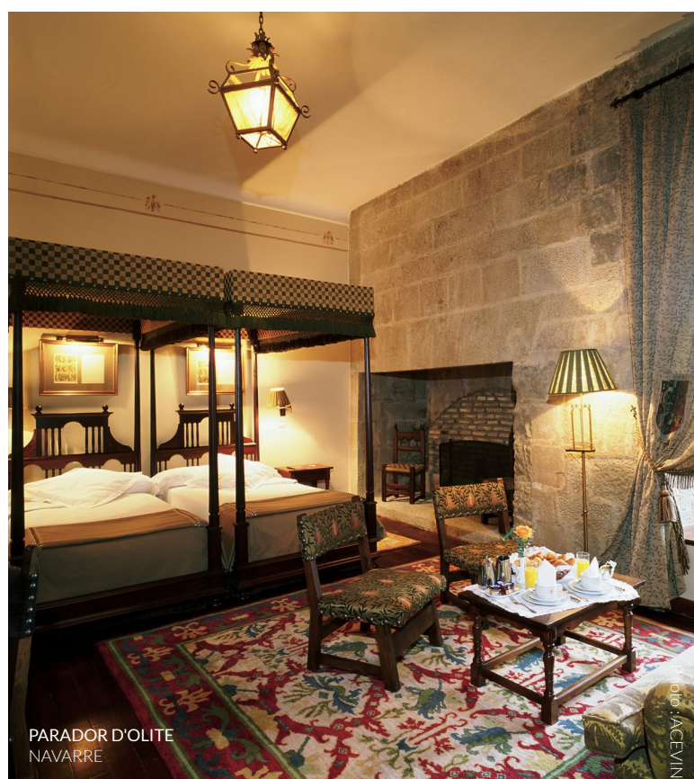
PARADOR D'OLITE NAVARRE

Passez un séjour inoubliable tout en reprenant des forces dans un des Paradores de Turismo d'Espagne. Une offre gastronomique excellente et la variété des services sont des garanties de qualité et de confort. Certains d'entre eux sont situés sur les routes du vin qui sillonnent la péninsule, où vous trouverez, par ailleurs, tous types d'hébergements haute qualité, des hôtels cinq étoiles aux petites pensions, en passant par des maisons de campagne et des campings, tous pensés pour vous permettre de profiter au mieux des activités d'œnotourisme. Dans La Rioja, vous pourrez séjourner au parador d'Olite , aménagé dans le monumental palais médiéval de la cité. Si vous vous rendez dans la Ribera del Duero, profitez-en pour passer quelques jours au parador de Lerma . Le parador de Cadix , moderne et doté d'une piscine exclusive et d'installations de rêve, est parfait pour se lancer sur la route du brandy de Jerez.