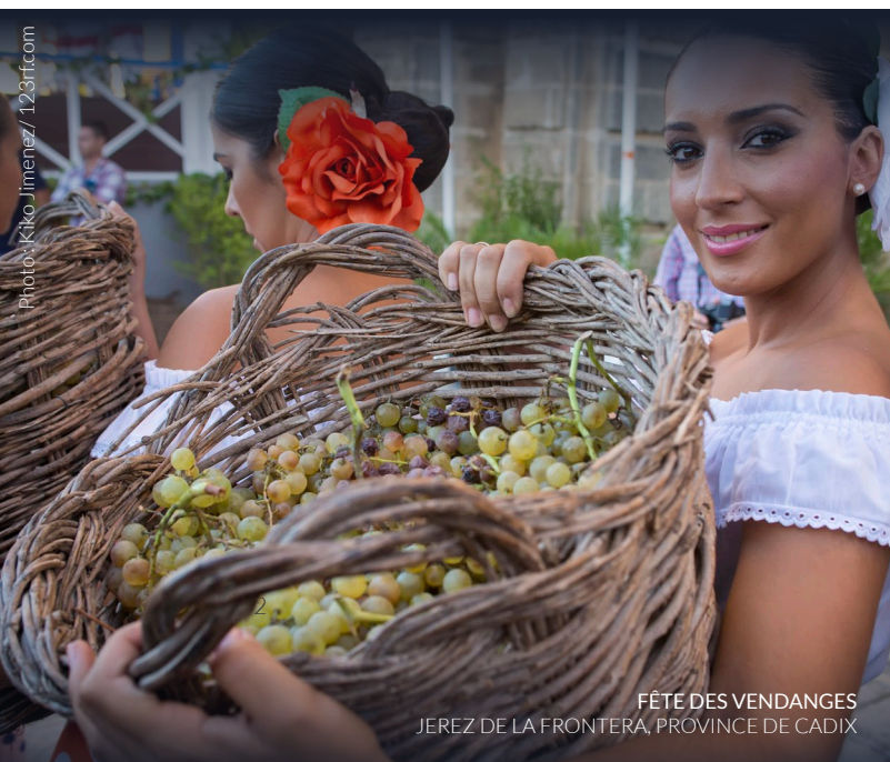
FÊTE DES VENDANGES JEREZ DE LA FRONTERA, PROVINCE DE CADIX