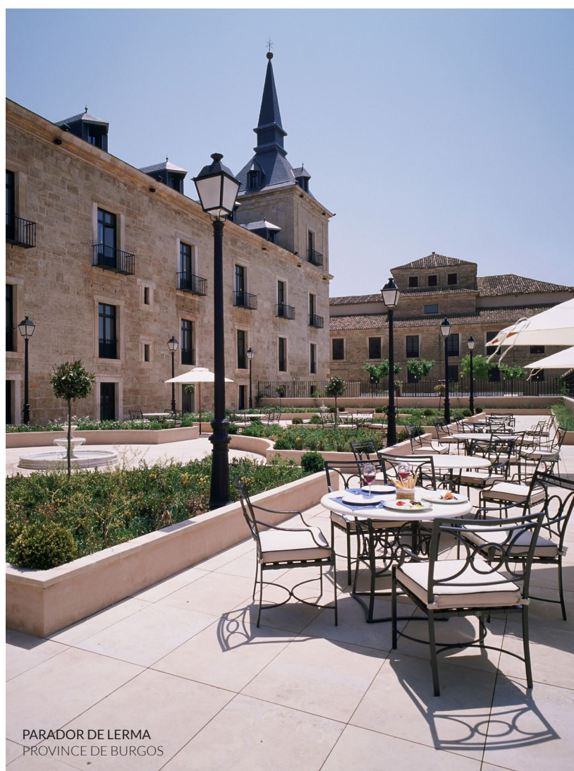
PARADOR DE LERMA PROVINCE DE BURGOS

En Espagne, vous pourrez associer de grands vins au travail, au plaisir et aux divertissements dans des caves historiques creusées sous terre, où sont élaborés des vins de façon artisanale. Ou disposer de salles parfaitement aménagées dans des bâtiments d'avant-garde, conçus par certains des plus grands architectes du monde. Des contrastes séduisants pour vivre des expériences uniques dans les vignes et les caves.