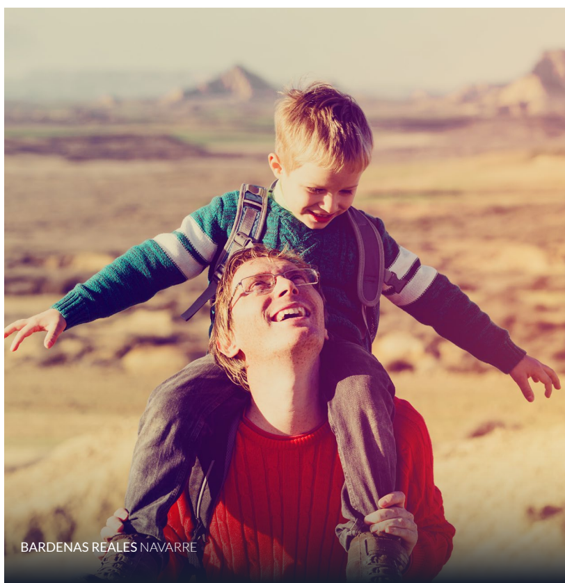
BARDENAS REALES NAVARRE