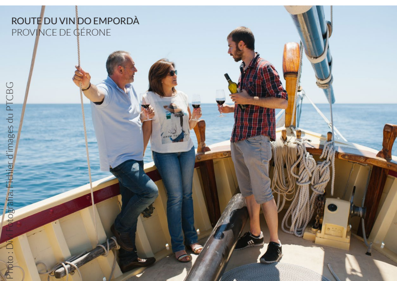
ROUTE DU VIN DO EMPORDÀ PROVINCE DE GÉRONNE