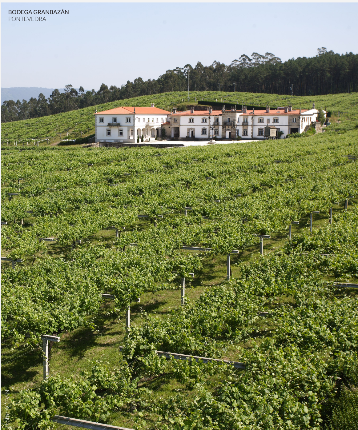
BODEGA GRANBAZÁN PONTEVEDRA

Laissez-vous envelopper par les couleurs des paysages de cette partie de l'Espagne. Certaines des zones vinicoles les plus prestigieuses s'y concentrent. La Rioja , le Pays basque , la Catalogne et la Galice sont parcourus de mille sentiers le long desquels découvrir une gastronomie très appréciée et le savoir-faire des vignerons.