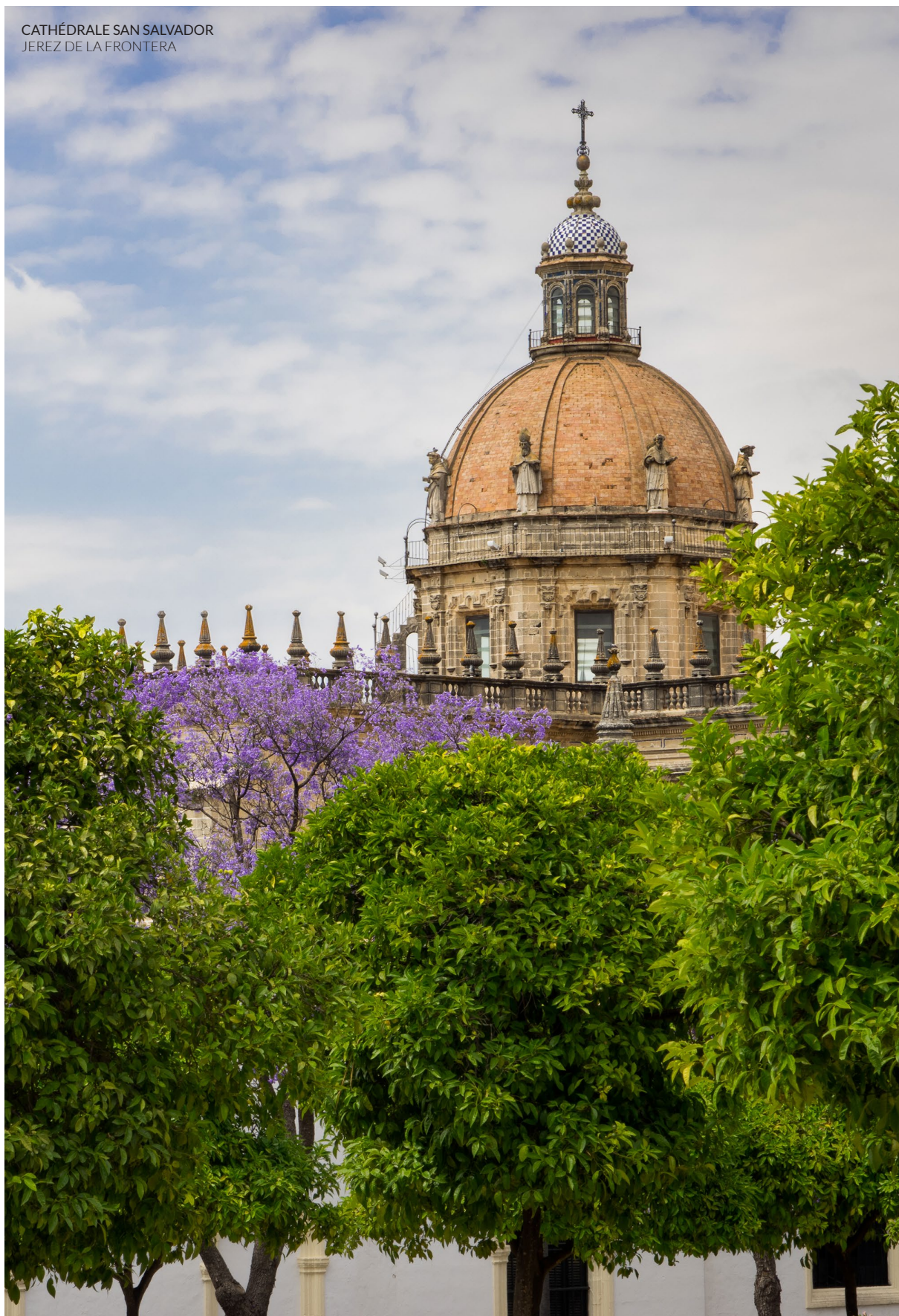
CATHÉDRALE SAN SALVADOR JEREZ DE LA FRONTERA