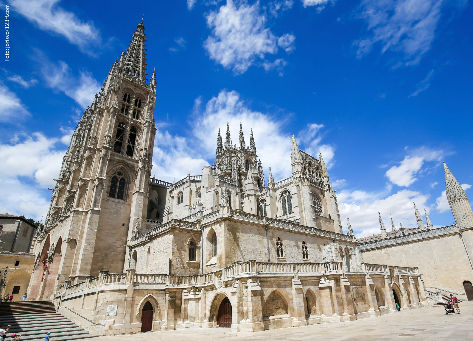
▲ KATHEDRALE BURGOS