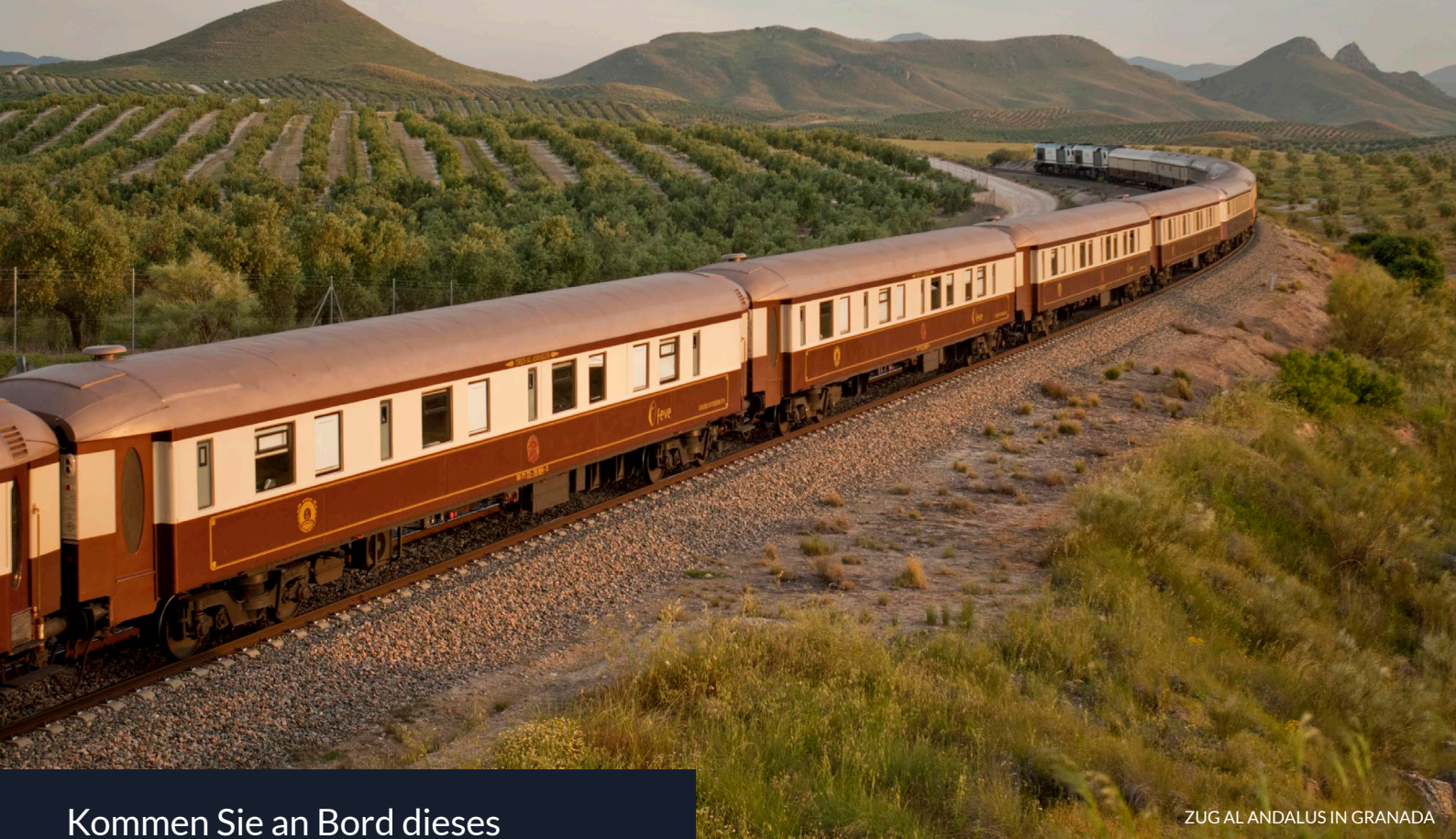
ZUG AL ANDALUS IN GRANADA

Kommen Sie an Bord dieses faszinierenden Hotels auf Rädern und erkunden Sie einen Teil Spaniens.