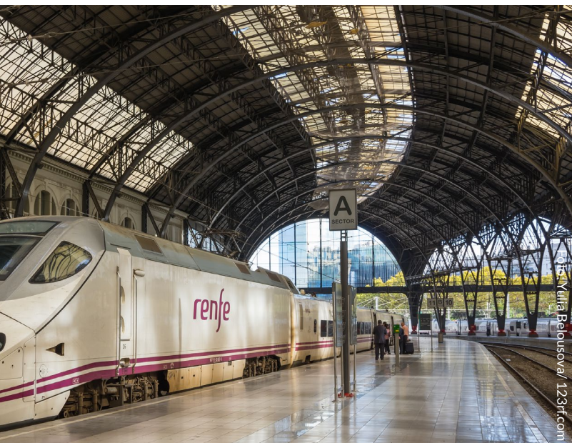
▲ BAHNHOF ESTACIÓN DE FRANCIA BARCELONA

Ministerium für Industrie und Tourismus Herausgegeben von: © Turespaña Erstellt von: Lionbridge NIPO: 086-17-056-8