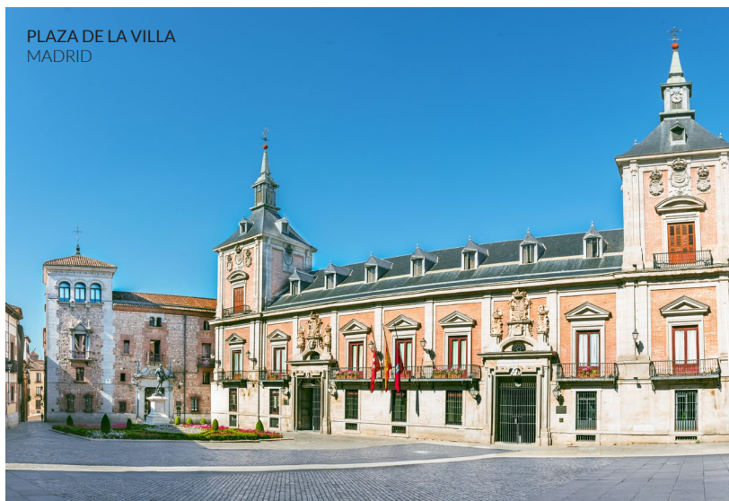
PLAZA DE LA VILLA MADRID

Verlieben Sie sich in diese kosmopolitische, avantgardistische und mediterrane Stadt. Sie werden jeden Moment von ihr begeistert sein. Erkunden Sie sie zu Fuß oder mit dem Fahrrad und entdecken Sie ihre Stadtteile, ihren Prachtboulevard La Rambla und Ihre Strandpromenade. Fühlen Sie sich wie ins Mittelalter zurückversetzt, wenn Sie durch die engen Gassen des berühmten Viertels Barri Gòtic schlendern. Springen Sie mit Antoni Gaudí mitten hinein in den katalanischen Jugendstil, den Modernisme. Bewundern Sie sein beeindruckendes Meisterwerk, die Kirche Sagrada Familia , oder den Park Güell , die beide von der UNESCO zum Weltkulturerbe erklärt wurden. Informieren Sie sich über das reichhaltige Kulturprogramm der Stadt und besuchen Sie die Ausstellungen, Konzerte, Vorführungen usw. Genießen Sie die Gastronomie Barcelonas, die Tradition und Kreativität in der Küche vereint. Gönnen Sie sich etwas Besonderes: Probieren Sie die traditionell hergestellten Konditorwaren und die Schaumweine. Sie können auch von zahlreichen anderen Städten aus, z. B. Málaga, mit dem AVE nach Barcelona fahren.