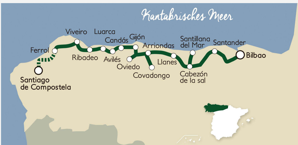
REISEROUTE DES TRANSCANTÁBRICO CLÁSICO

Dies ist eine weitere hervorragende Alternative, um das grüne Spanien zwischen Santiago de Compostela und Bilbao (oder umgekehrt) zu erkunden. Innerhalb von sechs Tagen entdecken Sie die schönsten Städte des Baskenlands, Kantabriens, Asturiens und Galiciens, werden unter höchstem Komfort betreut und mit einer erlesenen Auswahl der spanischen Gastronomie verköstigt.