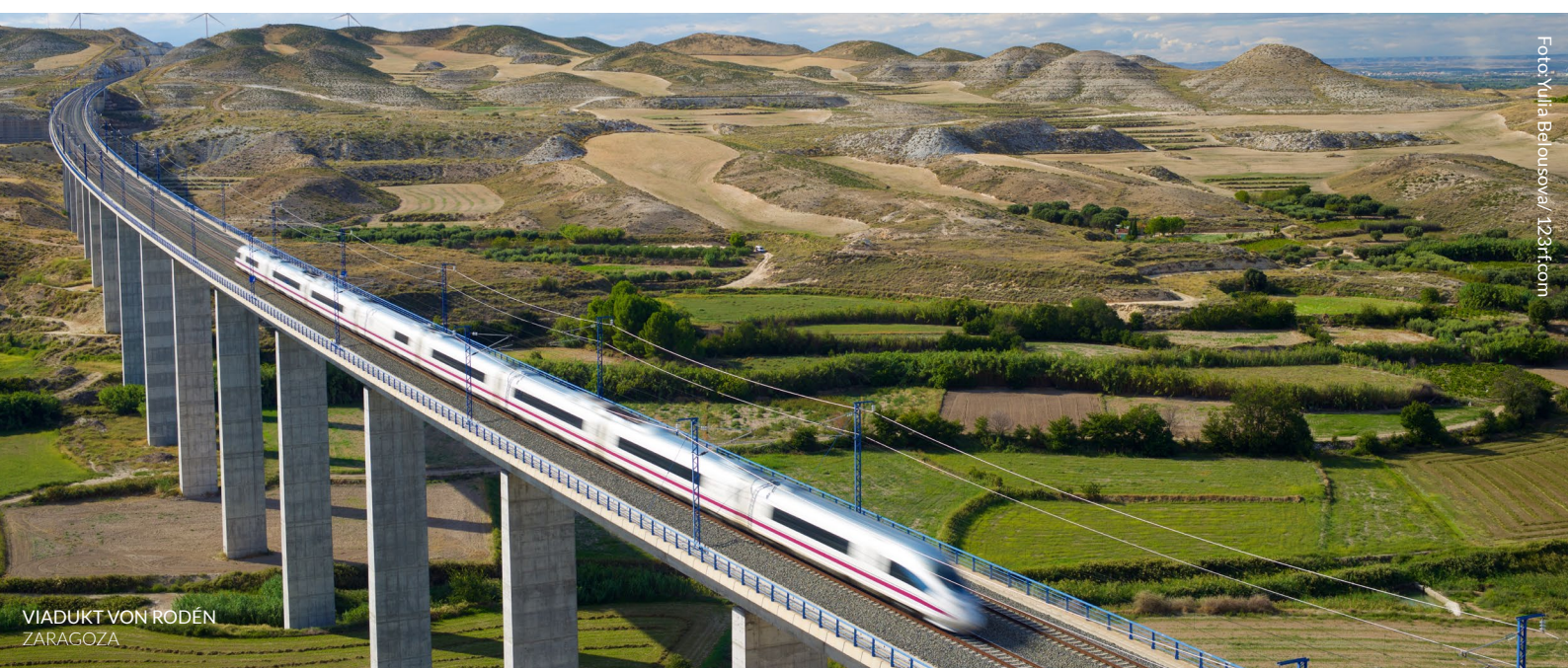
VIADUKT VON RODÉN ZARAGOZA