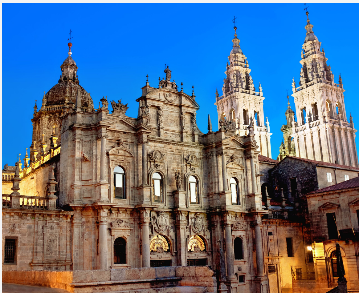
▲ KATHEDRALE VON SANTIAGO SANTIAGO DE COMPOSTELA