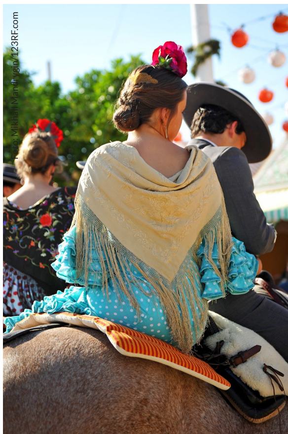
▲ FRÜHLINGSFEST FERIA DE ABRIL SEVILLA