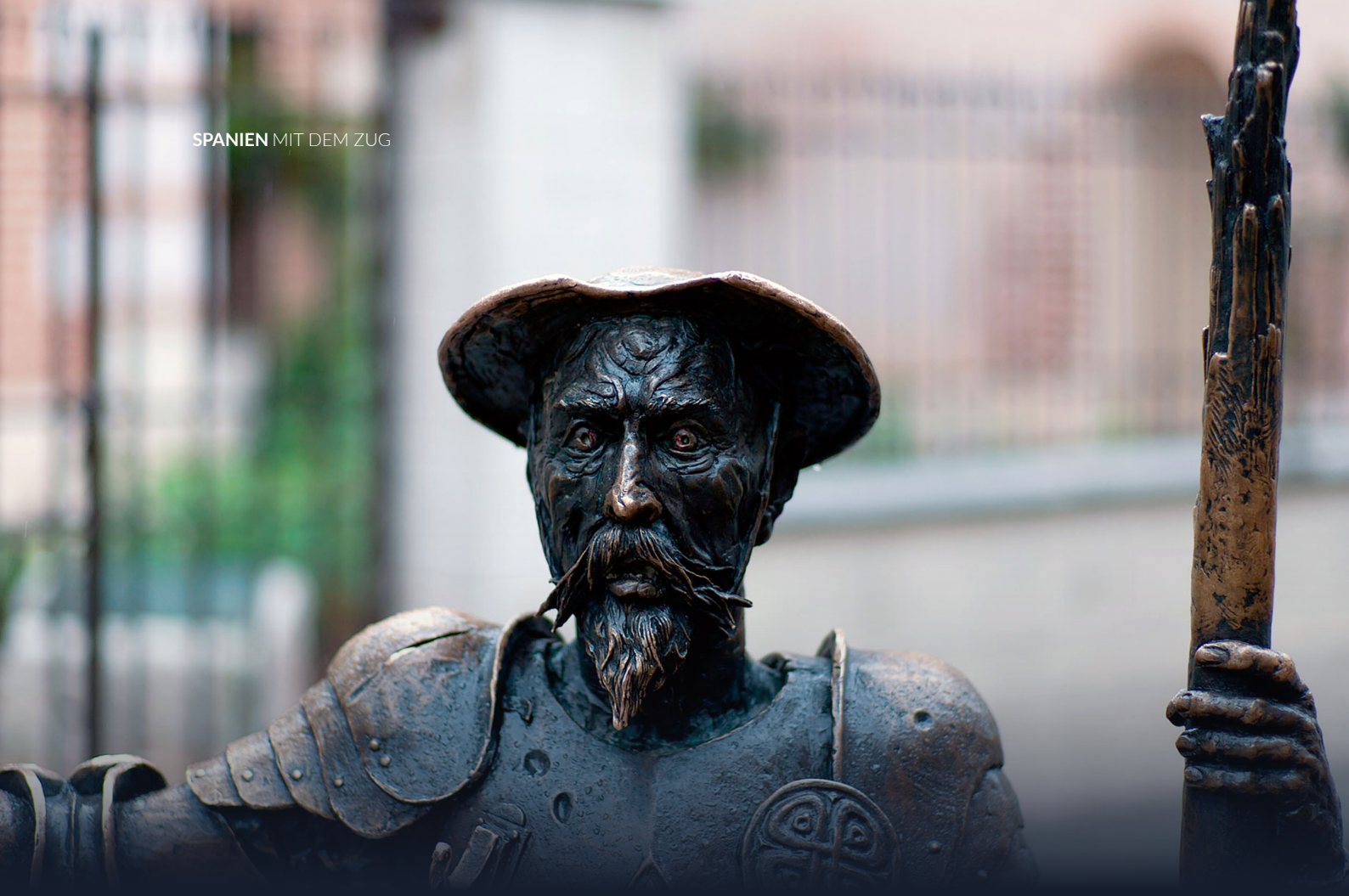
▲ SKULPTUR VON DON QUIJOTE ALCALÁ DE HENARES, MADRID