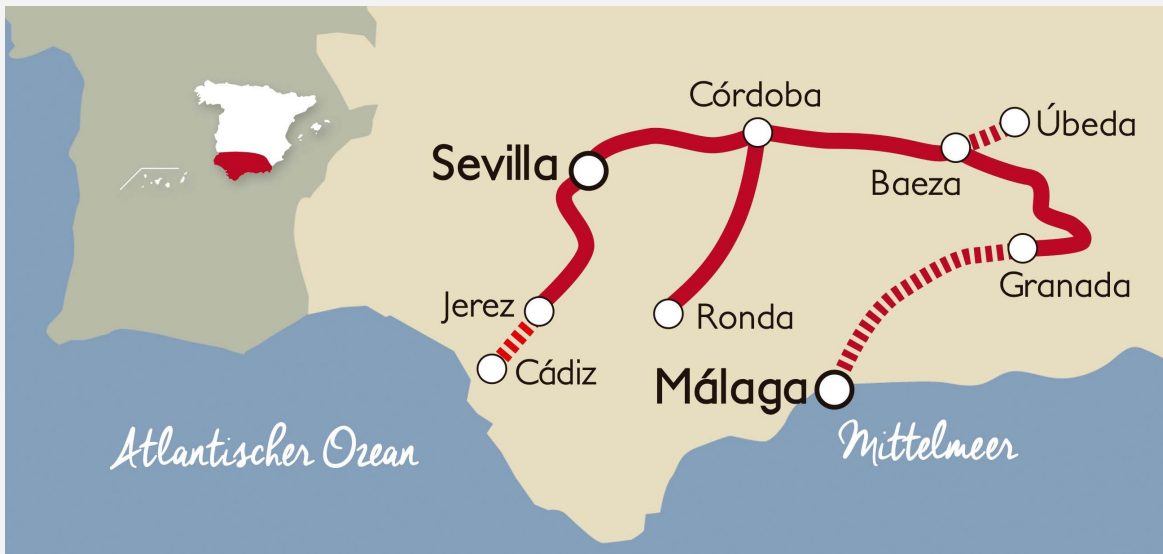
▲ REISEROUTE DES AL ANDALUS