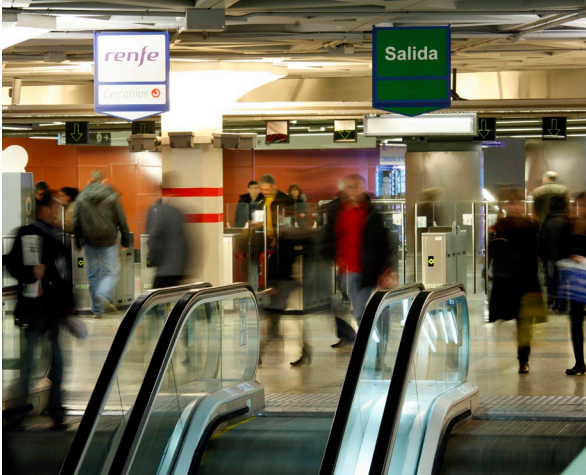
▲ BAHNHOF PUERTA DE ATOCHE MADRID

Wenn Sie in Madrid sind, fahren Sie mit dem Mittelalterlichen Zug und verbinden an einem einzigen Tag Geschichte, Theater und Gastronomie. Die Fahrt bis zur monumentalen Stadt Sigüenza in Guadalajara vergeht wie im Flug: Fast anderthalb Stunden lang tauchen Sie in das mittelalterliche Leben ein, denn Sie sind von Schauspielern umgeben, die in die Rolle charakteristischer Figuren jener Zeit schlüpfen wie Minnesänger, Stelzenläufer, Gaukler usw. Sie können im Zug sogar typische Süßigkeiten probieren. Lernen Sie die Stadt, nachdem Sie am Ziel angekommen sind, mithilfe von ortsansässigen Gästeführen kennen. Sie werden von der majestätischen Kathedrale, der Burg und der Plaza Mayor begeistert sein. Bestellen Sie eines der typischen Gerichte wie „Migas“ (frittierte Brotkrumen) oder die „Sopa castellana“ (kastilische Suppe), um den Hunger zu stillen. Probieren Sie als Dessert die traditionellen „Yemas del Doncel“, eine Süßspeise aus Eigelb.