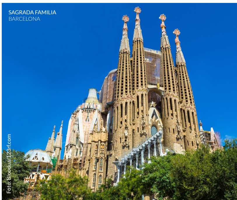
SAGRADA FAMILIA BARCELONA