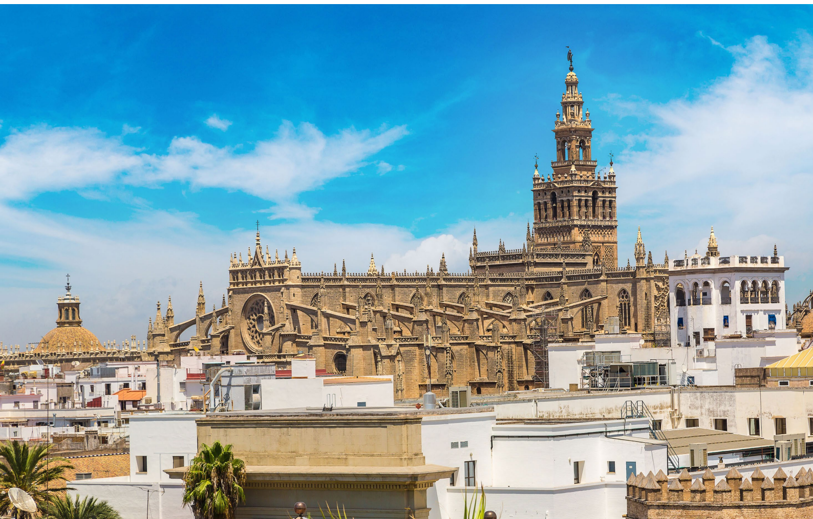
▼ KATHEDRALE SANTA MARÍA DE LA SEDE SEVILLA

Wenn Sie in der Osterwoche oder während des Frühlingsfestes Feria de Abril reisen, können Sie hautnah eines der faszinierendsten Volksfeste des Landes miterleben.