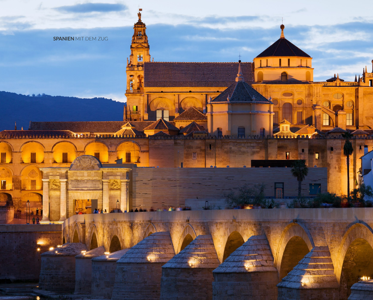
▲ MOSCHEE-KATHEDRALE CÓRDOBA