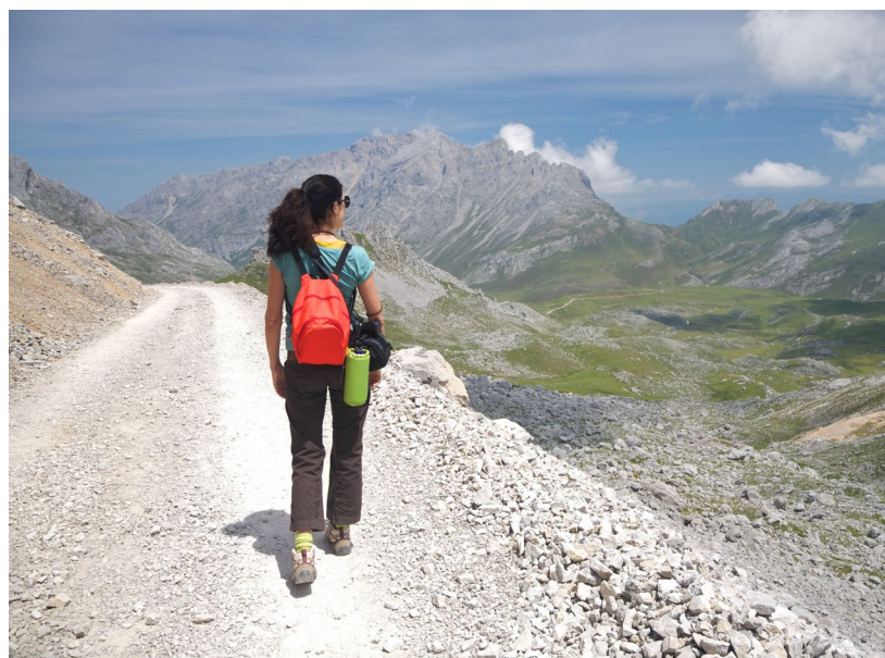
▲ 欧洲之峰国家公园 坎塔布里亚

当你游览坎塔布里亚时，你还会发现一个壮观的地下世界，那有成千上万个洞穴，在那可以进行洞穴学研究。其中，埃尔索普拉奥（El Soplao）洞穴最突出，以其石头和水晶的形状而闻名世界。