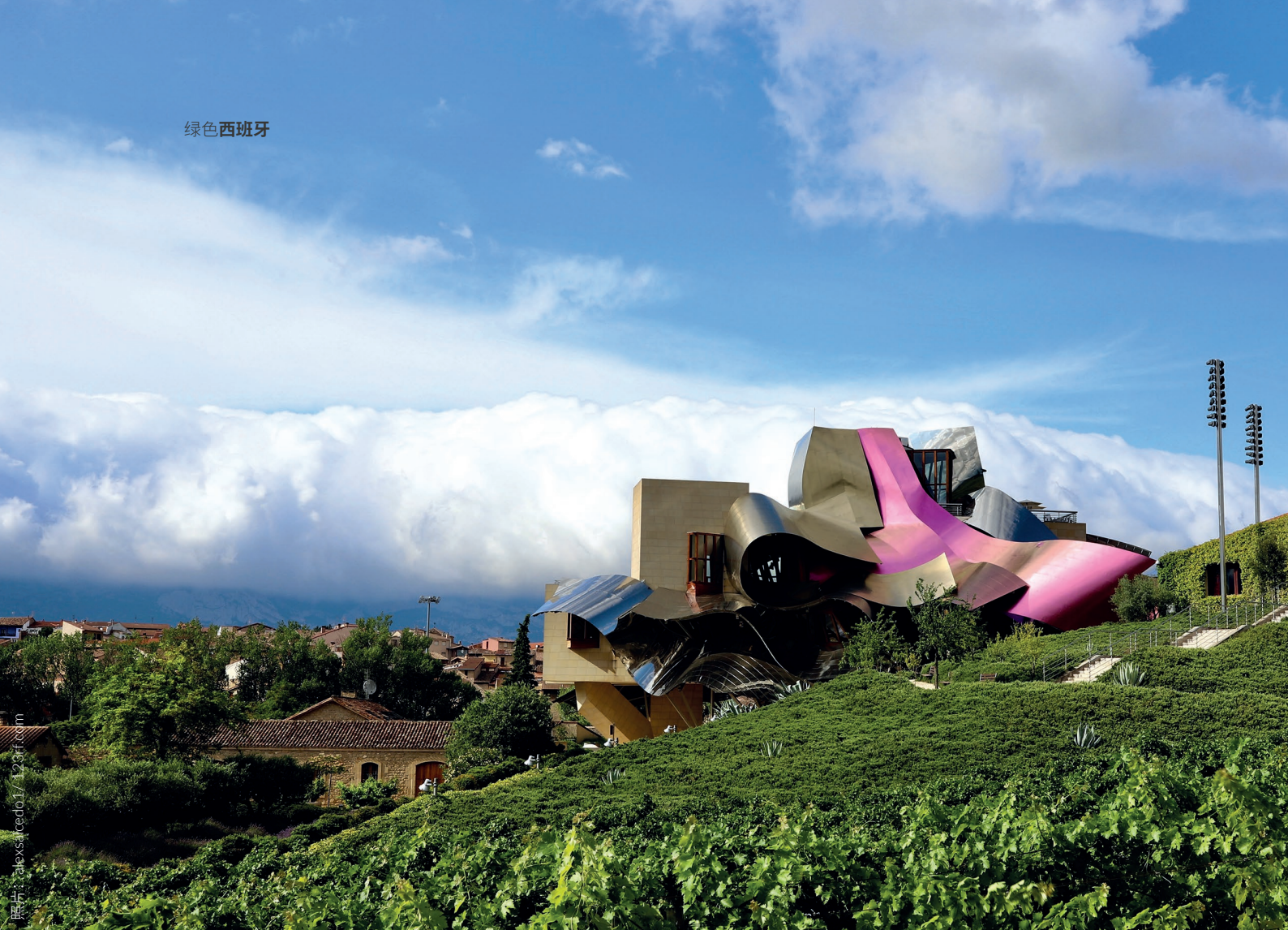
▲ MARQUÉS DE RISCAL酒庄 阿拉瓦的埃尔希尔格