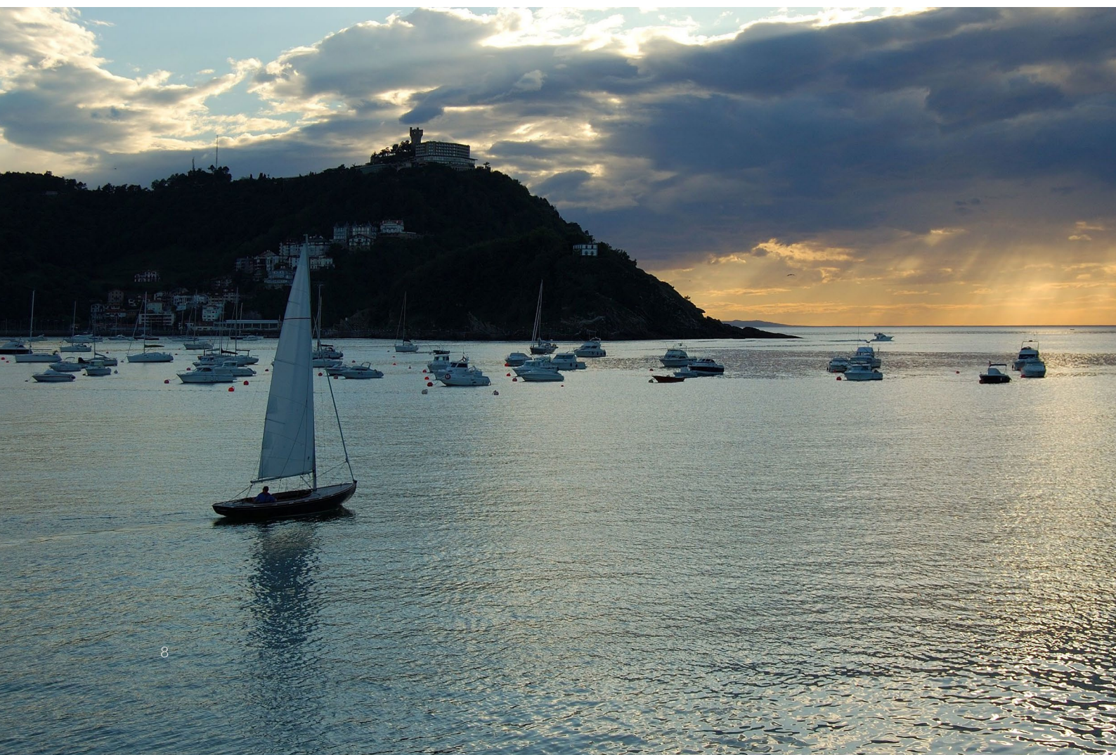
▼ 贝壳海湾 圣塞巴斯蒂安

乘坐小帆船航行于坎塔布里亚海和大西洋，以这种独特的方式了解西班牙北部海岸。可去往人迹罕至的小海湾、迷人的渔村或热闹的滨海城市，例如维戈（加利西亚）或者卡斯特罗-乌尔迪亚莱斯（Castro Urdiales）（坎塔布里亚）。在加利西亚的巴依萨斯河口（Rías Baixas）你会找到练习浮潜的绝佳去处。