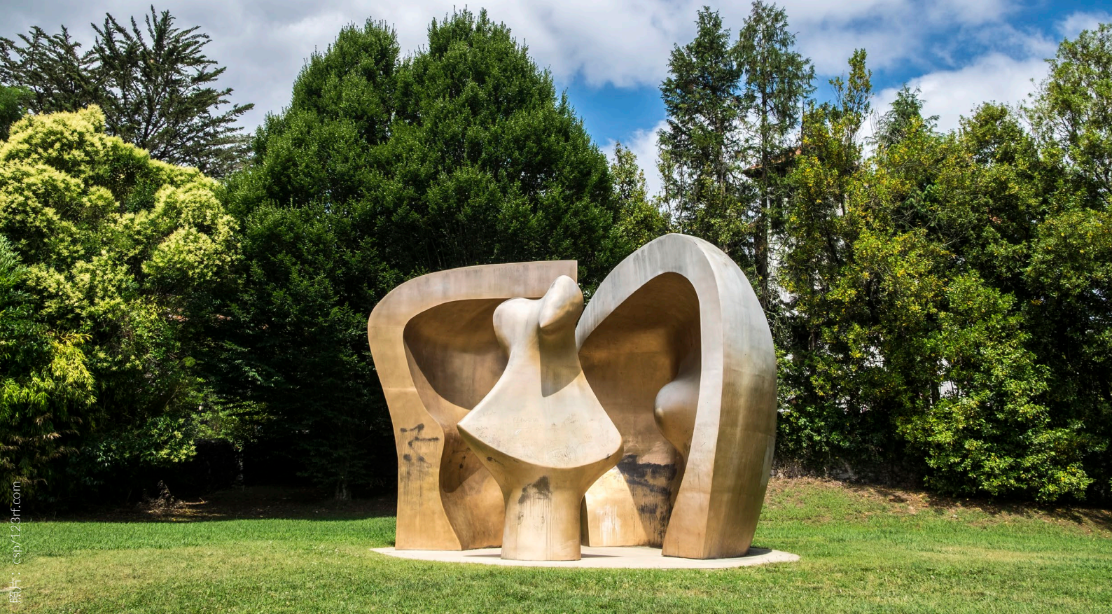
▲ 欧洲人民公园 比斯开格尔尼卡

会在它那长长的海滩看到来自世界各地的冲浪者。它还经过赫塔里亚，在那里你可以参观巴黎世家博物馆，那个著名的时装设计师就出生于此；还有格尔尼卡，它是巴斯克人的象征。该城在内战时期被希特勒派来的德国空军轰炸，这也启发了巴布罗·毕加索画下与该城同名的代表作。这条路线还包括鲜为人知的地区和人迹罕至的山谷，点缀着村落，在那你将亲自感受人们的和蔼可亲。