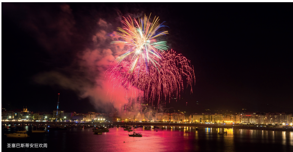
圣塞巴斯蒂安狂欢周