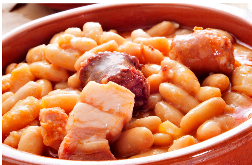
▲ 阿斯图里亚斯炖菜

在胃里给饭后甜品留一点空间，因为最好的美味是吃完饭的时候才上：尝尝 帕斯甜馅饼 ，这是一种坎塔布里亚典型的奶油糕点，或者 圣地亚哥蛋糕 ，一种用杏仁、糖和鸡蛋制作的加利西亚甜品。