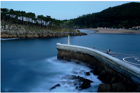
▲ 莱克蒂奥 比斯开