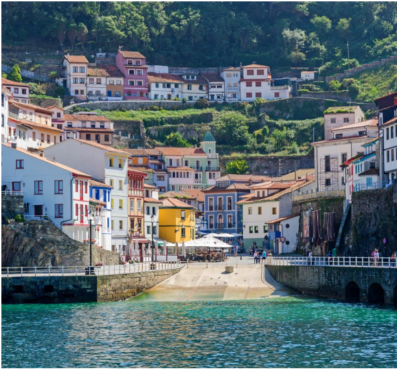
▲ 古迪耶罗 阿斯图里亚斯