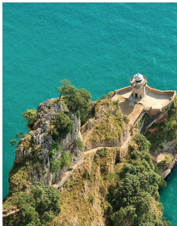
▲ 卡瓦斯灯塔 坎塔布里亚的桑多尼亚

在这几个月里，大自然在漫长的冬季过后复苏。准备在阿斯图里亚斯的自然公园来一次真正的冒险，寻找棕熊和其他野生动物的踪迹。在索米耶多（Somiedo）或者福恩德斯德纳尔赛阿（Fuentes de Narcea）自然公园壮观的景色中找到它，体验一次难忘的经历。