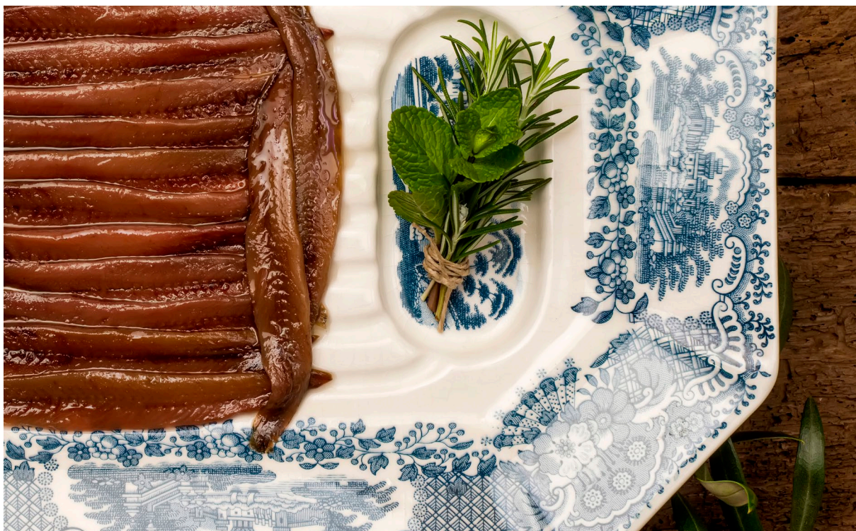
▲ 桑多尼亚的欧洲鳗罐头 坎塔布里亚