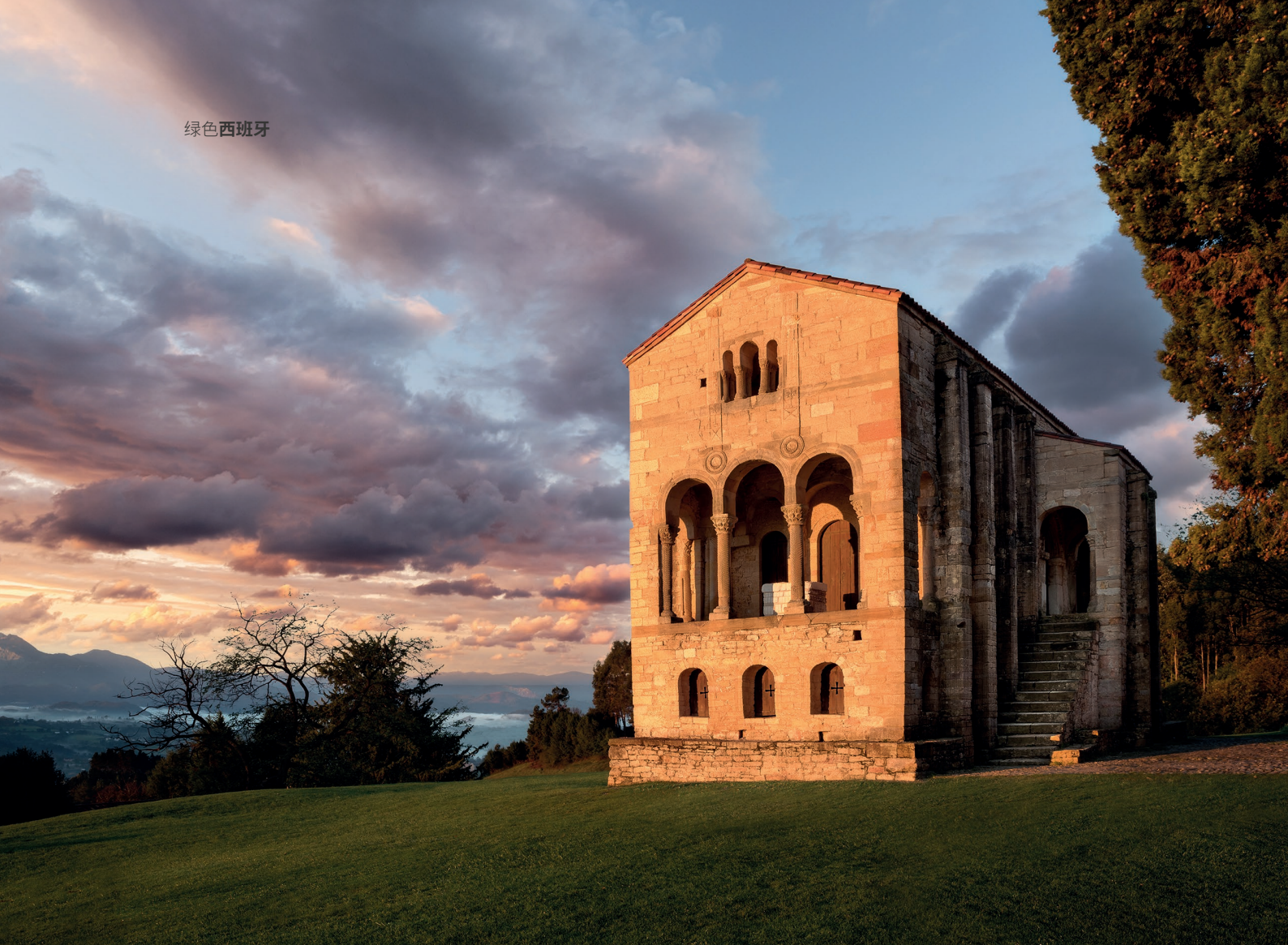
▲ 圣玛利亚德尔那朗科 奥维耶多