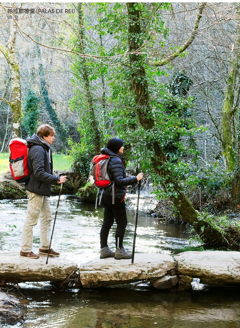
帕拉斯德雷 (PALAS DE REI) 卢戈

这是所有圣地亚哥朝圣之路中最古老的一条。沿着9世纪起朝圣者们从阿斯图里亚斯内部西侧开辟的路径继续行走。从阿斯图里亚斯自治区首府——奥维耶多出发。一个充满生机且历史文化遗迹众多的城市。穿过阿斯图里亚斯中心，在水流丰富的河道、陡峭的峡谷、瀑布以及千年橡树林之间，你仿佛已与自然融为一体。在途中你可以看到如同萨拉斯（Salas）这样被称为历史遗迹群的小镇。随后你将经过阿亚德（Allande）和格兰达斯德萨利梅（Grandas de Salime）市镇，这里的卡隆蒂奥山脉和巴耶多尔山脉保护区的风景会让你赞叹不已。现在你已经离加利西亚很近了，在萨利梅水库你可以看到美妙的景致。在与法国之路交汇之前，在帕拉斯德雷（Palas de Rei）（卢戈）你会登上高出海平面1100多米的美丽的阿尔多德尔阿塞波（Alto del Acebo）顶峰；还可以了解卢戈这座雄伟的城市及其被列为世界遗产的罗马城墙。沿途你会看到梅利德（Melide）和阿爾苏阿（Arzúa）等美丽的加利西亚村庄。