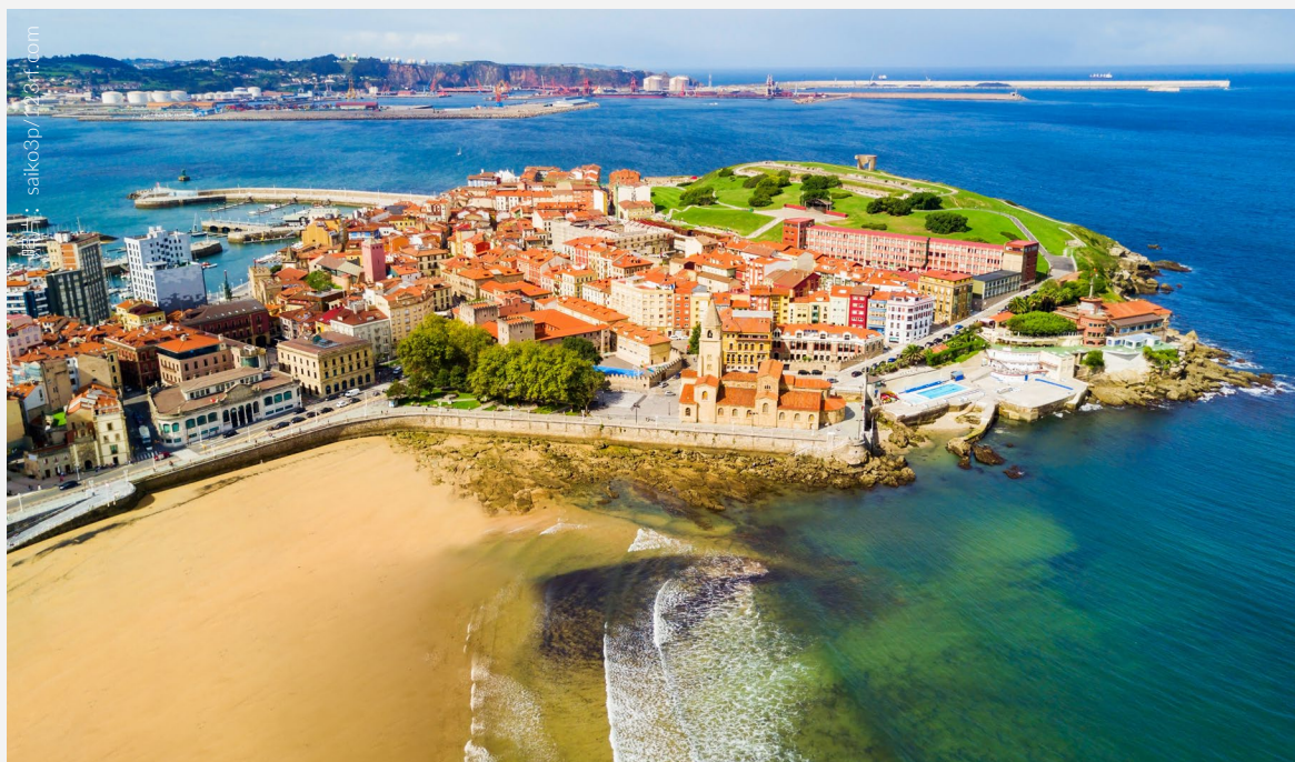
▲ 圣洛伦佐海滩 希洪

如果你喜欢历史和建筑，奥维耶多的宫殿会让你眼花缭乱。从美术博物馆所在的贝拉尔德 (Velarde) 宫到一座宏伟的十八世纪豪宅——坎波萨格拉多 (Camposagrado) 宫或者巴洛克风格的瑰宝——孔德德多雷诺 (Conde de Toreno) 宫。