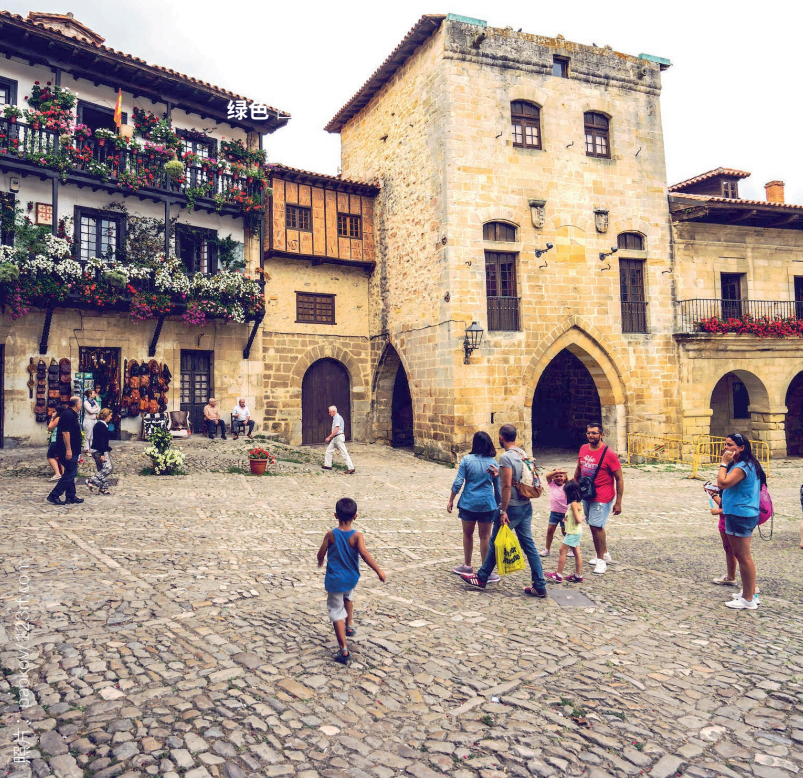
▲ 圣蒂亚纳德玛 坎塔布利亚