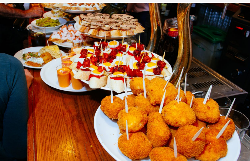
▲ 小吃 (PINTXO) 圣塞巴斯蒂安

请漫步于绿色西班牙的城市：都是被大自然包围的地方，充满了壮观的遗迹和丰富的文化生活。