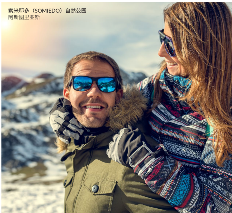
索米耶多（SOMIEDO）自然公园 阿斯图里亚斯