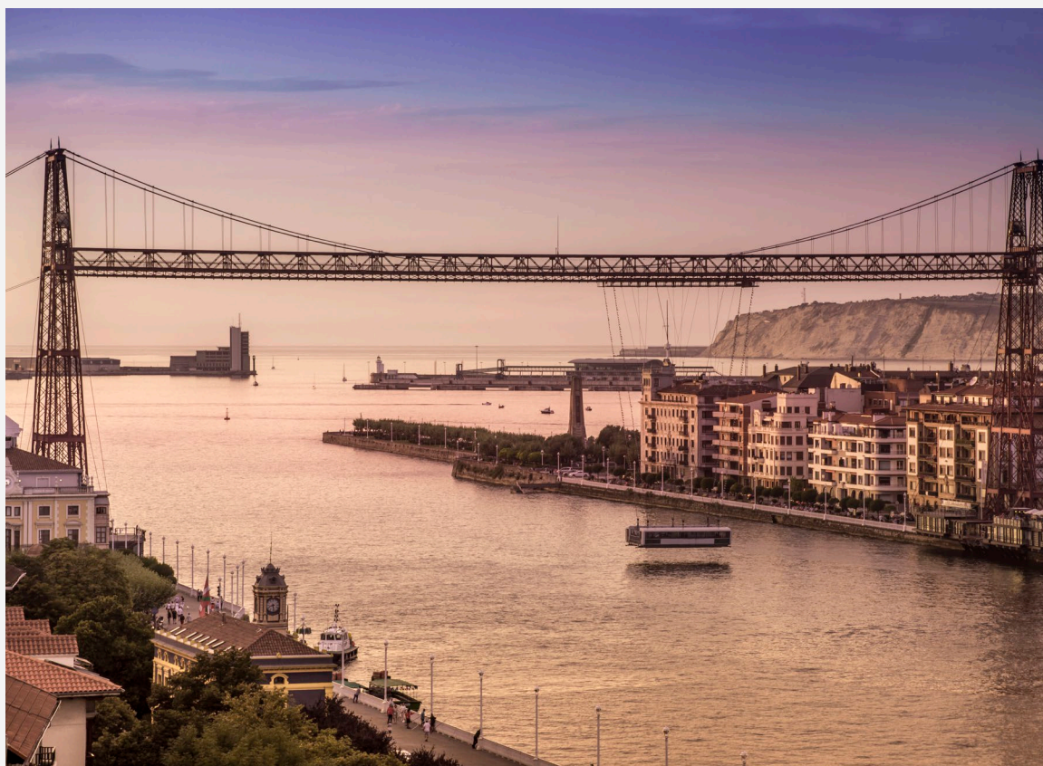
▲ 比斯开大桥 比斯开，赫特索

之后，你可以骑自行车到河边的老城区，在热闹的七条街（Siete Calles）的餐厅和酒吧享用美食。继续前行，你将通过被列为世界遗产的比斯开大桥横穿内尔比昂（Nervión）河口，这是世界上第一座金属结构的渡桥。