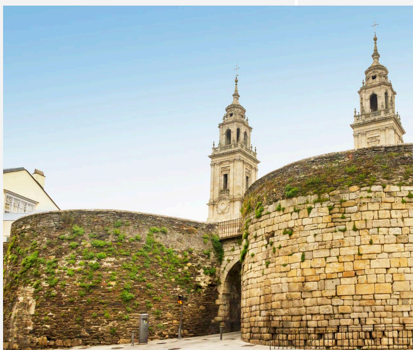
▲ 古罗马教堂和城墙 卢戈