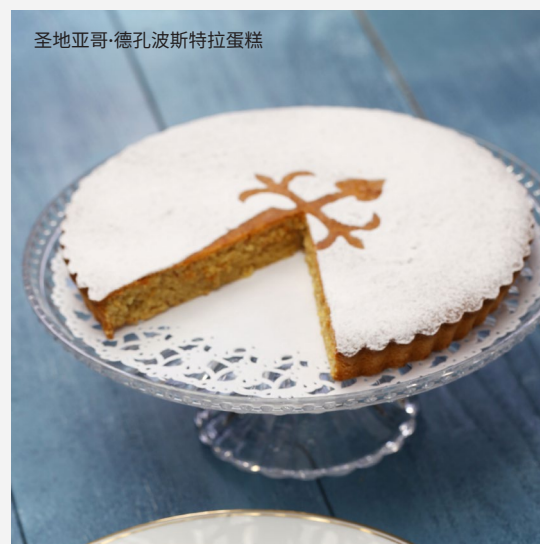
圣地亚哥·德孔波斯特拉蛋糕

像当地人一样在圣地亚哥生活，去阿瓦斯多斯市场（mercado de Abastos）采购。你可以找几个当地的美食市场，品尝最好的新鲜蔬菜、奶酪和加利西亚海鲜。