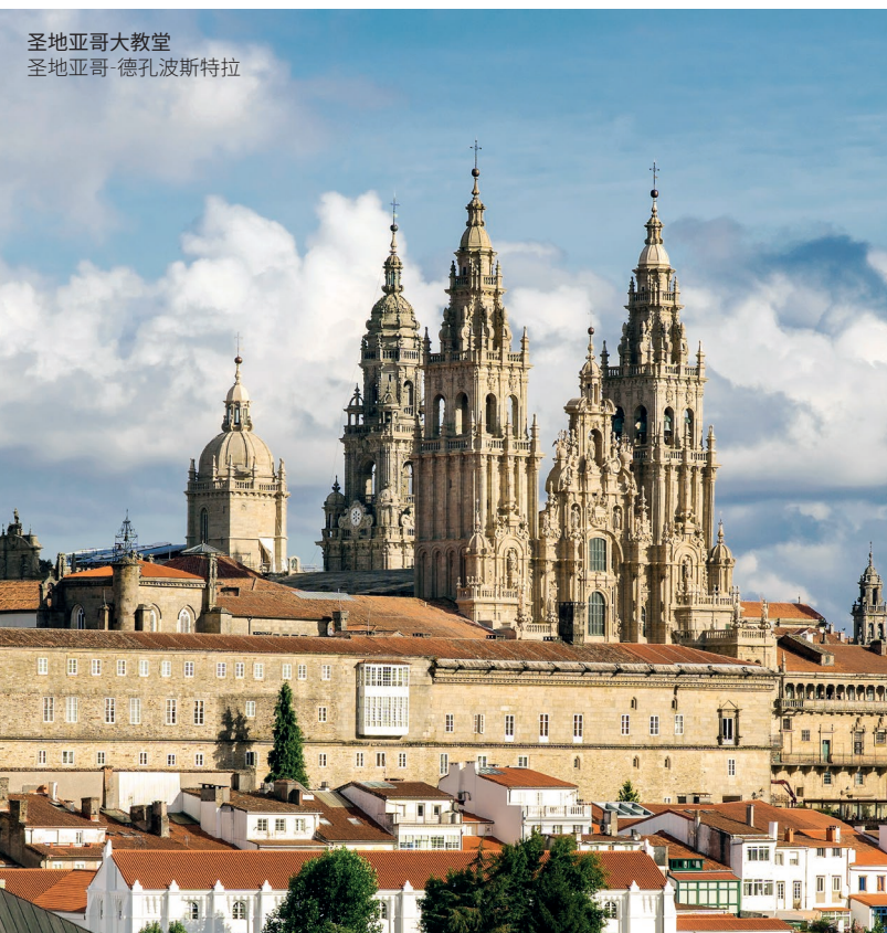
圣地亚哥大教堂 圣地亚哥-德孔波斯特拉

你将听到旧捕鲸港口的传说，例如卢阿尔卡（Luarca），然后你穿过埃奥河口（la ría del Eo）从卡斯特罗波尔到美丽的里瓦德奥渔村进入加利西亚地区。