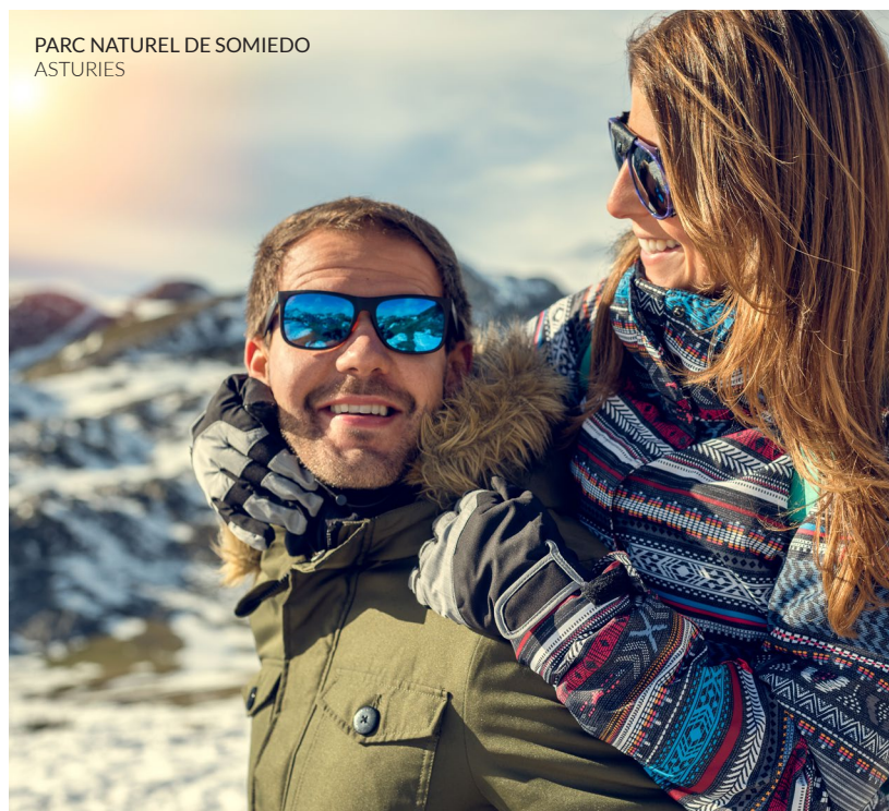
PARC NATUREL DE SOMIEDO ASTURIES