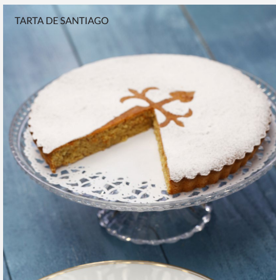
TARTA DE SANTIAGO

Vivez Saint-Jacques à la manière de ses habitants, en faisant vos courses au marché central . Vous y trouverez plusieurs étals de cuisine de marché où goûter les meilleurs légumes frais, des fromages et des fruits de mer galiciens.