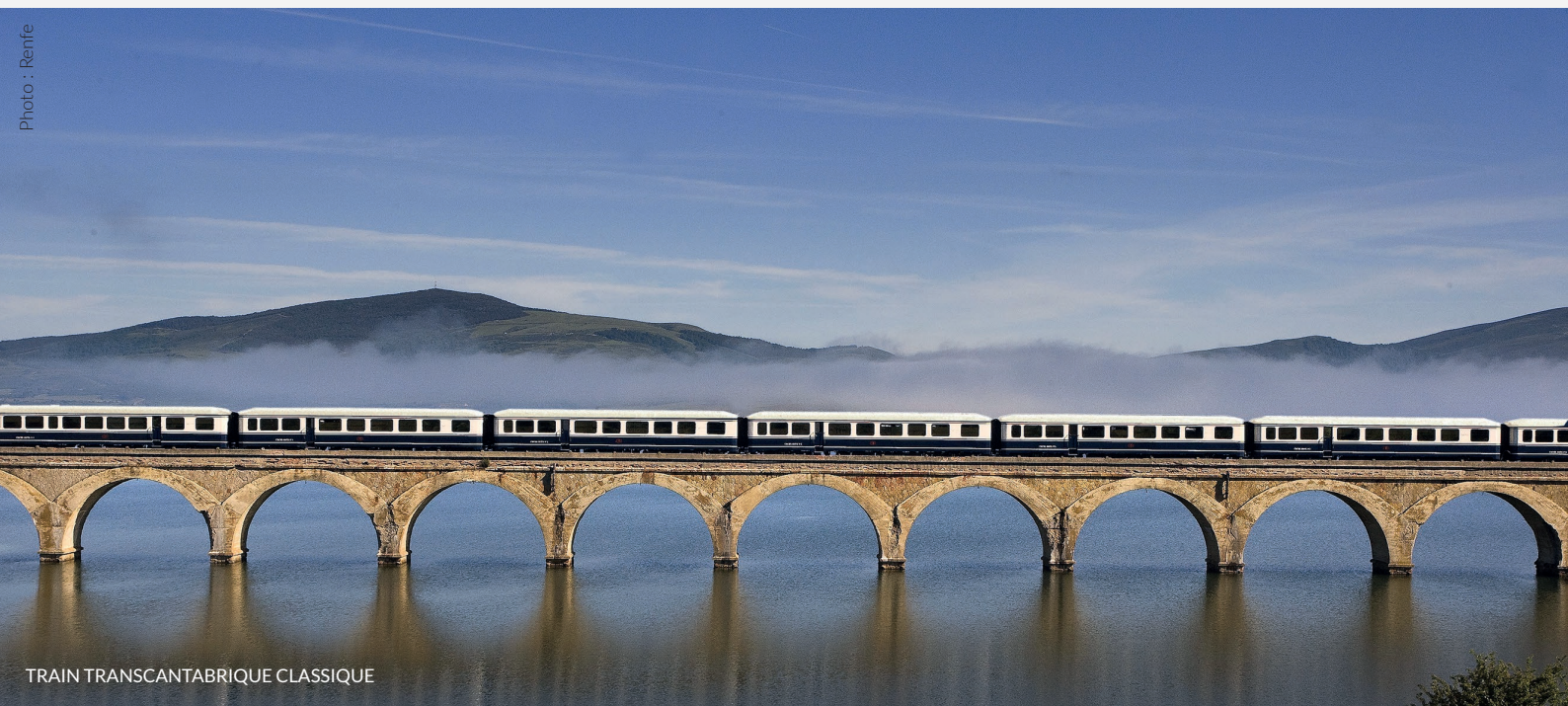
TRAIN TRASCANTABRIQUE CLASSIQUE