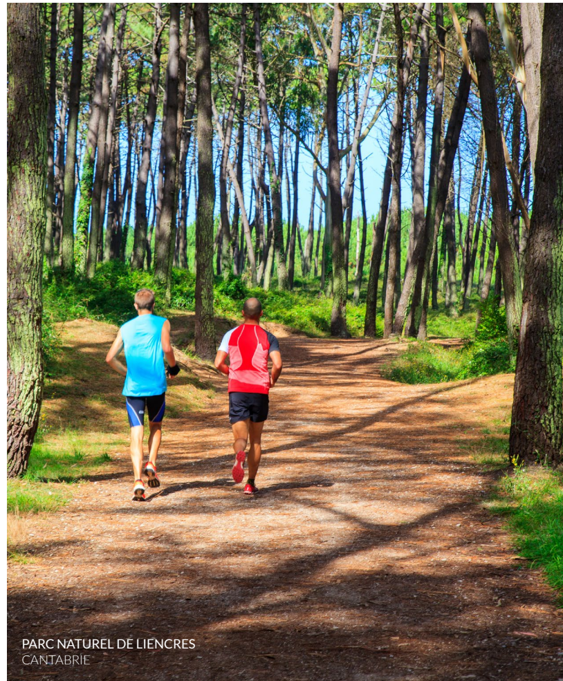
PARC NATUREL DE LIENCRES CANTABRIE

Mais il y a bien plus encore à faire : en Galice, rendez-vous au sommet des plus hautes falaises d'Europe dans la forêt d' A Capelada . Effectuez le circuit du Flysh , avec ses falaises imposantes, dans le Géoparc de la Côte basque . C'est là que se trouve l'ermitage San Juan de Gaztelugatxe , qui a servi de décor pour la célèbre série Game of Thrones . Au Pays basque , vous pourrez aussi découvrir la Réserve de la biosphère d'Urdaibai , avec des marais spectaculaires et pleins de vie.