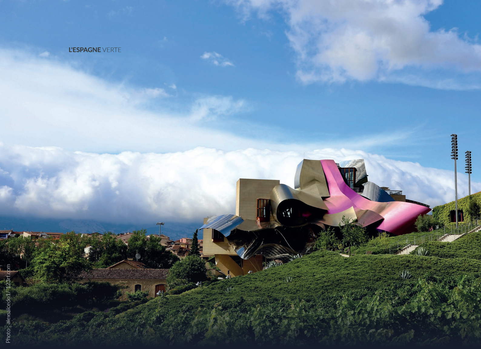
▲ CAVE MARQUÉS DE RISCAL ELCIEGO, ÁLAVA