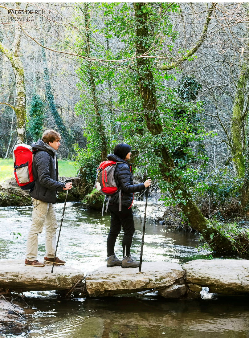
PALAS DE REI PROVINCE DE LUGO

Ce chemin est le plus ancien de tous ceux qui mènent à Saint-Jacques. Il suit un sentier tracé par les pèlerins dès le IXe siècle sur les terres de l'ouest des Asturies. Il part d' Oviedo , la capitale de la Principauté des Asturies . Cette ville très vivante abrite un riche patrimoine. Au cœur de la région des Asturies, le long de rivières puissantes, entre des gorges escarpées, des chutes d'eau et sous le couvert de chênaies millénaires, vous serez en communion avec la nature. Vous traverserez des villes comme Salas , déclarée ensemble historique. Vous traverserez ensuite les communes d' Allande et Grandas de Salime , où vous tomberez sans aucun doute sous le charme du paysage protégé des sierras de Carondio et Valledor . À proximité de la Galice, vous pourrez profiter de la vue magnifique sur le lac de Salime . Peu avant de rejoindre le Chemin français, à Palas de Rei (province de Lugo), vous atteindrez l' Alto del Acebo , à plus de 1 100 mètres au-dessus du niveau de la mer, et vous découvrirez l'imposante ville de Lugo , ainsi que sa muraille romaine , déclarée patrimoine mondial. Tout au long de ce parcours, vous pourrez aussi visiter de jolis villages galiciens, comme Melide ou Arzúa.