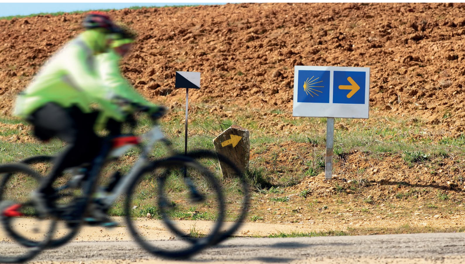
▲ CHEMIN DE COMPOSTELLE À VÉLO

À pied, en vélo ou en train, oubliez la routine et parcourez le nord de l'Espagne d'un bout à l'autre sur ses chemins historiques. Un voyage qui a changé la vie de beaucoup et pendant lequel vous attendent des expériences de toutes sortes qui vous marqueront à jamais.