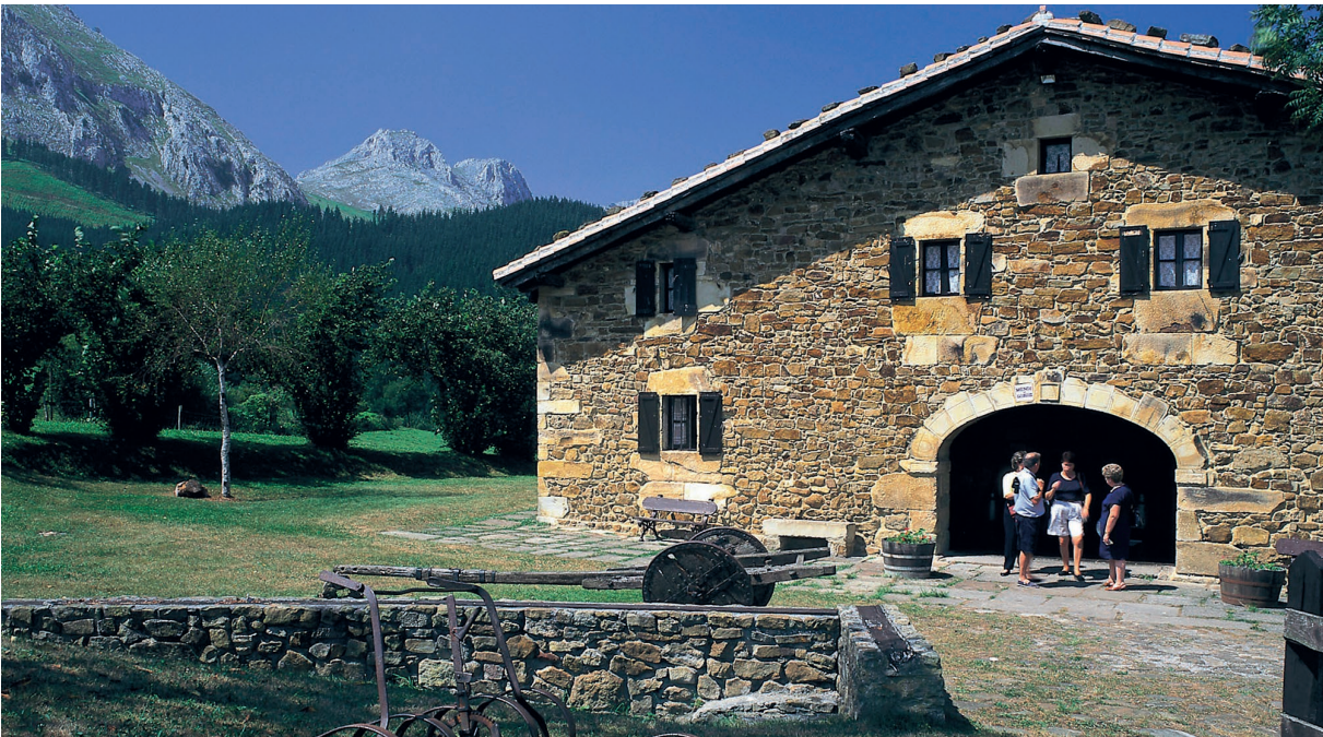
▲ RESTAURANT À AXPE, GUIPUSCOA, PAYS BASQUE