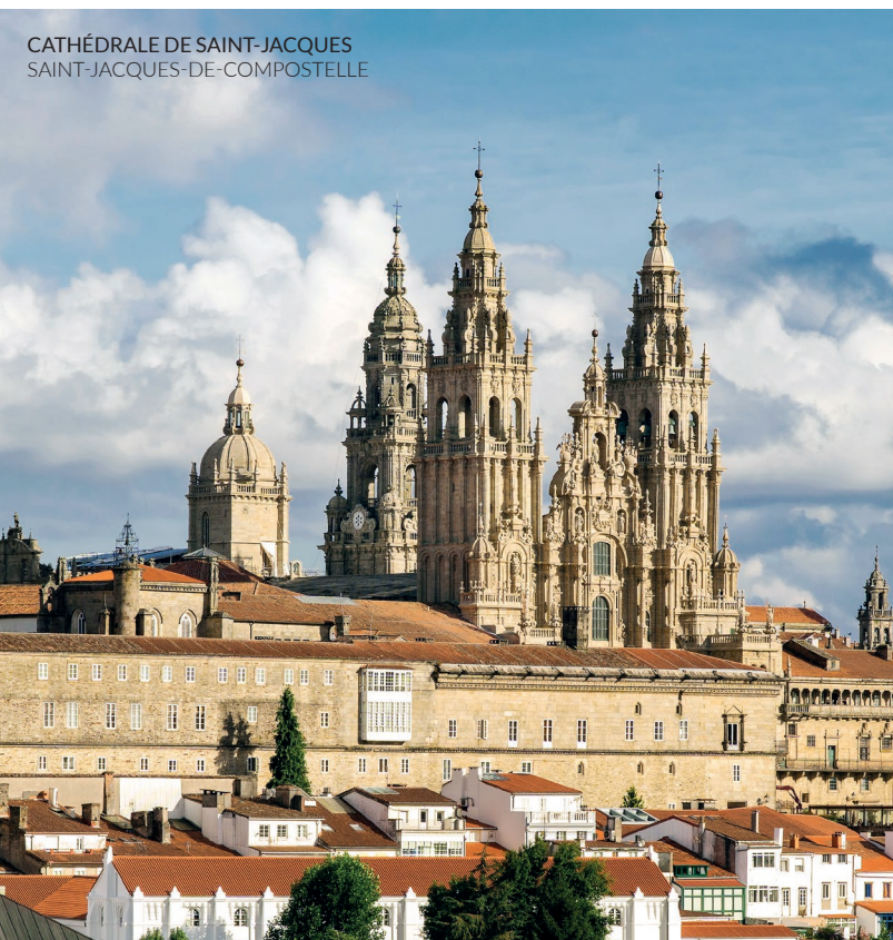
CATHÉDRALE DE SAINT-JACQUES SAINT-JACQUES-DE-COMPOSTELLE

Sur ce parcours, ne manquez pas non plus la cathédrale de Mondoñedo . Vous emprunterez des sentiers médiévaux et passerez par les petits hameaux de Sobrado dos Monxes et son célèbre monastère, ou découvrirez des trésors de la nature, comme la laguna de Sobrado . Vous pourrez séjourner dans la plus grande auberge de Galice au monte do Gozo . Vous apercevrez les tours de la cathédrale de Saint-Jacques-de-Compostelle . Vous voilà arrivé au but !