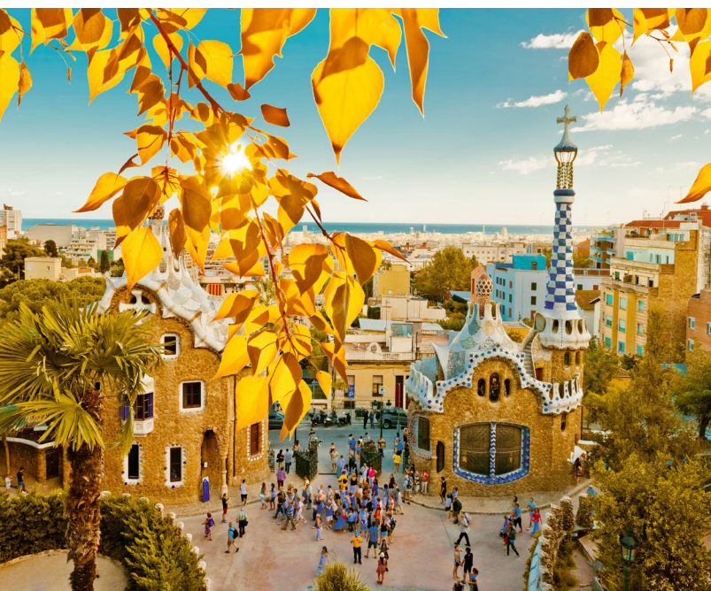
▲ PARK GÜELL BARCELONA