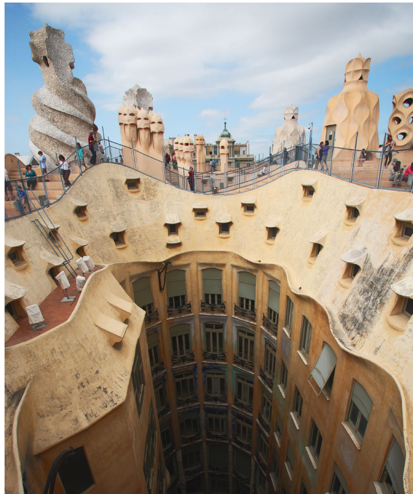
▼ LA PEDRERA - CASA MILÀ BARCELONA

Weitere Schauplätze, die Sie auf den Spuren der Charaktere dieses Films entdecken können, sind der Vergnügungspark Tibidabo mit seinem unvergleichlichen Blick auf die Stadt, wo auch Szenen von Der Maschinist mit Christian Bale gedreht wurden, das Gewimmel in den Straßen und die traditionellen Blumenstände auf dem Prachtboulevard Las Ramblas oder die bezaubernde Plaza de San Felipe Neri . Neben Barcelona spielt Woody Allens Film auch in Oviedo und Avilés (Asturien), zwei Städten, für die das New Yorker Genie eine besondere Bewunderung empfindet.