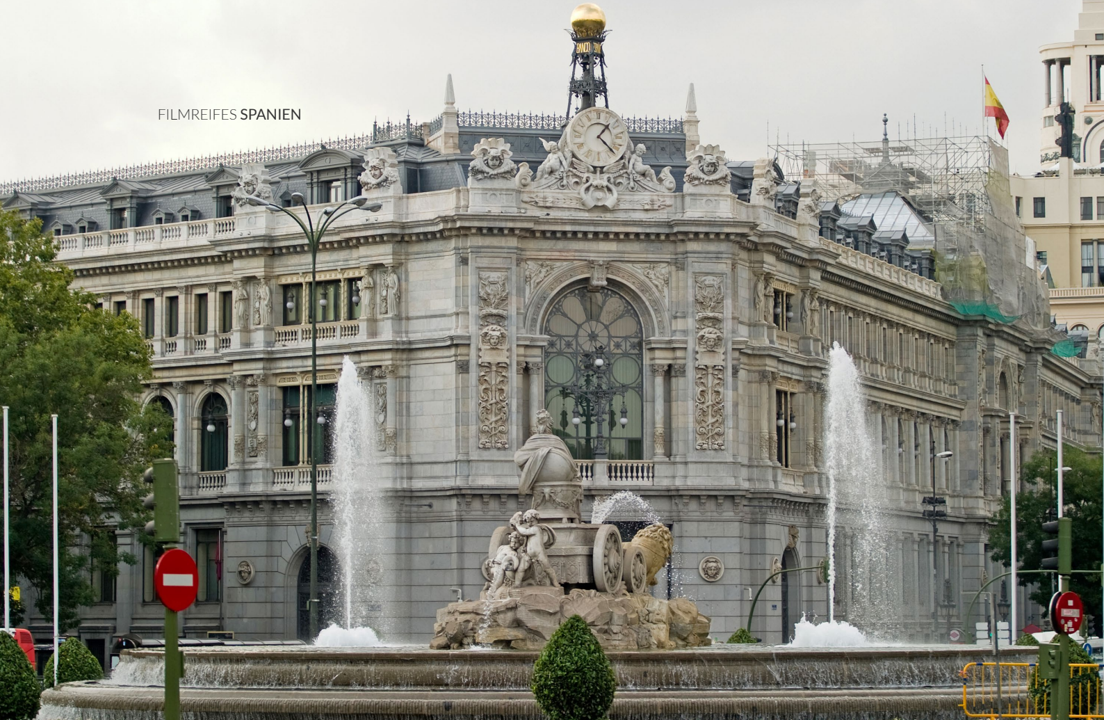
▲ BANCO DE ESPAÑA MADRID

zu Abend zu essen und in alternativen Läden zu shoppen.