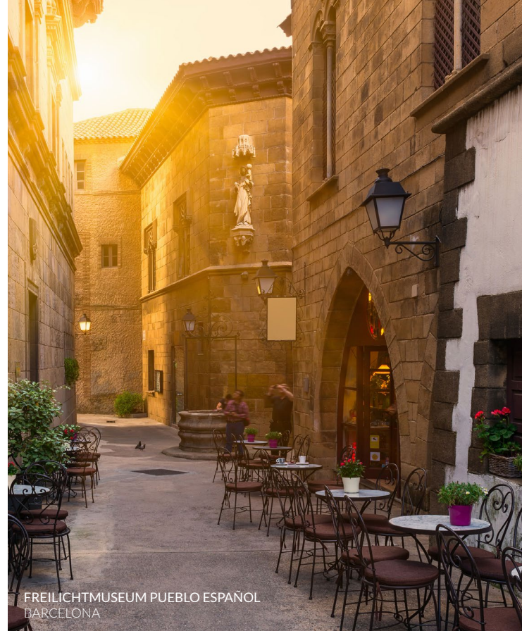
FREILICHTMUSEUM PUEBLO ESPAÑOL BARCELONA

Einige Winkel, die in Das Parfum gezeigt werden, sind eher unbekannt. Dazu gehört auch der Park Laberint d'Horta im Norden der Stadt mit seinem verworrenen Labyrinth aus Zypressen, Tempeln, Brunnen und mythologischen Skulpturen. Oder das Poble Espanyol , ein Freilichtmuseum am Fuße des Montjuïc, in dem repräsentative Gebäude, Plätze und Straßen diverser spanischer Städte maßstabgetreu nachgebaut wurden. Sein Hauptplatz ist die Kulisse für den Höhepunkt des Films.