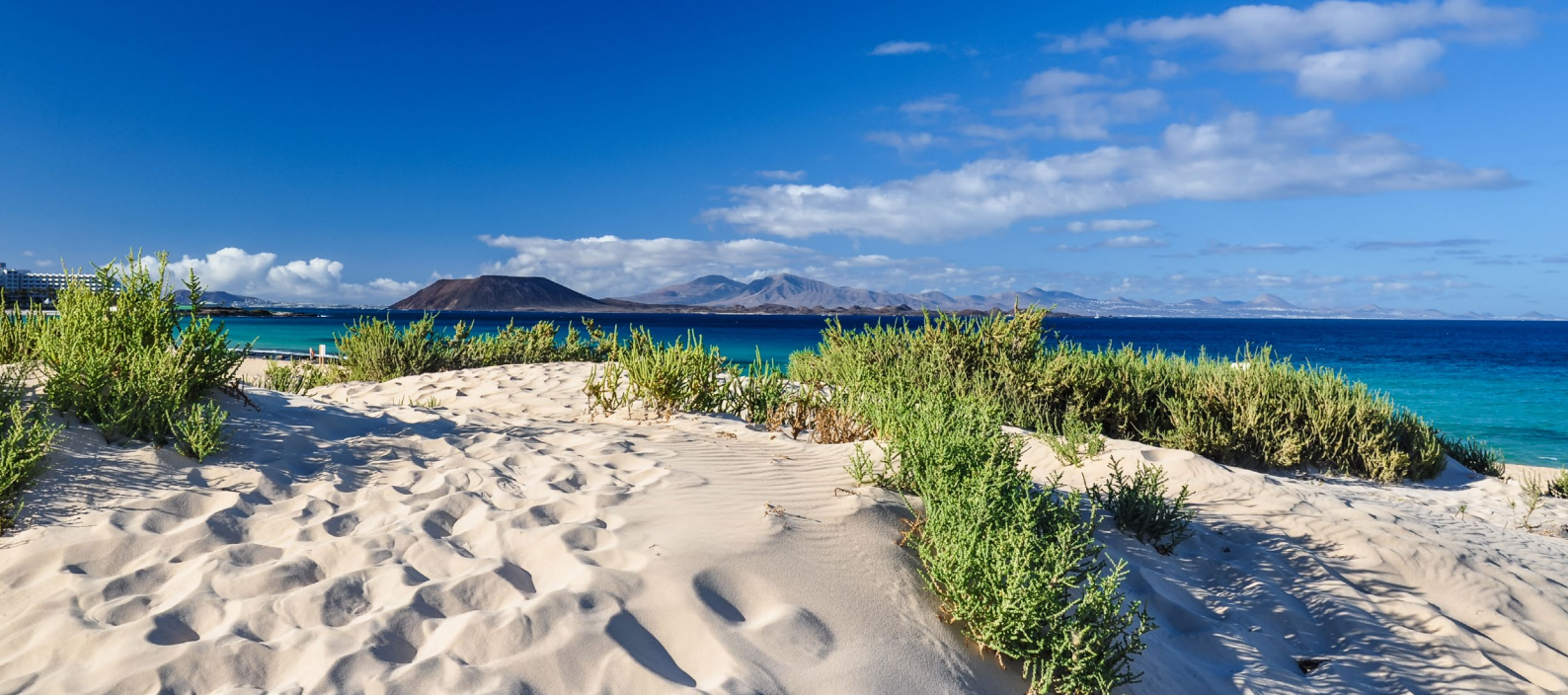
▲ NATURPARK CORRALEJO FUERTEVENTURA

In Kampf der Titanen von Louis Leterrier kann man den Teide in Aktion sehen. Dieser inaktive Vulkan erhebt sich in der Mitte Teneriffas und ist der höchste Berg Spaniens. Der Teide-Nationalpark diente als Nachbildung der mythologischen Unterwelt, in der ein Großteil der Filmhandlung abspielt.