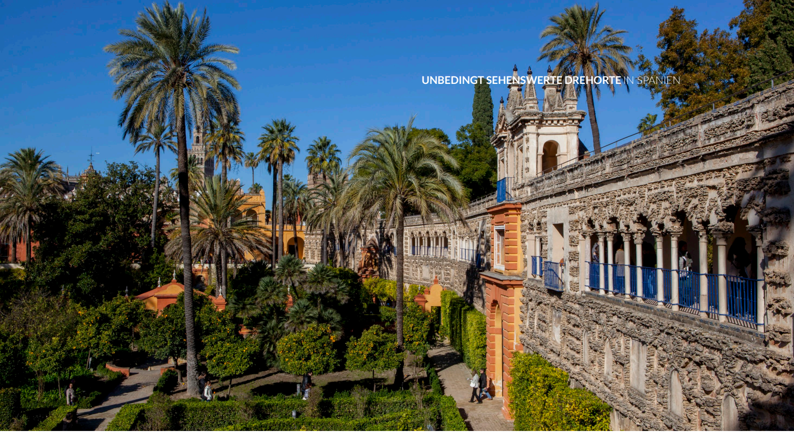
▲ GARTEN DES MERKUR-TEICHS KÖNIGLICHER ALCÁZAR SEVILLA

Die Casa de Pilatos ist ein weiterer Ort, der Scott begeisterte. Er wählte diesen Palast mit seiner Mischung aus italienischer Renaissance und Mudéjar-Stil als Kulisse für die römische Prätoresidenz in Jerusalem. Schauen Sie sich das Interieur an und wandeln Sie durch die wunderschönen Gärten, die typisch für die Adelspaläste des Stadtzentrums mit ihren einzigartigen plateresken Sockeln und Gittern sind.