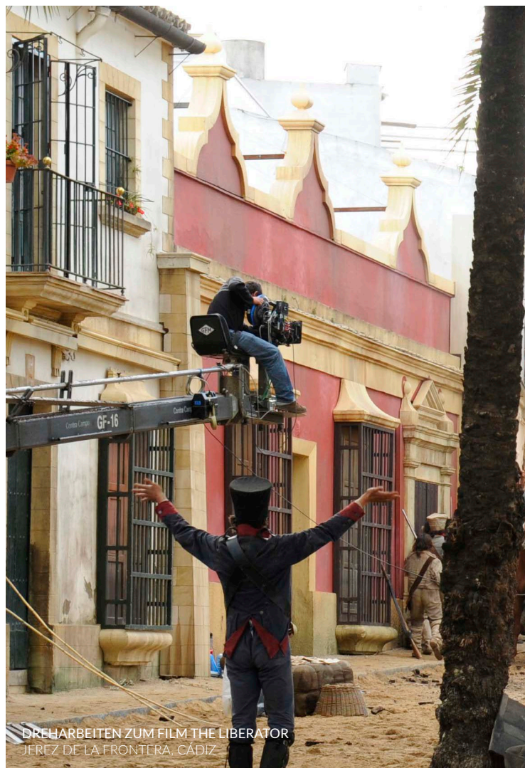
DREHARBEITEN ZUM FILM THE LIBERATOR JEREZ DE LA FRONTERA, CÁDIZ

Die Schauspieler erscheinen im Film auf der Calle Ancha , der zentralen Verkehrsachse der Stadt. Ihre Hauptmerkmale sind herrschaftliche Paläste wie die Casa de los Cinco Gremios , Kirchen wie die Conversión de San Pablo und die Balkone der Gebäude.