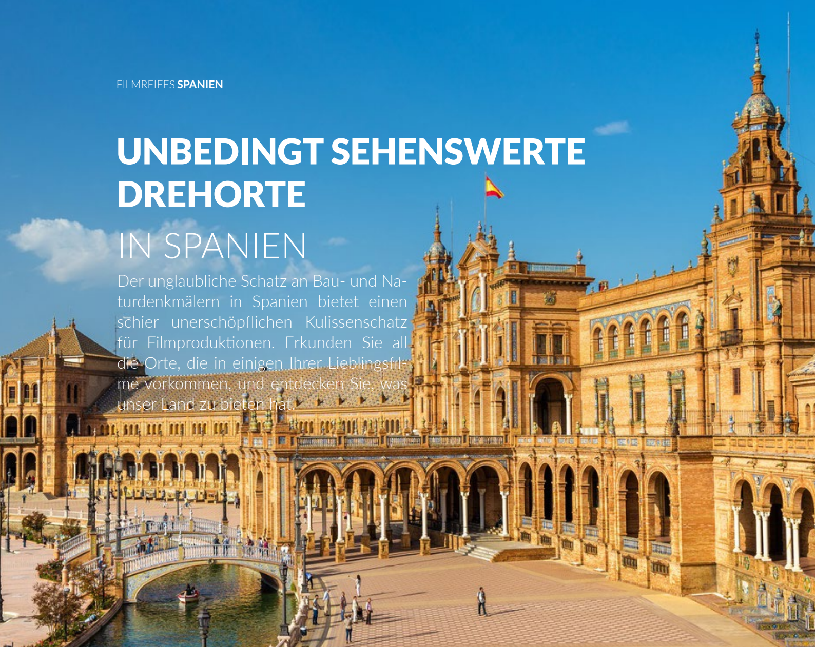
▲ PLAZA DE ESPAÑA SEVILLA

Der unglaubliche Schatz an Bau- und Naturdenkmälern in Spanien bietet einen schier unerschöpflichen Kulissenschatz für Filmproduktionen. Erkunden Sie all die Orte, die in einigen Ihrer Lieblingsfilme vorkommen, und entdecken Sie, was unser Land zu bieten hat.