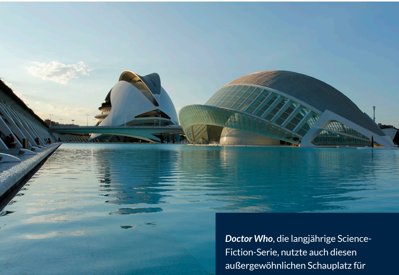
▲ STADT DER KÜNSTE UND WISSENSCHAFTEN VALENCIA