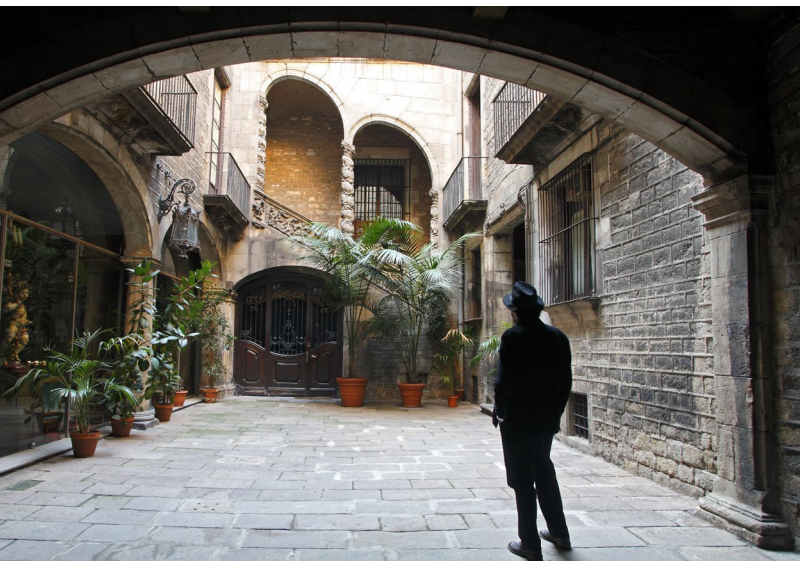
▲ BARRI GÒTIC BARCELONA

Der von Tom Tykwer nach dem gleichnamigen Bestseller von Patrick Süskind gedrehte Film Das Parfum ist ein weiteres filmisches Werk, das sich ideal eignet, um den Charme von Barcelona zu entdecken, das hier zum Paris des 18. Jahrhunderts wurde. Die engen Gassen des Barri Gòtic bilden den Schauplatz für die Abenteuer von Grenouille, der Hauptfigur des Films. Dort können Sie bei einem Spaziergang die Überreste der römischen Vergangenheit der Stadt, Ruinen alter Stadtmauern und die engen Gassen des Judenviertels sehen sowie die gotische Kathedrale und bedeutende Paläste entdecken.