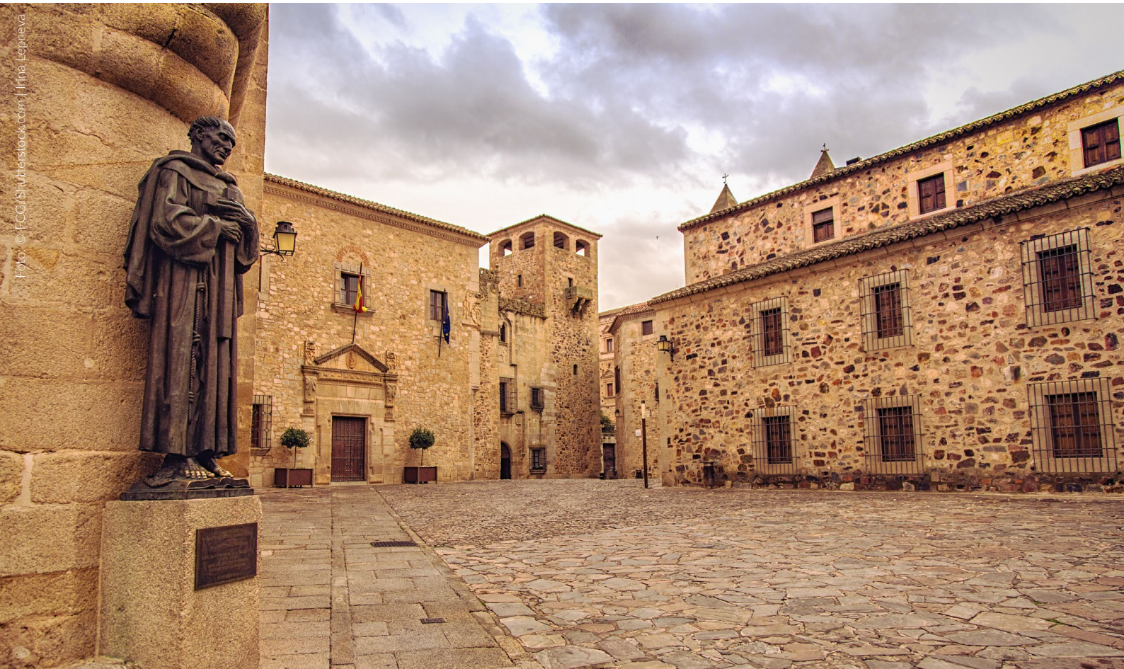
▲ PLAZA DE SANTA MARIA UND STATUE VON SAN PEDRO DE ALCANTARA CÁCERES

Sevilla und seine maurische Architektur haben das südliche Königreich Dorne, die Heimat des Hauses Martell, zum Leben erweckt. Im Herzen dieser schönen Stadt steht der zum Weltkulturerbe erklärte Königliche Alcázar . In dieser Anlage wurden die Wassergärten, die Privatresidenz des Herrn von Sonnspeer, zum Leben erweckt. Ein Spaziergang zwischen Brunnen, Orangenbäumen und Palmen ist ein wahres Fest für die Sinne.