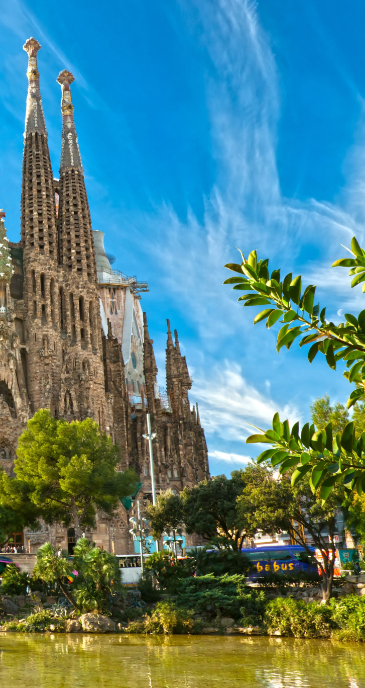
▲ BASILIKA SAGRADA FAMILIA BARCELONA

Auch der Park Güell fehlt nicht in dem Film. An dessen eidechsenförmigem Brunnen wurde eine Szene mit Javier Bardem und Rebecca Hall gedreht. Die bizarren Formen und gewagten Farbkombinationen des Parks versetzen den Besucher in Kombination mit der Vegetation in eine magische Welt.