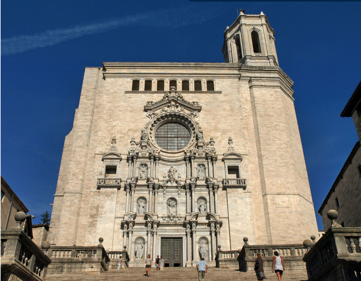
KATHEDRALE SANTA MARÍA VON GIRONA

In den gepflasterten Straßen der Altstadt von Girona bewegte sich Arya, die sich in Braavos verirrt hatte, und auf den beeindruckenden Treppen der Kathedrale wurde die Große Septe von Baelor in Königsmund nachgebildet. Sie können Sie nicht hinaufreiten wie Jaime Lannister, aber Sie werden erstaunt sein über ihre imposanten Ausmaße.