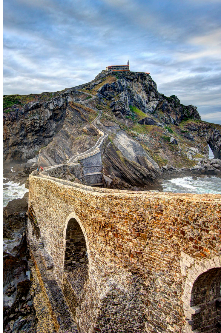
▲ EINSIEDELEI SAN JUAN GAZTELUGATXE BIZKAIA

Unser Land diente nicht nur als Setting für Westeros, sondern seine Vielfalt der Land-