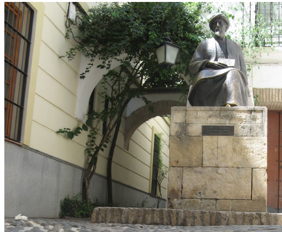
▲ ESCULTURA E PRAÇA DE MAIMÓNIDES

Ainda na Judiaria, documentando o passado hebreu da cidade, encontra-se a Casa de Sefarad - Casa da Memória . Conta com uma exposição permanente através de várias salas, nas quais é possível explorar