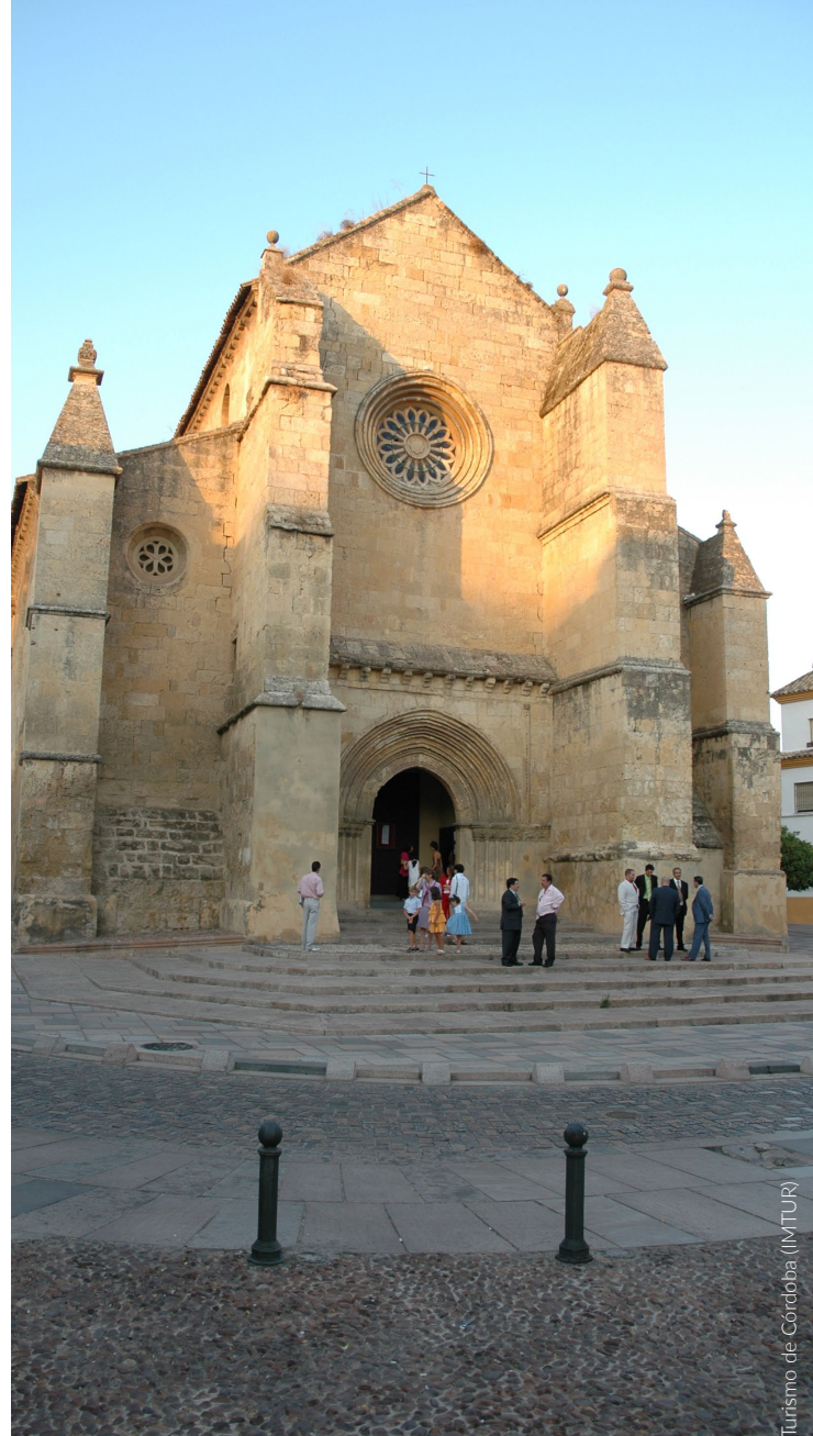
▲ IGREJA DE SANTA MARINA

Por seu lado, a igreja de San Agustín destaca-se pelo maravilhoso interior, um dos tesouros cordoveses do barroco. Graças ao seu recente restauro, ficaram à vista bonitos murais e frescos de grande riqueza cromática. Tem muitas semelhanças com as capelas da igreja de San Cayetano , situada naquela que se conhece como Encosta de San Cayetano. As suas abóbadas e detalhes decorativos vão-te surpreender.