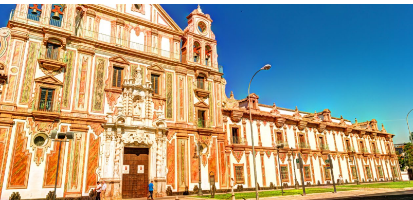
▲ PALÁCIO DE LA MERCED

Também encontrarás interessantes centros de arte, como o palácio de La Merced , antigo convento que acolhe exposições temporárias. O edifício é um dos melhores representantes do barroco cordovês graças a espaços como o seu claustro principal.