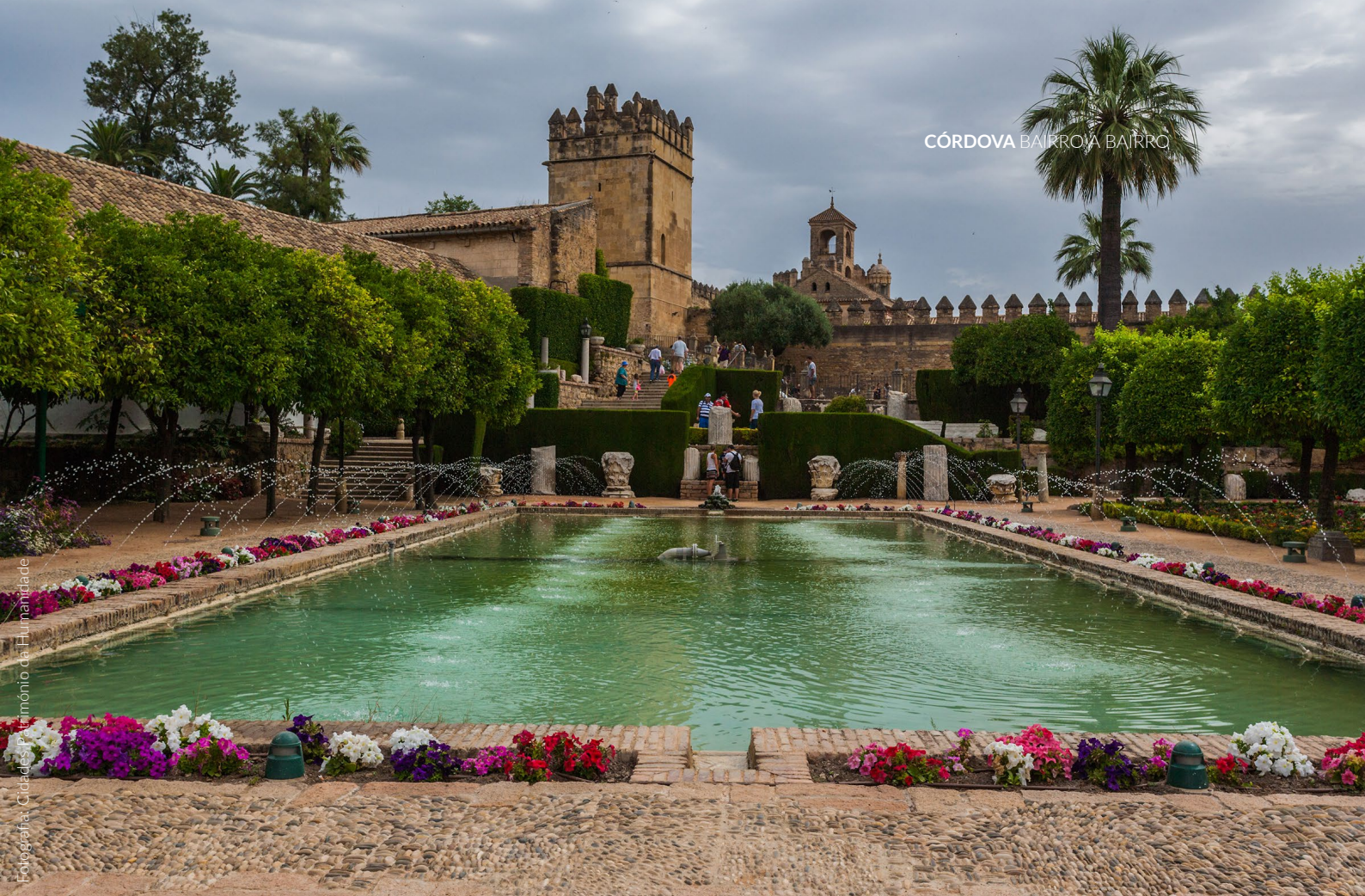
▲ ALCÁZAR DOS REIS CRISTÃOS