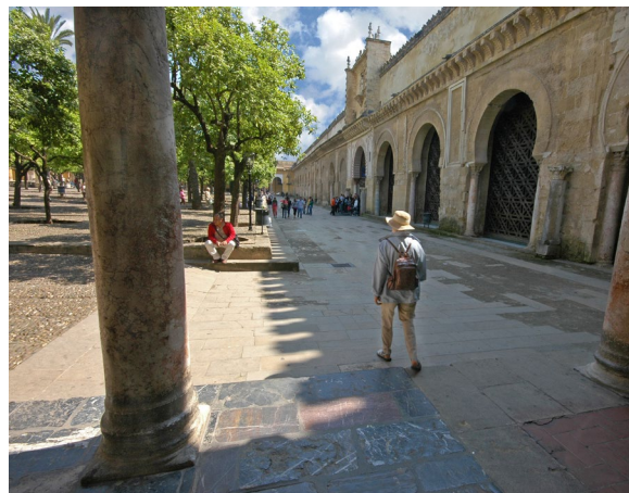
▲ PÁTIO DAS LARANJEIRAS MESQUITA-CATEDRAL DE CÓRDOVA

O bonito Pátio das Laranjeiras é a antesala do impressionante bosque de colunas com arcos bicolores em ferradura que se encontram no interior.