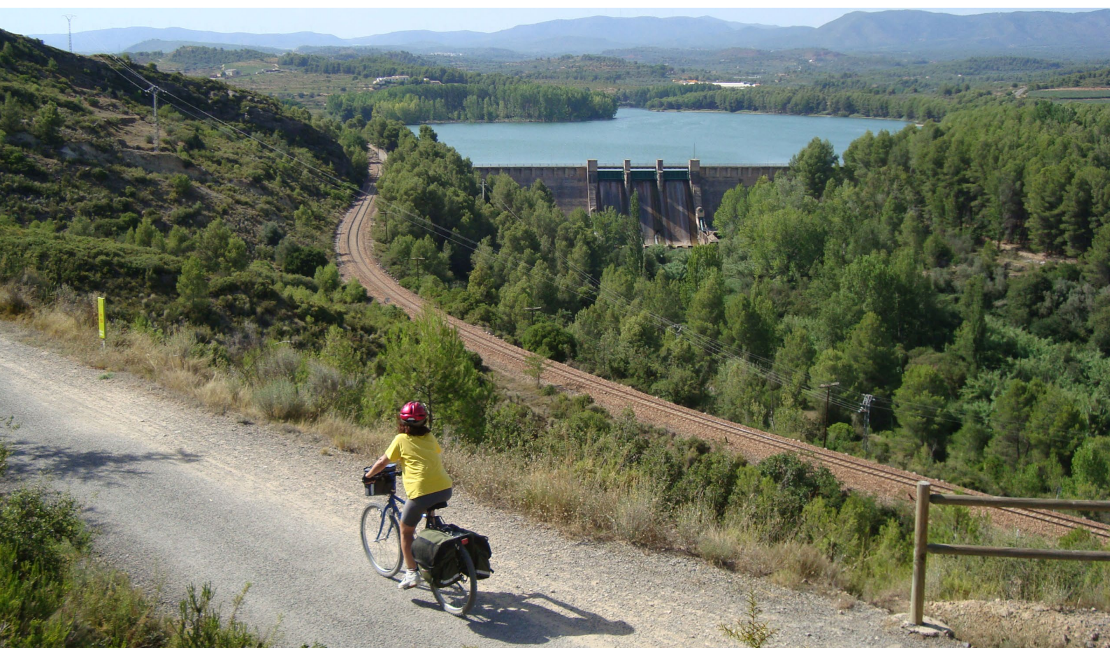
▲ VOIE VERTE DE OJOS NEGROS CASTELLÓN