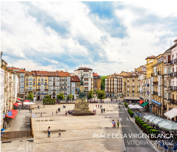
PLACE DE LA VIRGEN BLANCA VITORIA-GASTEIZ