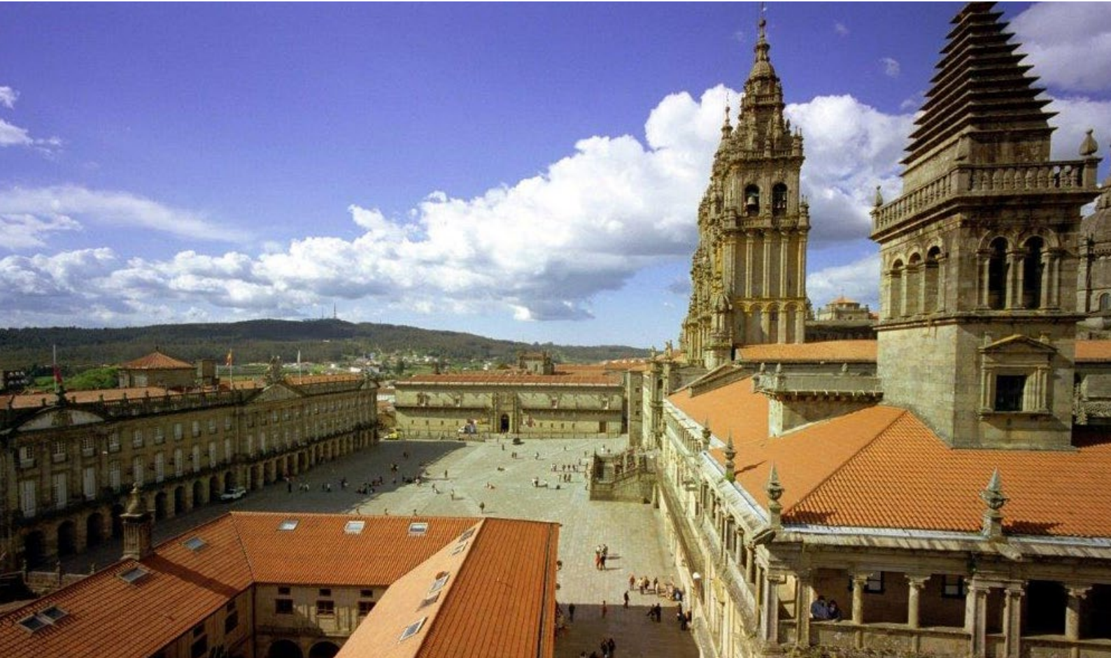
▲ 奥布拉多伊罗广场