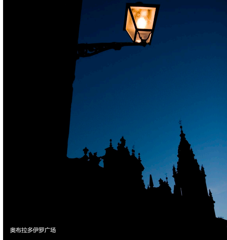
奥布拉多伊罗广场

请参观贝尔维斯修道院和威严的梅诺尔神学院，它们被一条天然护城河与名胜古迹区分割开。接下来，在贝尔维斯公园漫步。在高处，你将欣赏到城市的美景。