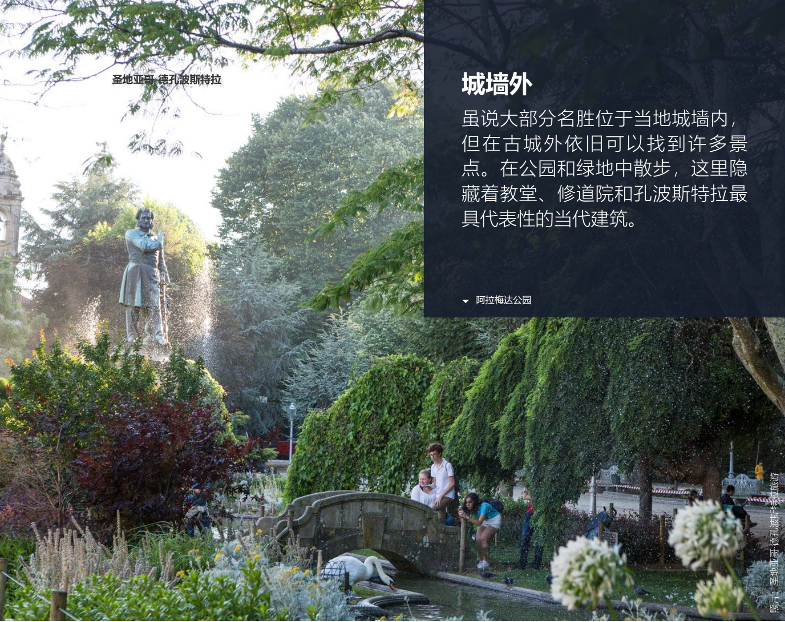
阿拉梅达公园·圣地亚哥·德孔波斯特拉·旅游