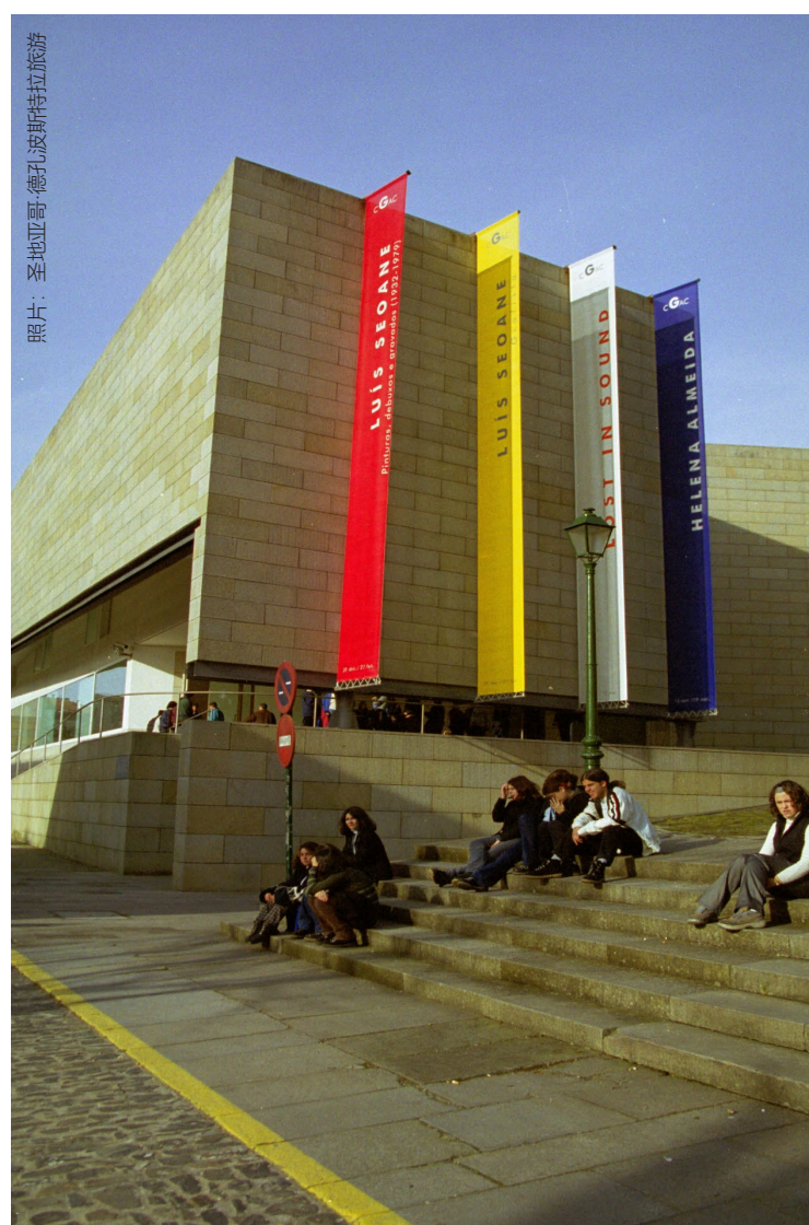
▼ 加利西亚当代艺术中心

在加利西亚当代艺术中心举行面向家庭的工作坊，孩子们在这里将体验艺术。他们还会喜欢像波博加莱戈或魔法博物馆这样的博物馆。