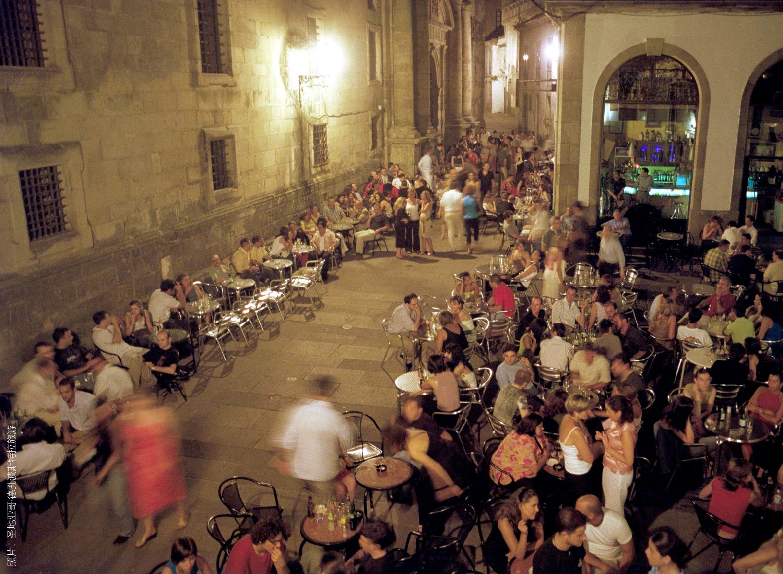
▲ SAN PAIO DE ANTEALTARES