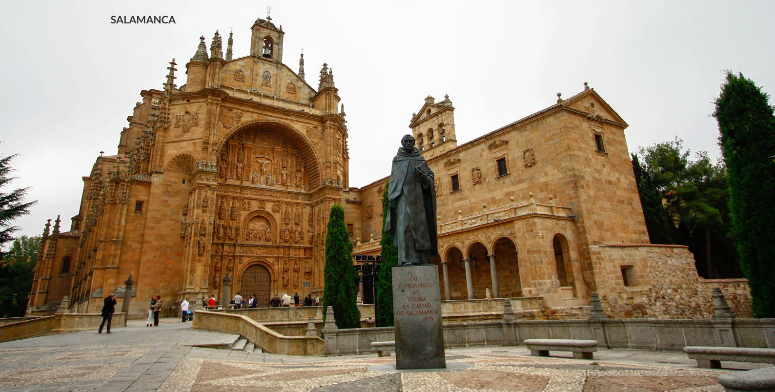
▲ CONVENTO DE SAN ESTEBAN

Outro exemplo é o palácio de Orellana , que rompe os cânones da arquitetura plateresca. Um dos elementos mais originais é a escadaria de comunicação entre as galerias alta e baixa, situada num dos extremos da fachada, atrás da torre.