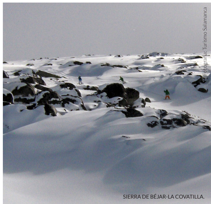
SIERRA DE BÉJAR-LA COVATILLA.

como lajes, miliários e esgotos. Se és amante do esqui, deves saber que muito perto desta zona se encontra a estação da Sierra de Béjar-La Covatilla.