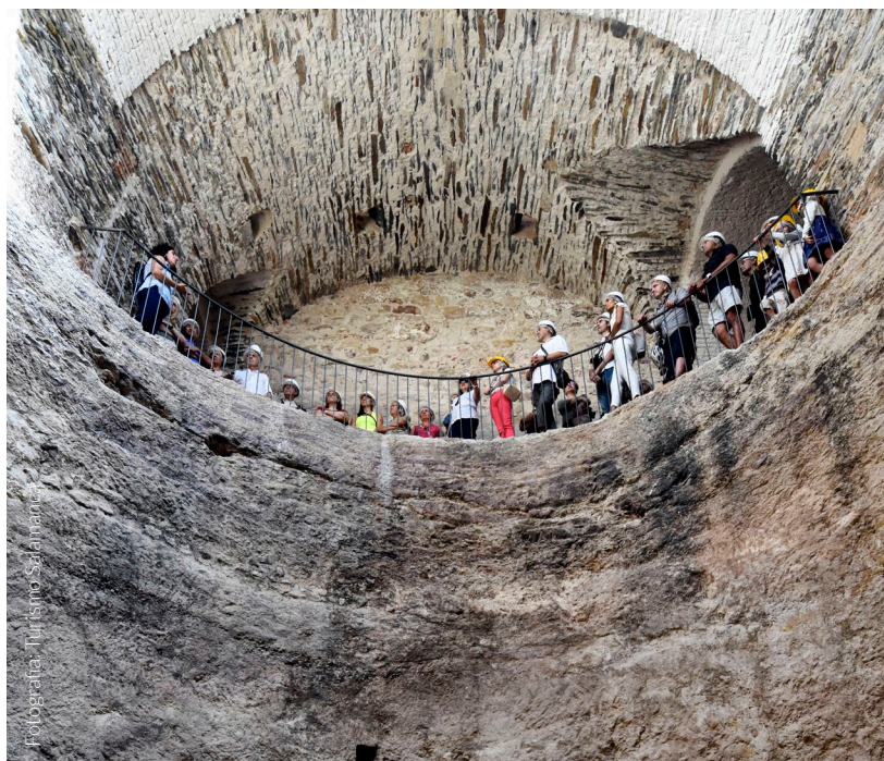
▲ POÇO DE NEVE

Também poderás ir até ao Poço de Neve , que liga a muralha aos restos do convento de San Andrés. Podes explorar a lendária Grua de Salamanca , a cripta da antiga igreja de San Cebrián, cuja origem alguns