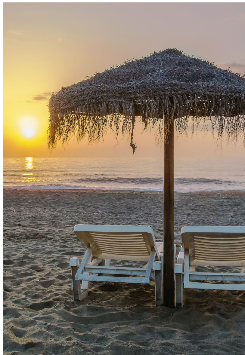
▲ STRAND VON TORREMOLINOS MÁLAGA

Wenn Sie genug haben von dem Rummel der Strandpromenade, können Sie sich in den Stadtteil El Calvario zurückziehen. Er ist eines der ältesten Viertel von Torremolinos. Sie können dort einen Drink nehmen und sich in einer seiner Tavernen unter die Leute mischen. Der Plaza Blas Infante und der Brunnen Los Manantiales werden Ihre Aufmerksamkeit auf sich ziehen.