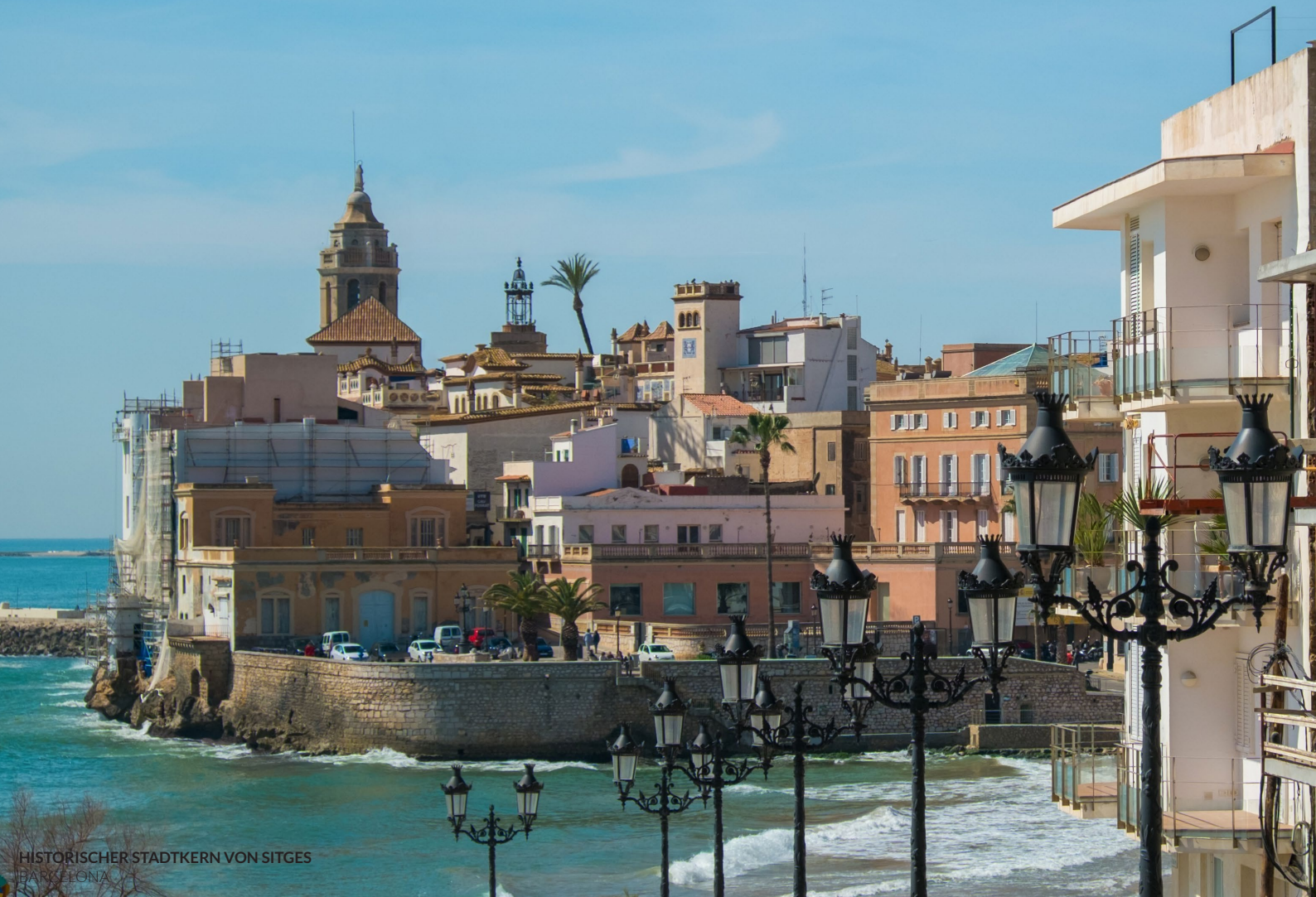
HISTORISCHER STADTKERN VON SITGES BARCELONA