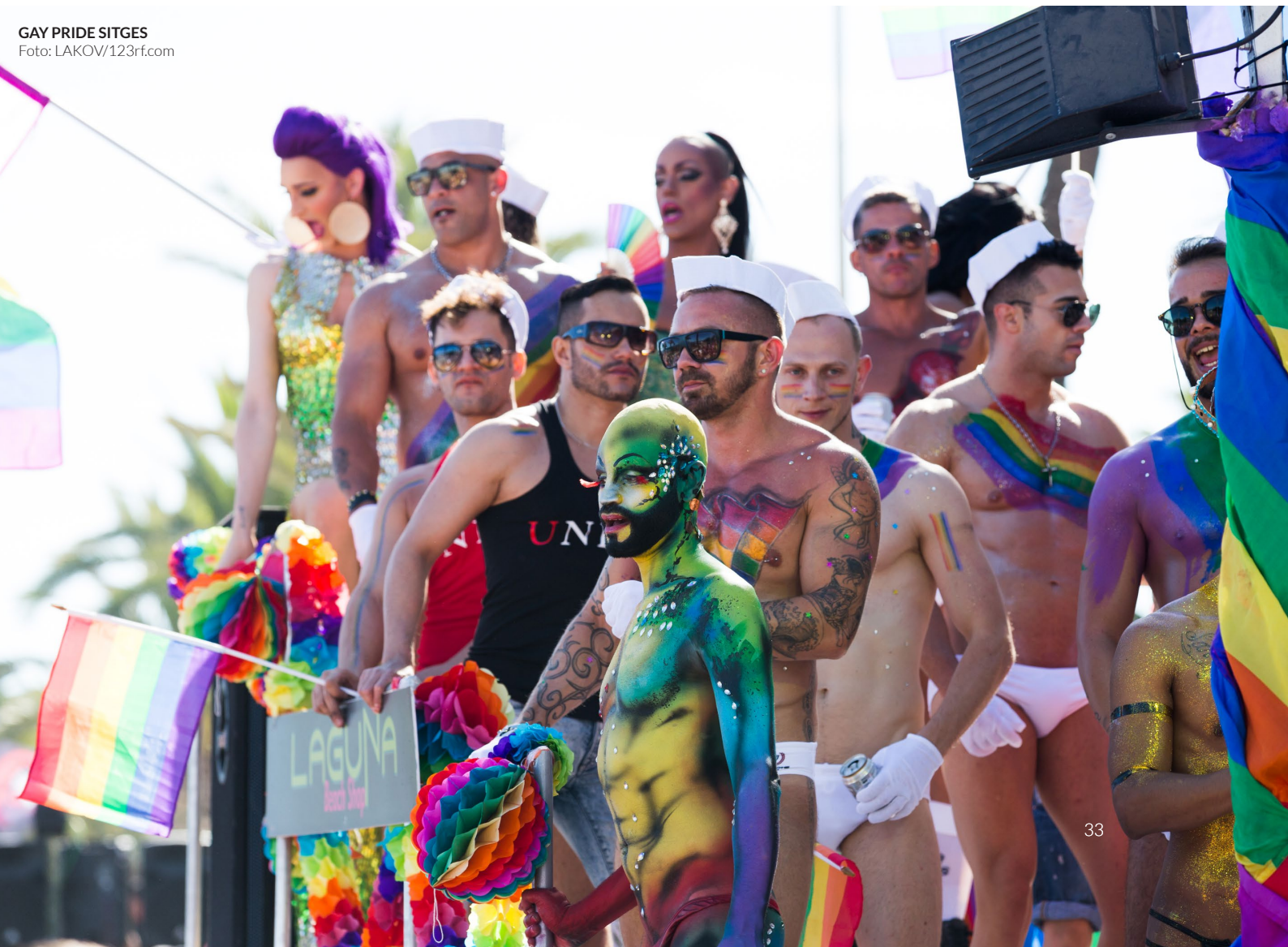
GAY PRIDE SITGES

Trauen Sie sich zu, zwei Wochen zu feiern? Kommen Sie im August nach Barcelona und nehmen Sie an diesem riesigen Festival teil. Machen Sie mit bei den berühmten Pool-Partys , tanzen Sie im Rhythmus der Musik, die von angesagten DJs aufgelegt wird, und amüsieren Sie sich auf der großen Party des Wasserparks Illa Fantasia . Das Festival bietet auch kulturelle und sportliche Aktivitäten so wie LGTBIQ+-Themenvorträge.