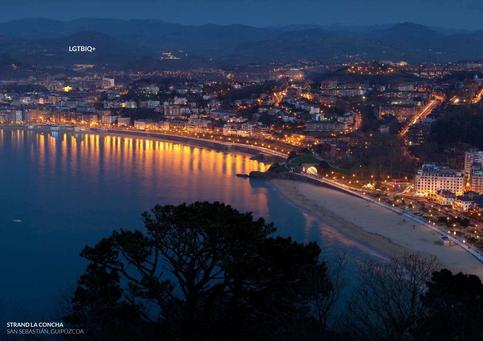
STRAND LA CONCHA SAN SEBASTIÁN, GUIPÚZCOA