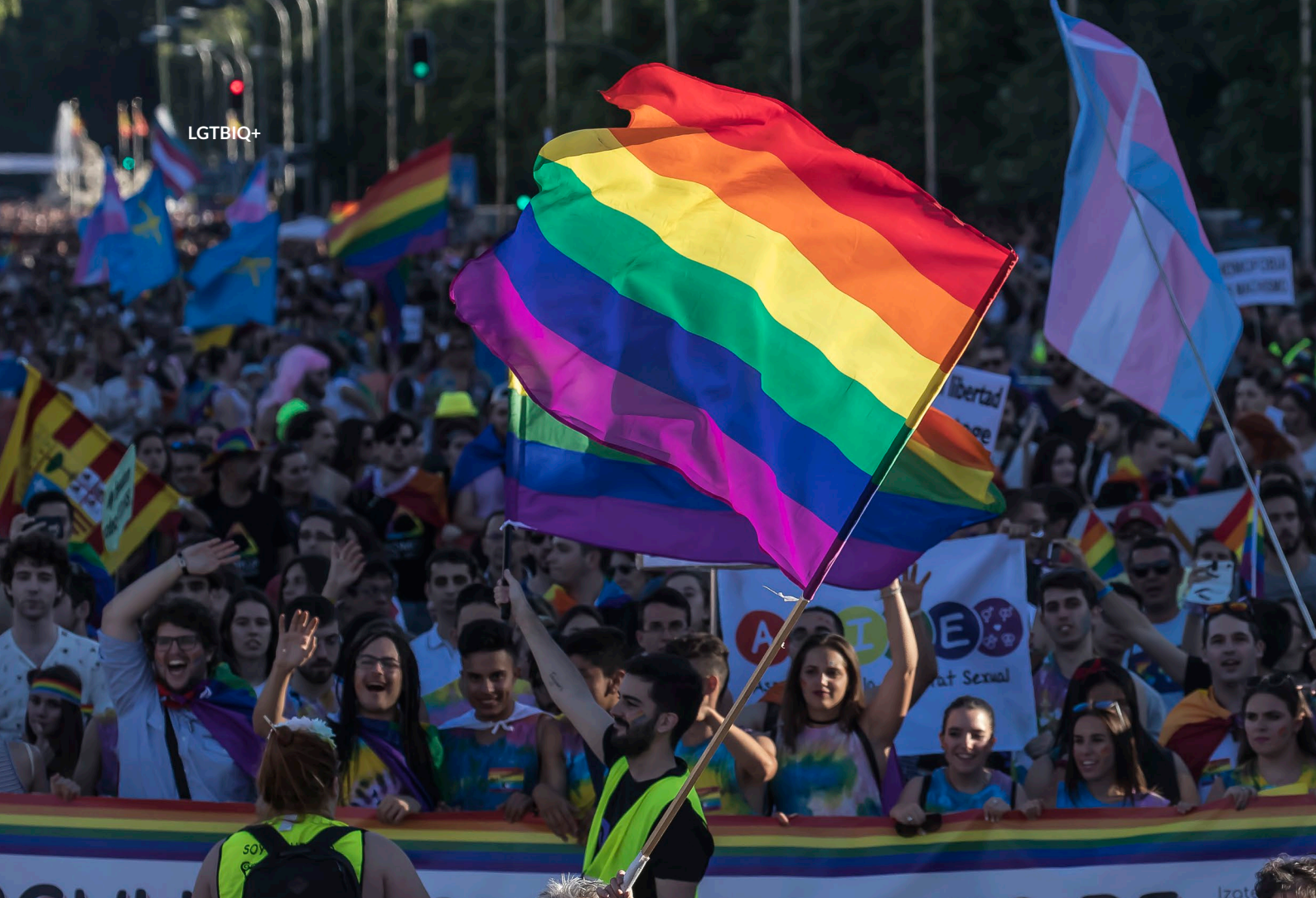
▲ GAY-PRIDE-UMZUG AN DER PUERTA DE ALCALÁ MADRID