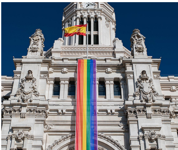
▲ RATHAUS VON MADRID

Lernen Sie die Hauptstadt Spaniens kennen und stellen Sie fest, dass die Vielfalt in der ganzen Stadt spürbar ist. Möchten Sie in einem speziell für Sie entworfenen Viertel bummeln? Kommen Sie nach Chueca und erleben Sie es!