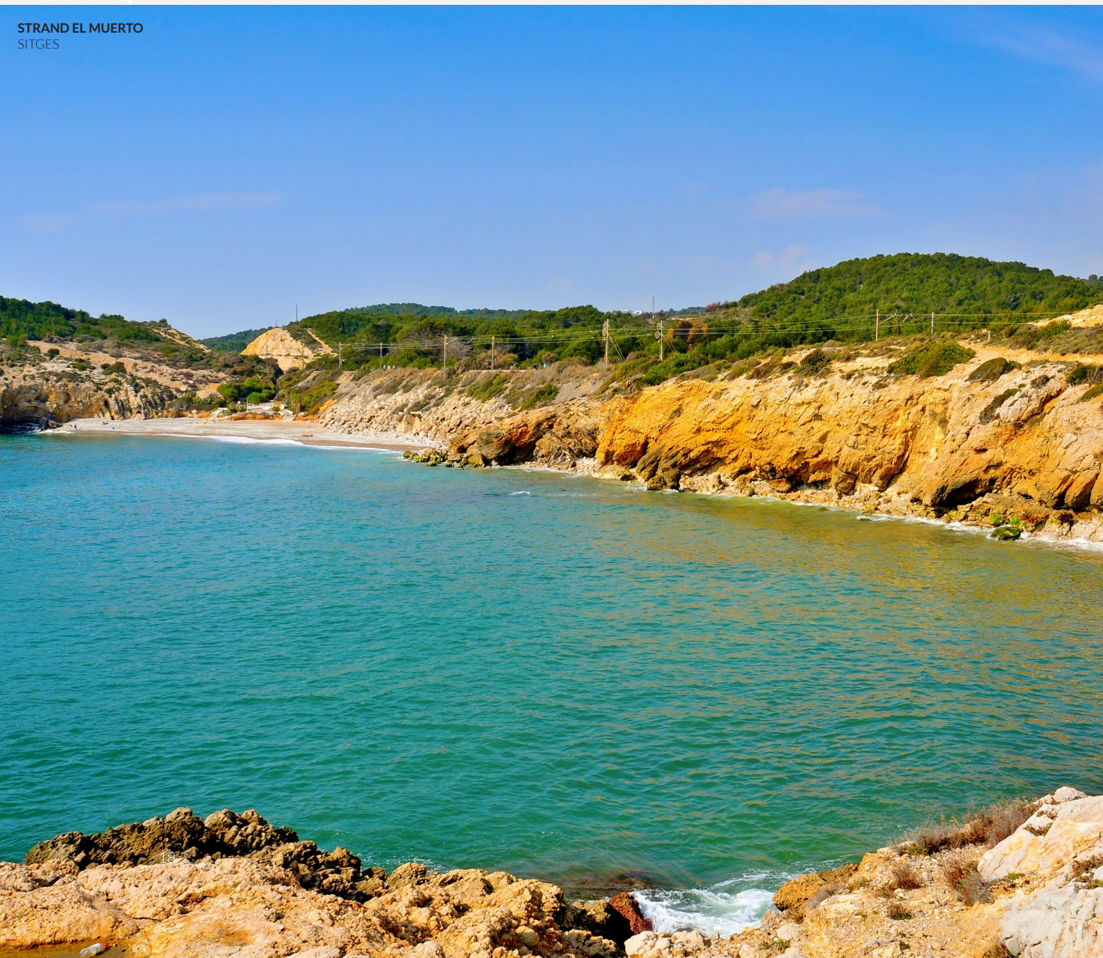
STRAND EL MUERTO SITGES

Wenn Sie nach Barcelona reisen, sollten Sie ein paar Tage für Sitges reservieren. Seine malerischen Straßen und Strände sowie ein breites Angebot für die LGT-BIQ+- Community machen es zu einem idealen Abstecher für Besucher der katalanischen Hauptstadt. In diesem kleinen Küstenstädtchen finden Sie Museen, Restaurants, Diskotheken, Geschäfte und lange Spazierwege. Entdecken Sie es!