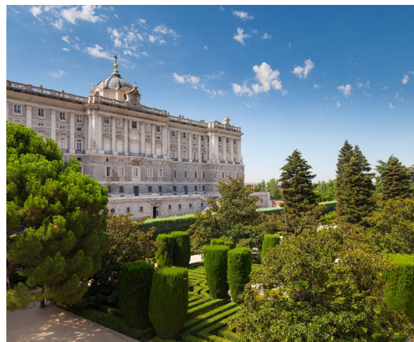
▲ KÖNIGSPALAST MADRID