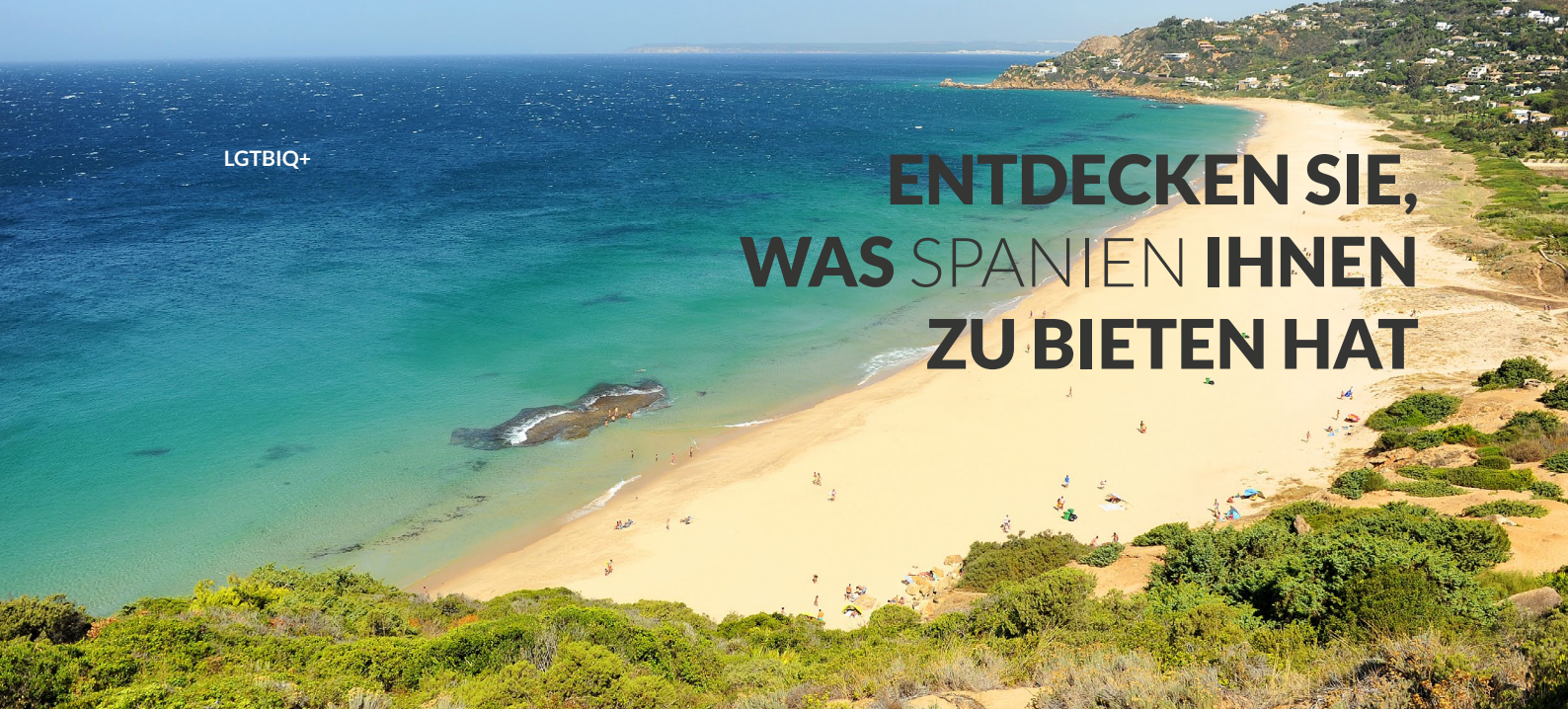
▲ STRAND PLAYA DE LOS ALEMANES ZAHARA DE LOS ATUNES, CÁDIZ

Genießen Sie das Meer, den Sand und die Sonne. Probieren Sie die Spezialitäten unserer köstlichen Gastronomie und besichtigen Sie unser kunsthistorisches Erbe. Entspannen Sie sich in den unterschiedlichsten Naturräumen und genießen Sie ein ausgezeichnetes Klima. All das und noch viel mehr ist möglich in Spanien.