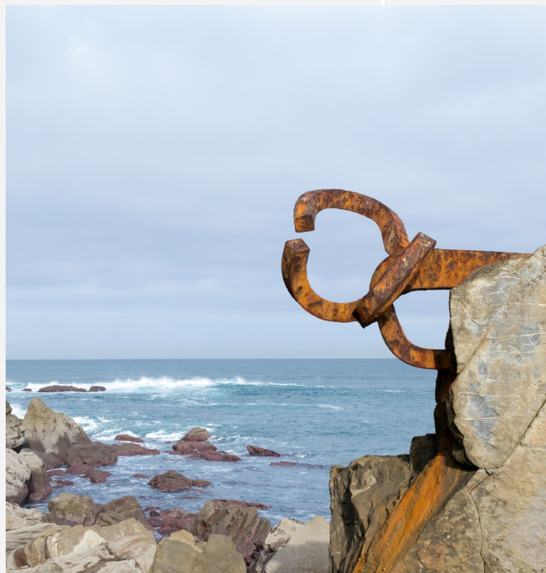
▲ DER WINDKAMM SAN SEBASTIÁN, GUIPÚZCOA