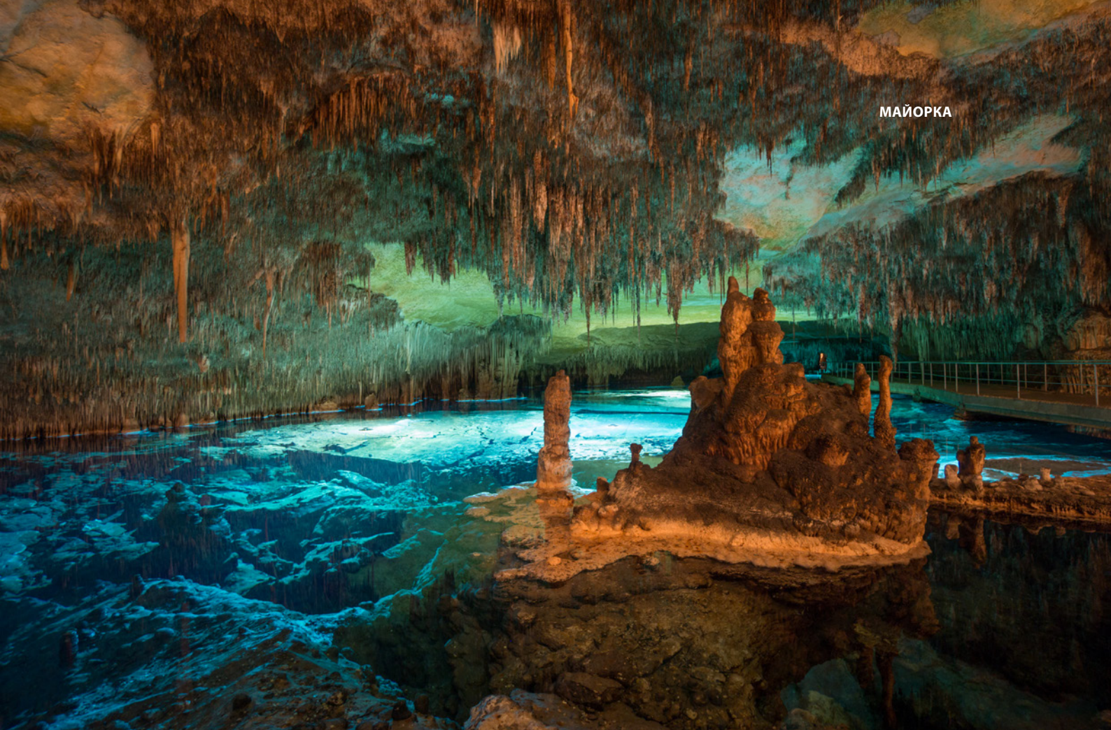
▲ ПЕЩЕРЫ ДРАК, ПОРТО-КРИСТО МАЙОРКА