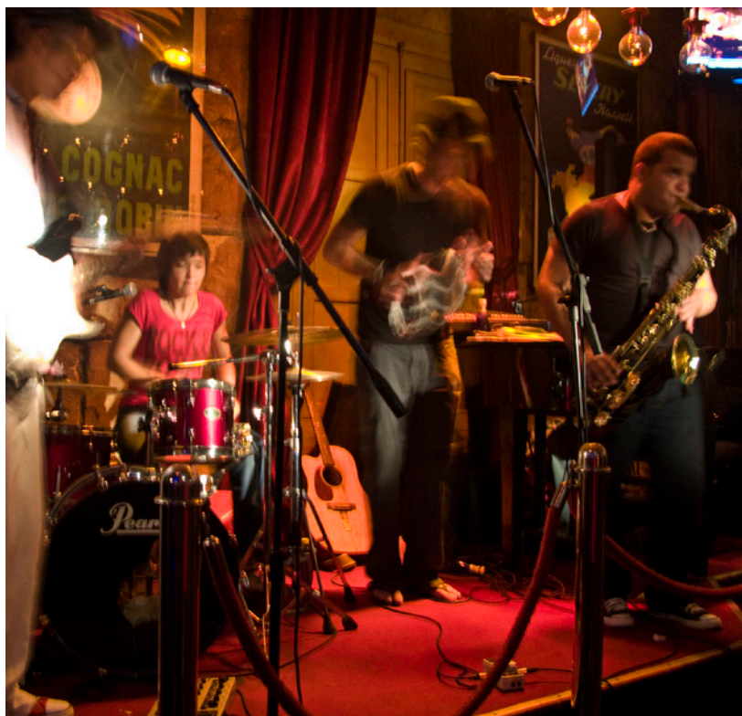
▲ ФЕСТИВАЛЬ JAZZ OBERT МЕНОРКА

Привлекательна и спортивная программа этих месяцев, включающая такие мероприятия, как 70-километровый забег Formentera to run по самым красивым уголкам острова (в конце мая — начале июля). Также вы можете принять участие в соревновании по плаванию Formentera-Ibiza Ultraswim — это заплыв на 30 км между двумя островами в сочетании с заплывами на 5 километров и 750 метров. Это мероприятие проходит в мае.