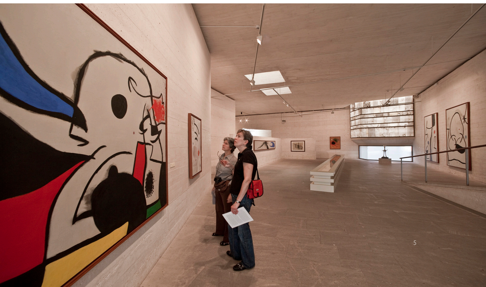
▼ ФОНД ПИЛАР И ЖОАНА МИРО МАЙОРКА

Наконец, отправьтесь в доисторические времена, посетив один из комплексов талайотов , являвшихся жилищем первых обитателей архипелага. В местечке Арта находится одно из самых больших и лучше всего сохранившихся поселений — Сес-Паиссес . Оно расположено в прекрасном дубовом лесу.