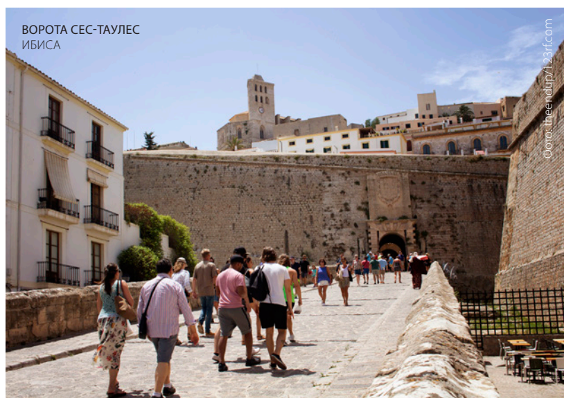
ВОРОТА СЕС-ТАУЛЕС ИБИСА

Присоединяйтесь к движению «творческого туризма» — новой тенденции, распространившейся по различным городам мира, — примите участие в интересных мероприятиях, таких как мастер-классы по музыке, танцу, фотографии, иностранным языкам и гастрономии.