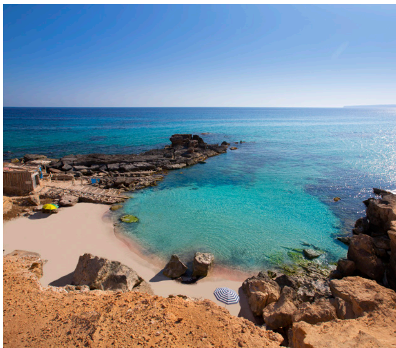
▲ КАЛО-Д'ЭС-МОРТ ФОРМЕНТЕРА

Это идеальный вариант для тех, кто предпочитает нудистские пляжи. Он имеет протяженность в 300 метров и расположен у подножия скалы. Здесь можно принять грязевые ванны и почувствовать себя в спа-салоне.