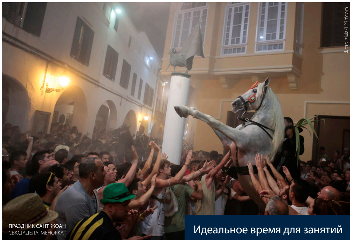
ПРАЗДНИК САНТ-ЖОАН СЬЮДАДЕЛА, МЕНОРКА