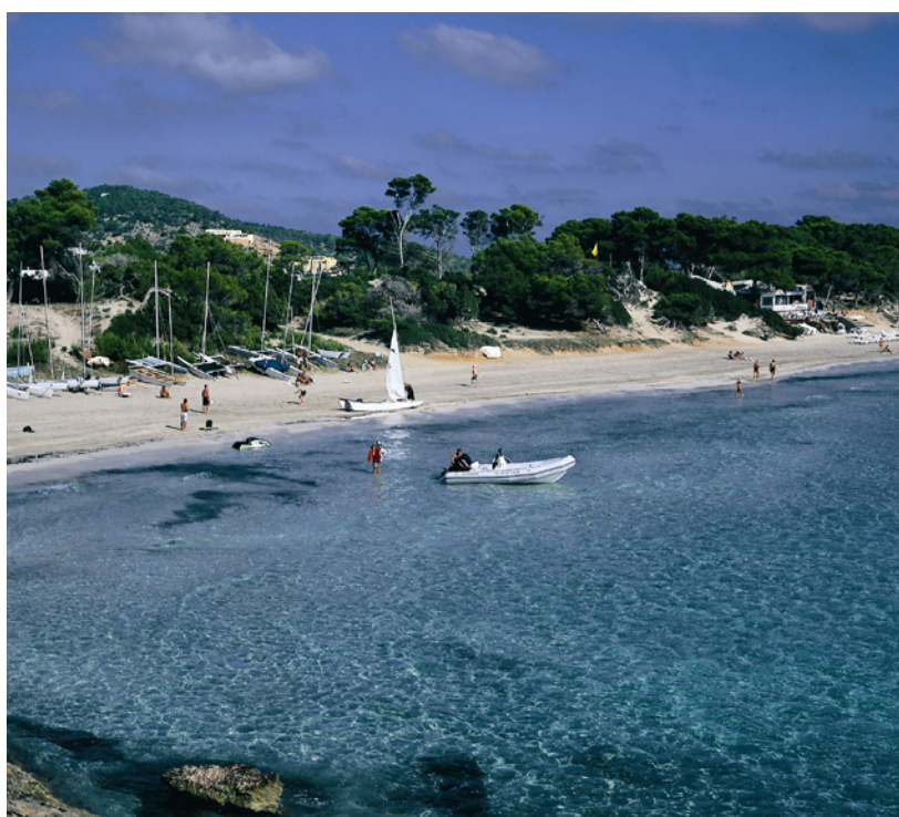
▲ ПРИРОДНЫЙ ПАРК СЕС-САЛИНЕС ИБИСА

Полюбуйтесь с пляжа очертаниями островов Эс-Ведра и Эс-Ведранель в природном парке Кала Д'Хорт, Кап-Льентриска и Са-Талайя. Это идеальное место для дайвинга и прогулок по тропинкам пешком или на велосипеде.