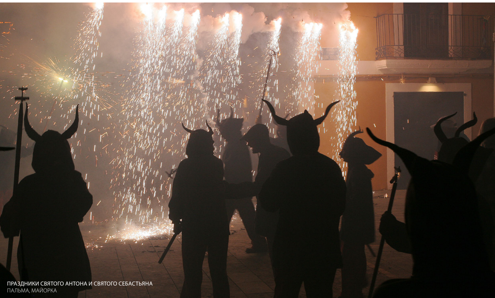
ПРАЗДНИКИ СВЯТОГО АНТОНА И СВЯТОГО СЕБАСТЬЯНА ПАЛЬМА, МАЙОРКА