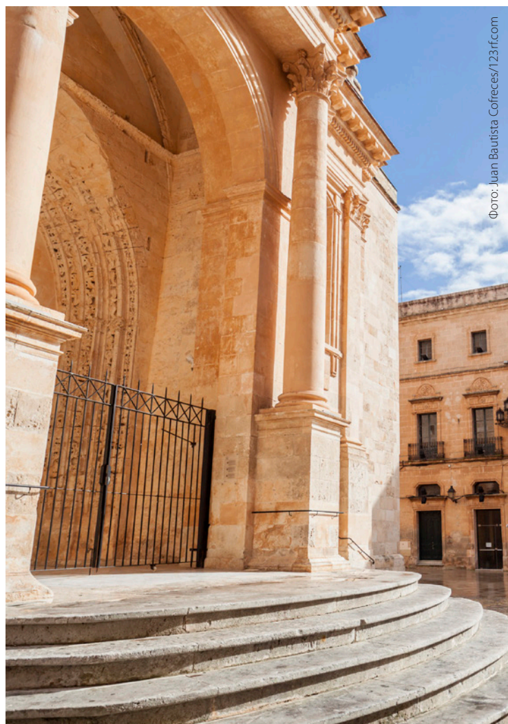
▲ КАФЕДРАЛЬНЫЙ СОБОР СВ. МАРИИ СЬЮАДЕЛА, МЕНОРКА

Неподалеку отсюда вы обнаружите сооружения эпохи мегалита, свидетельствующие о доисторическом прошлом острова. Посетите коллективную гробницу бронзового века Навета-дес-Тудонс , одну из самых старых построек в Европе.