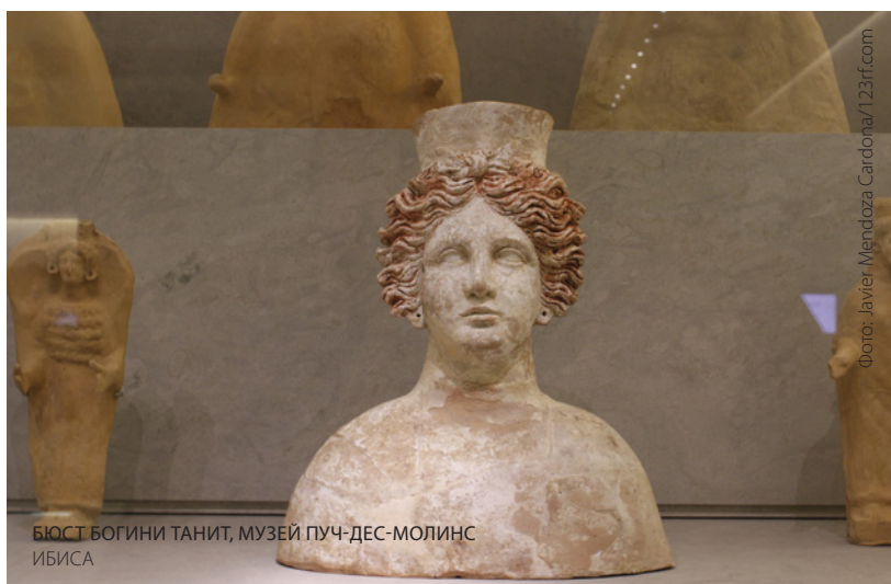
БЮСТ БОГИНИ ТАНИТ, МУЗЕЙ ПУЧ-ДЕС-МОЛИНС ИБИСА