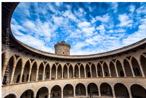
▲ ЗАМОК БЕЛЬВЕР, ПАЛЬМА МАЙОРКА

А если вы хотите посмотреть на остров с интересной точки, в трех километрах от исторического центра можно посетить замок Бельвер в готическом стиле, один из немногих замков Европы круглой формы.