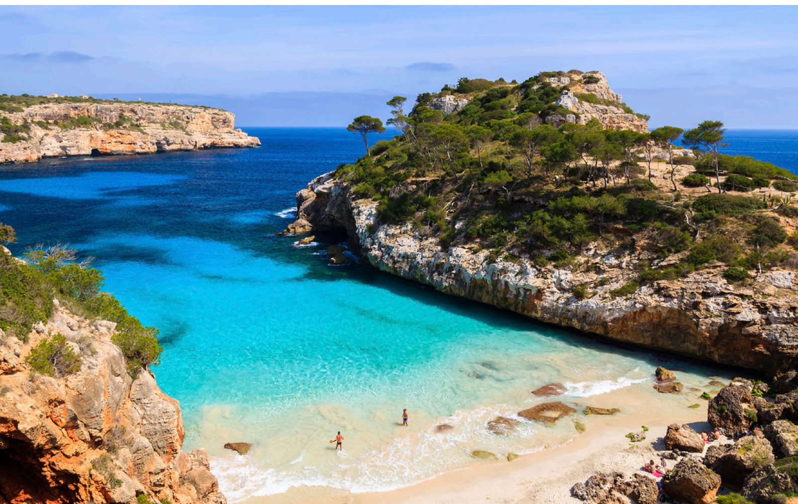
▲ КАЛО-ДЕС-МОРО МАЙОРКА

Впечатляющие скалы, огромные девственные пляжи, очаровательные бухты... Найдите пляж себе по душе на Балеарских островах и насладитесь сказочным отдыхом у кристально-чистого моря. Здесь есть небольшой выбор из 10 райских уголков.