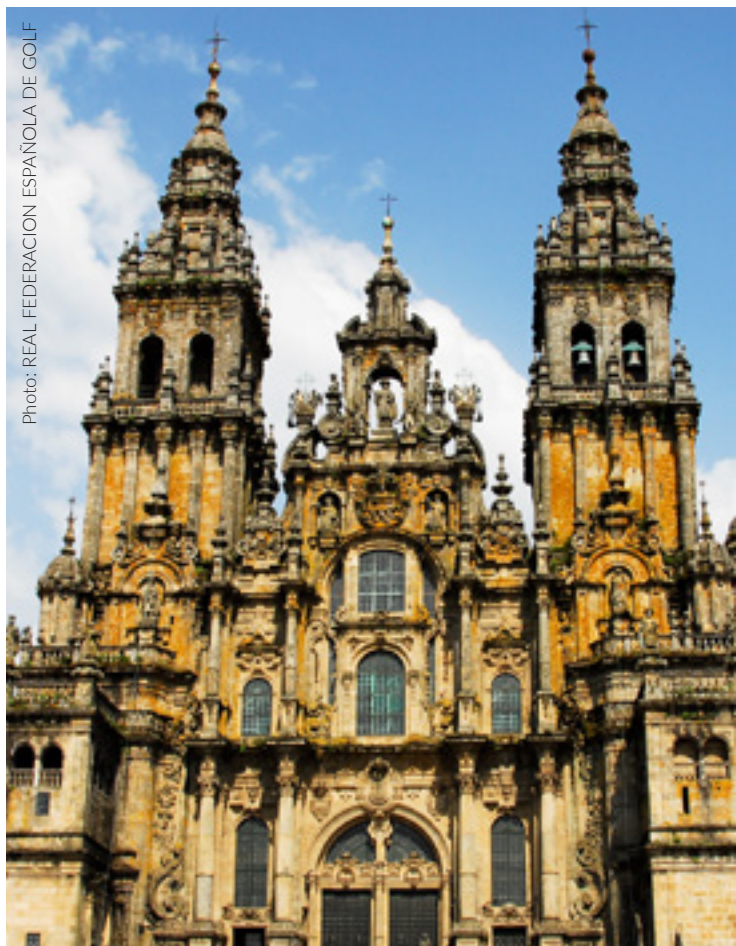
▲ DOMKYRKAN I SANTIAGO SANTIAGO DE COMPOSTELA