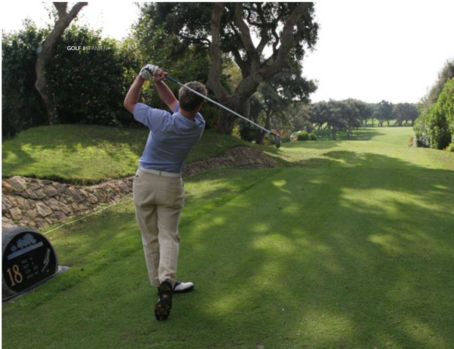
▲ REAL CLUB DE VALDERRAMA CÁDIZ