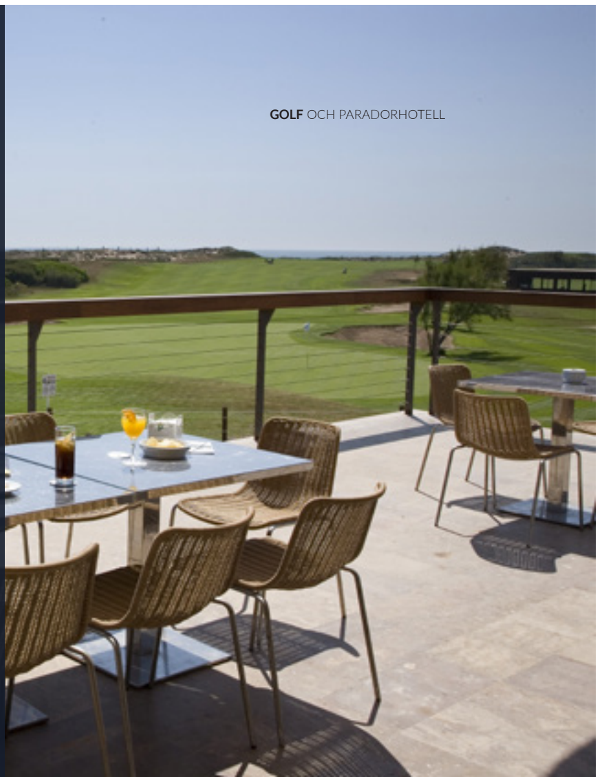
▲ EL SALER PARADOR HOTELL VALENCIA

Spanien har ett stort nätverk av paradorhotell som ger dig vila och nya upplevelser. Hotellen är inhysta i historiska byggnader som smälter in i en vacker omgivning. Den utmärkta gastronomi och serviceutbudet garanterar att du får en skön och förstklassig vistelse.