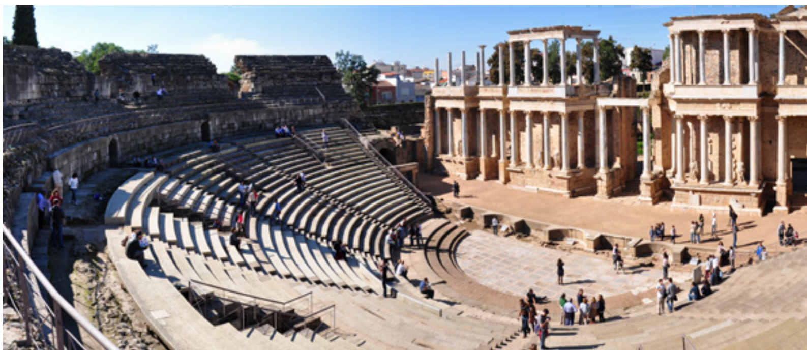
▲ ROMERSKA TEATERN I MÉRIDA