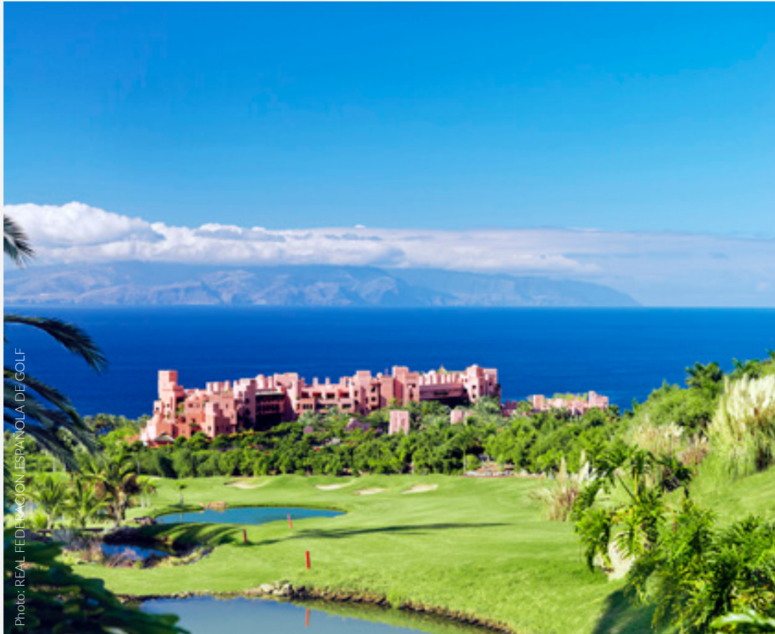
▲ ABAMA GOLF, GUÍA DE ISORA TENERIFFA

Förening två passioner, golf och god mat. Det är ett roligt och smakrikt sätt att bekanta dig med den spanska gastronomi och upptäcka nya platser där du kan förbättra ditt handicap.