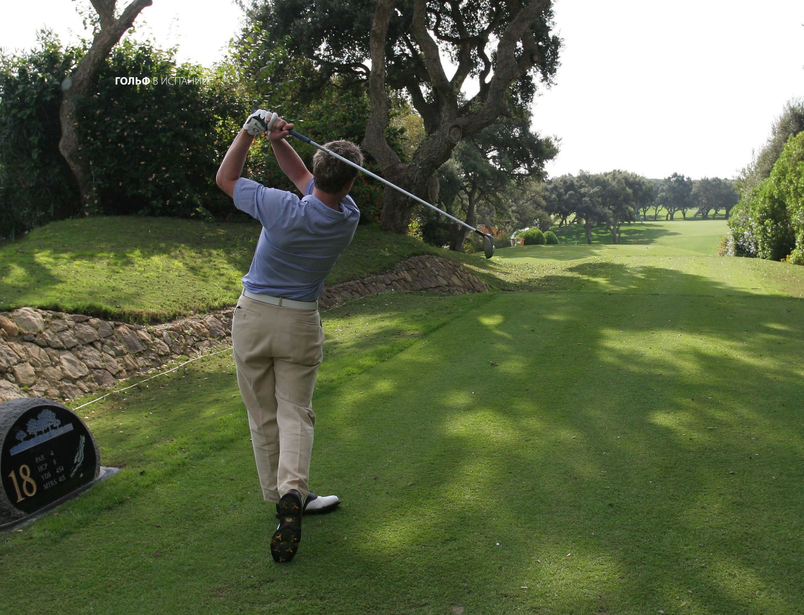
▲ ГОЛЬФ-КЛУБ REAL CLUB DE VALDERRAMA КАДИС