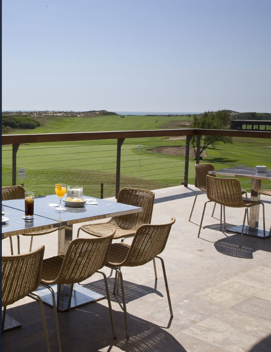
▲ ПАРАДОР ЭЛЬ-САЛЕРА ВАЛЕНСИЯ

В Испании имеется обширная сеть отелей-парадоров, где отдых восстановит ваши силы, а пребывание станет незабываемым. К особому очарованию исторических строений, в которых они размещаются, обычно добавляется живописность окружающей местности. Превосходное гастрономическое предложение и разнообразие услуг являются залогом качества и комфорта для путешественника.