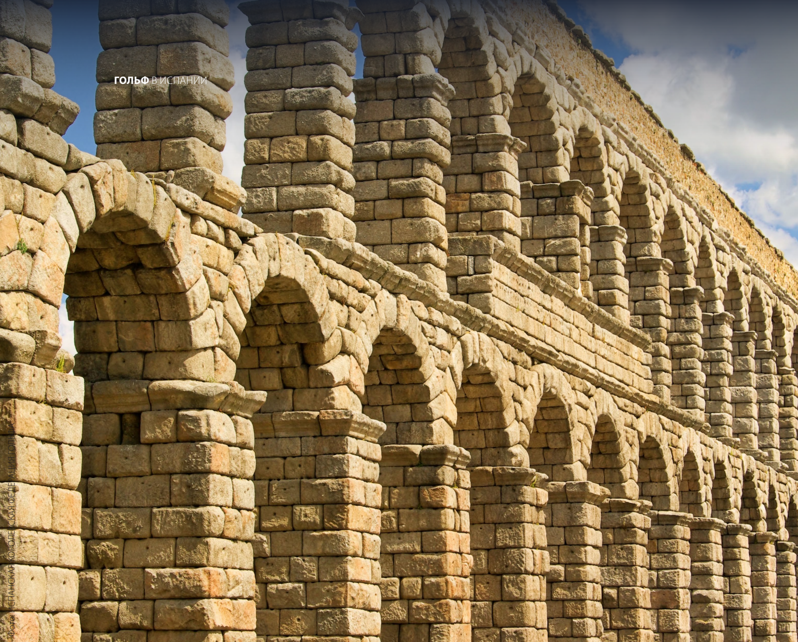
▲ АКВЕДУК В СЕГОВИИ