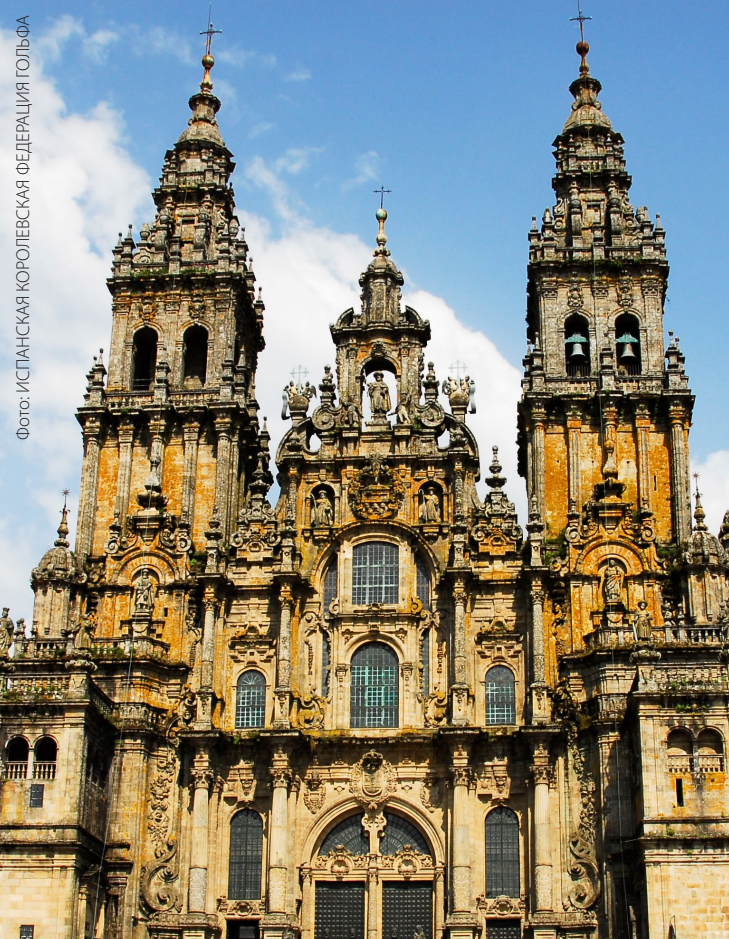
▲ КАФЕДРАЛЬНЫЙ СОБОР СВЯТОГО ИАКОВА САНТЬЯГО-ДЕ-КОМПОСТЕЛА