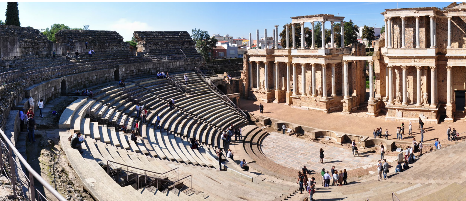
▲ ДРЕВНЕРИМСКИЙ ТЕАТР, МЕРИДА