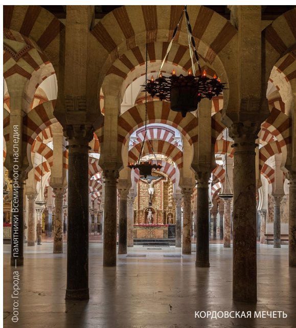
Фото: Города — памятники Всемирного наследия

Поиграйте в гольф в окружении природы в загородном клубе , в самом сердце горного хребта Сьерра-де-Кордова. Здесь на фоне средиземноморского леса вас ждет 18-луночное поле, расположившееся среди деревьев, ручьев и гор. Вы окажетесь в непосредственном окружении природы, где кролики и куропатки часто пересекают замысловатую площадку. Если вы будете здесь в начале осени, то вполне вероятно, что вам доведется услышать рев благородного оленя, так как в это время начинается брачный период.