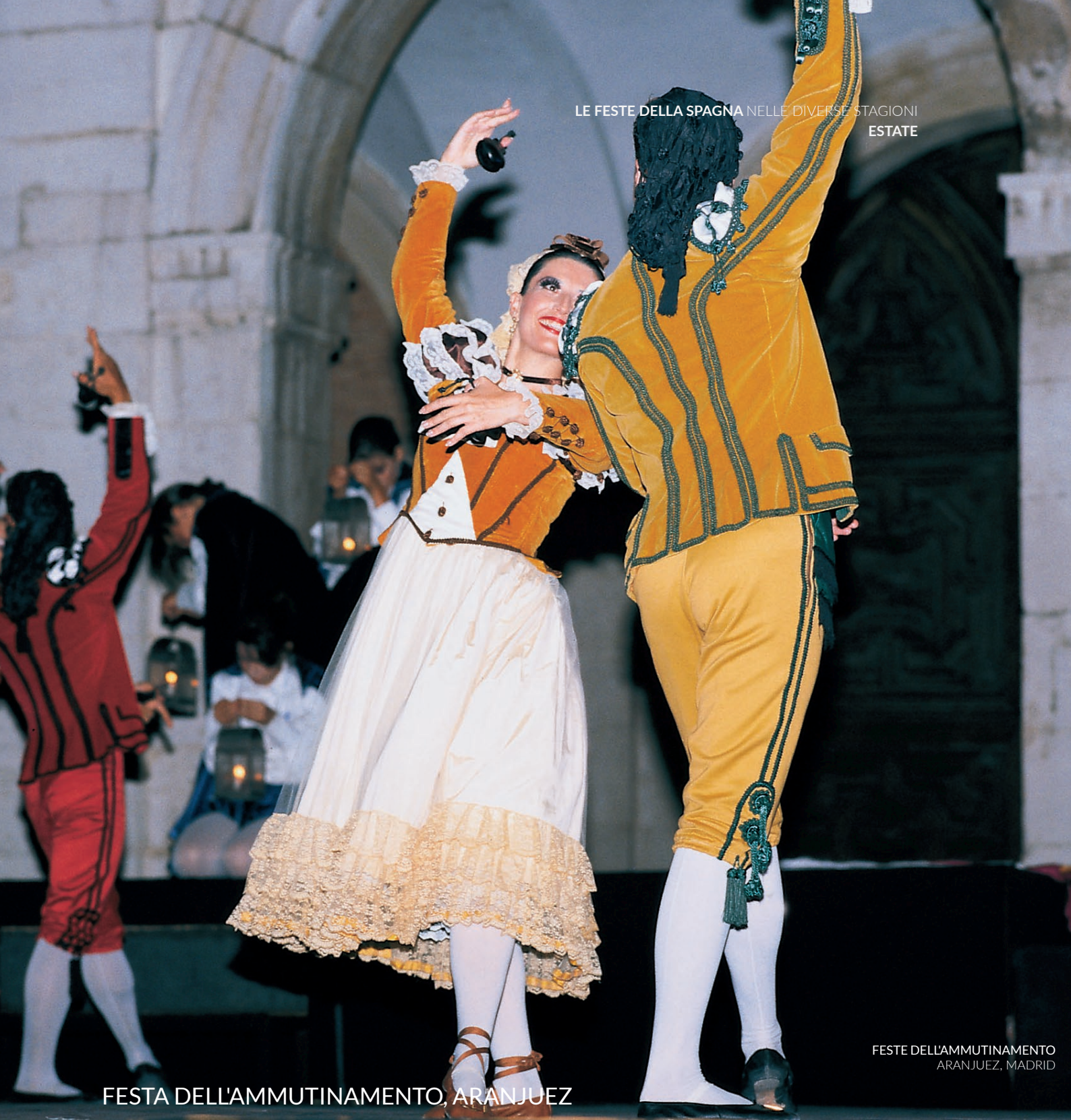
FESTE DELL'AMMUTINAMENTO ARANJUEZ, MADRID