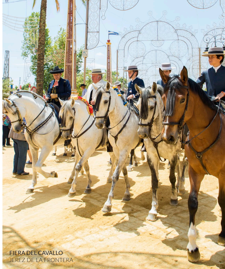
FIERA DEL CAVALLO JEREZ DE LA FRONTERA