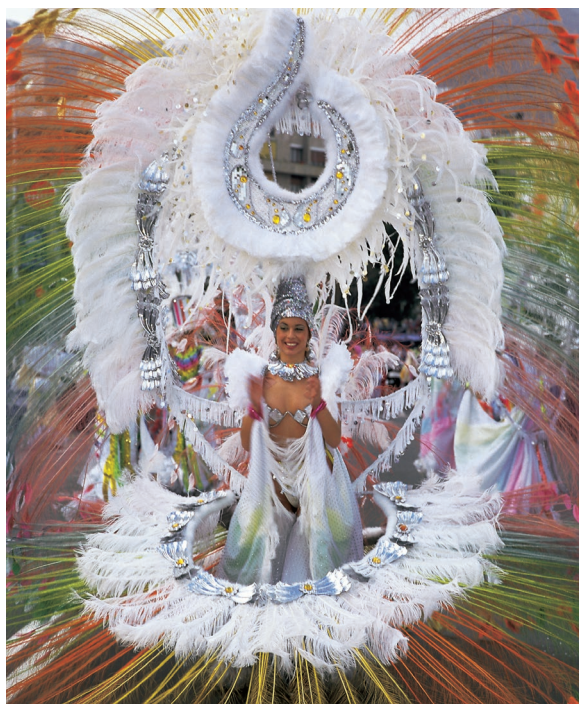
▲ CARNEVALE SANTA CRUZ DE TENERIFE

Se c'è una cosa che caratterizza il Carnevale di Santa Cruz de Tenerife è la sua spettacolarità. Gli abitanti si preparano alla festa grande dell'isola durante tutto l'anno, progettando carri e creando costumi. L'elezione della Regina di ogni edizione è un evento di interesse internazionale. Le candidate sfilano con costumi spettacolari che possono arrivare a pesare fino a 200 chili.