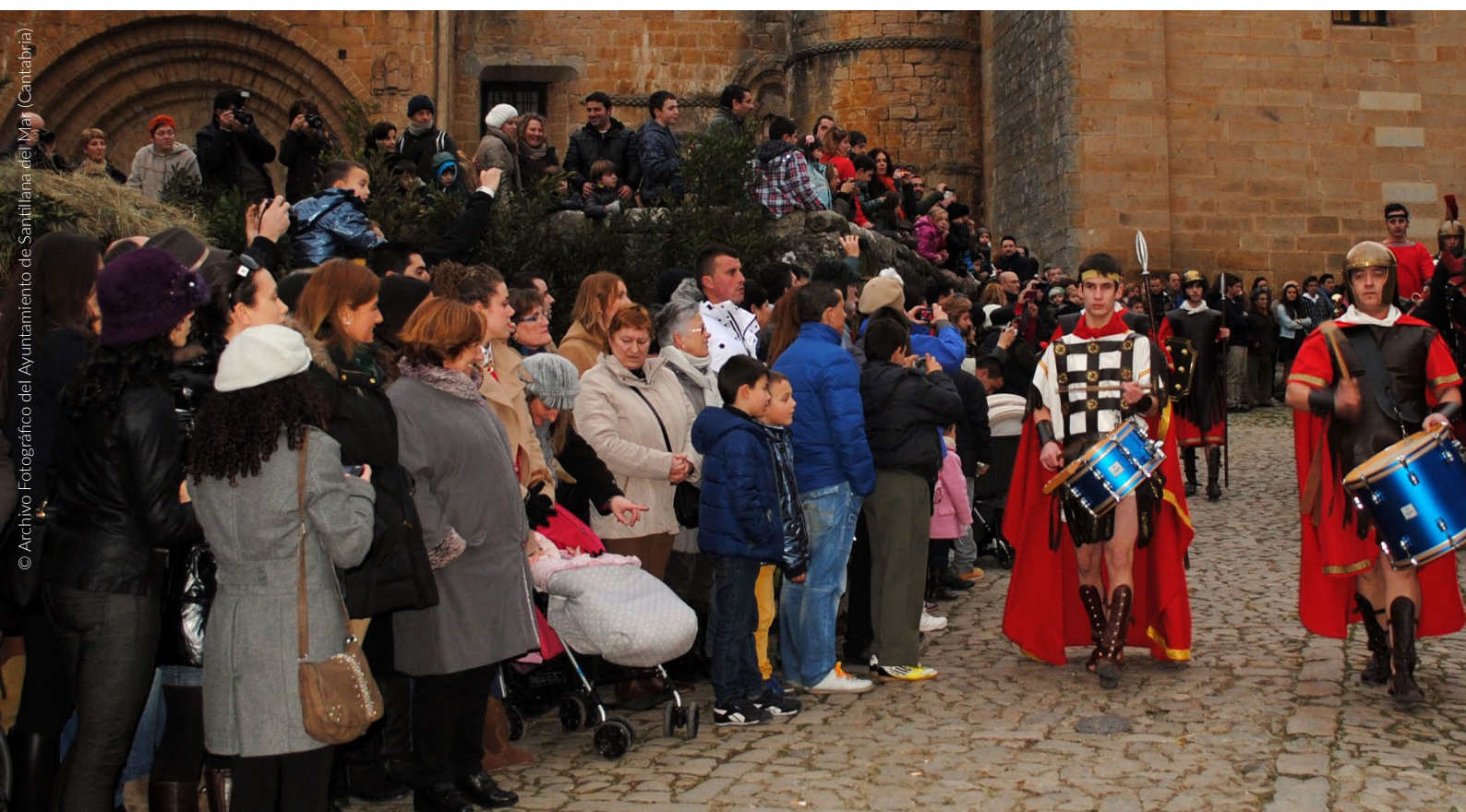
▲ RAPPRESENTAZIONE SACRA E SFILATA DEI RE MAGI SANTILLANA DEL MAR