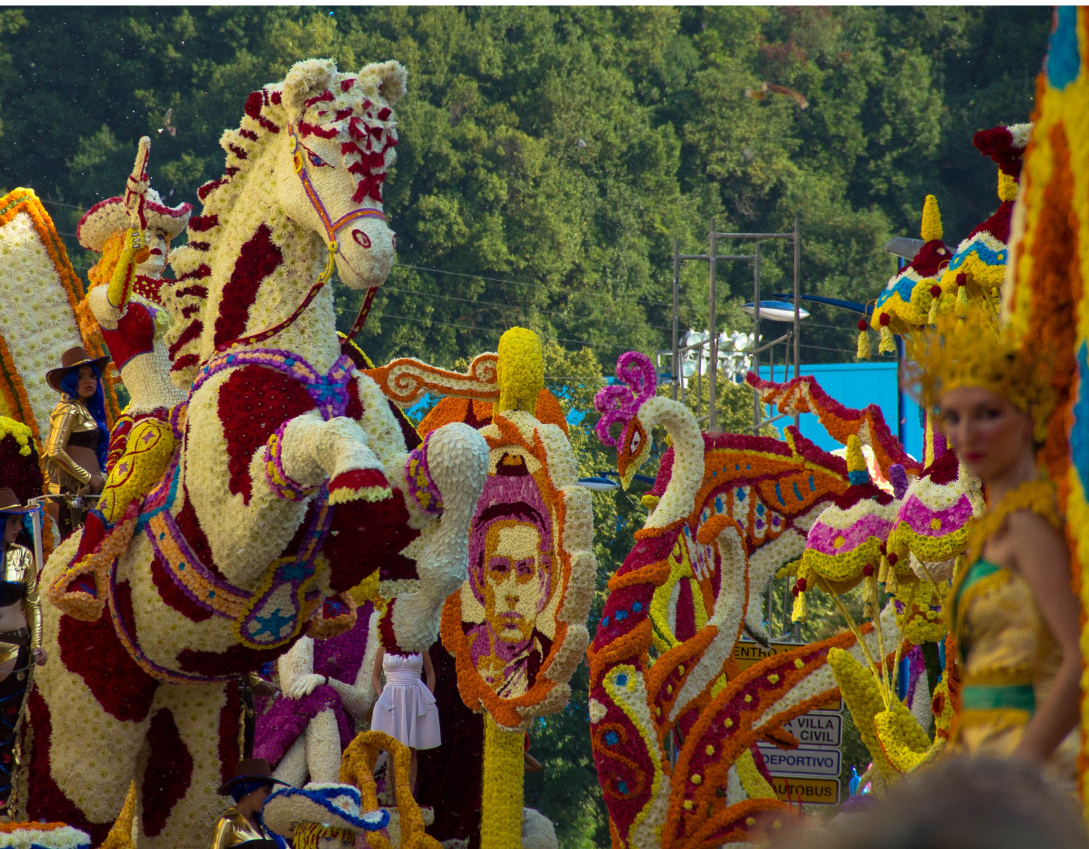
▲ BATTAGLIA DEI FIORI LAREDO