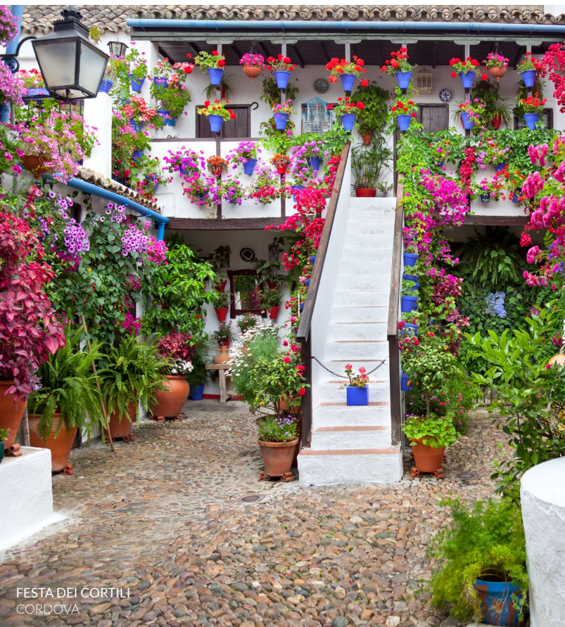
FESTA DEI CORTILI CORDOVA