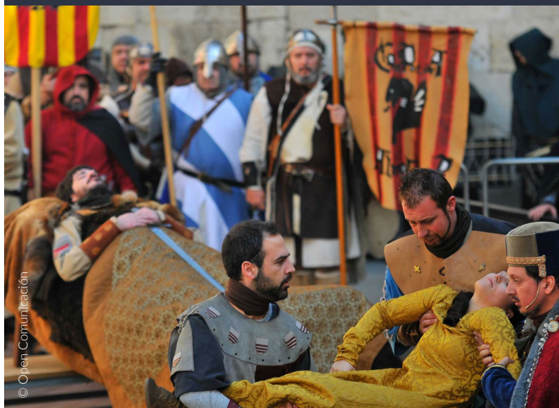
▲ FESTA DELLE NOZZE DI ISABEL DE SEGURA TERUEL

📍 Dove: Alcoy (Alicante, Comunità Valenciana) e Santillana del Mar (Cantabria) Quando: 5 gennaio www.alcoyturismo.com www.turismodecantabria.com