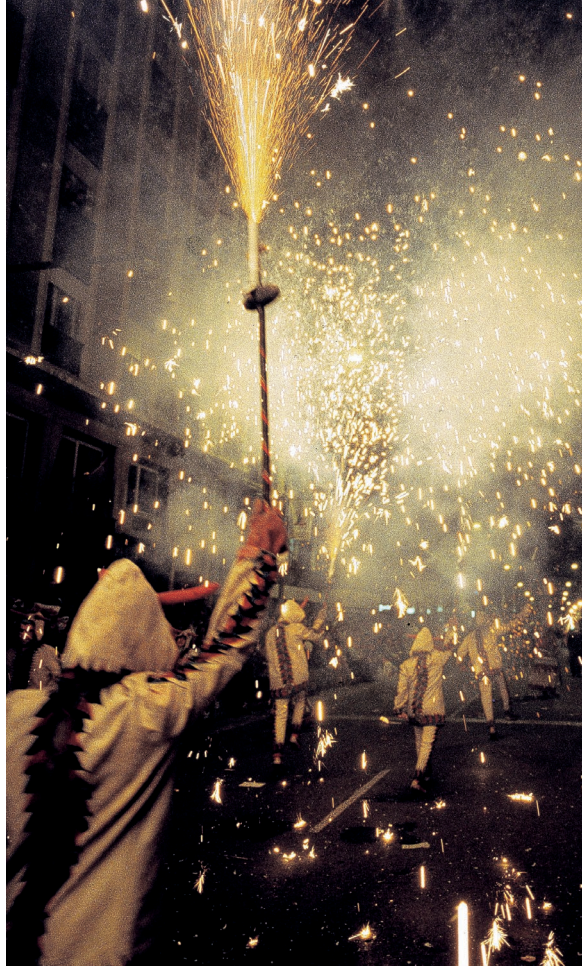
▲ FUNERALE DELLA SARDINA MURCIA