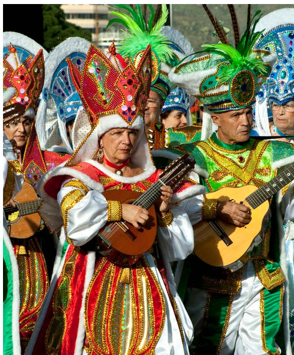
▲ CARNEVALE SANTA CRUZ DE TENERIFE