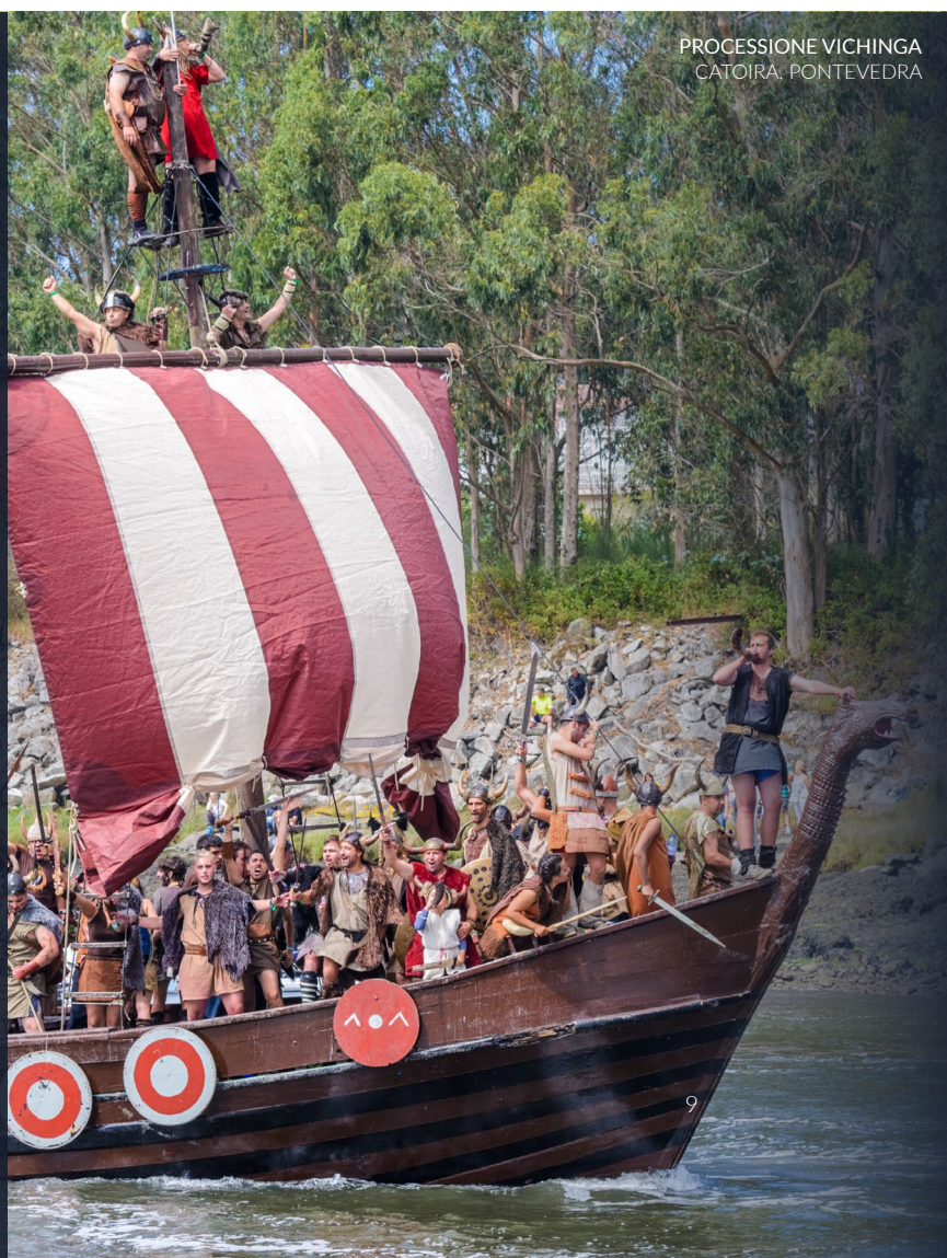
PROCESSIONE VICHINGA CATOIRA, PONTEVEDRA

📍 Dove: Catoira (Pontevedra, Galizia) Quando: prima domenica di agosto www.catoira.gal/es/turismo/romaria-vikinga/