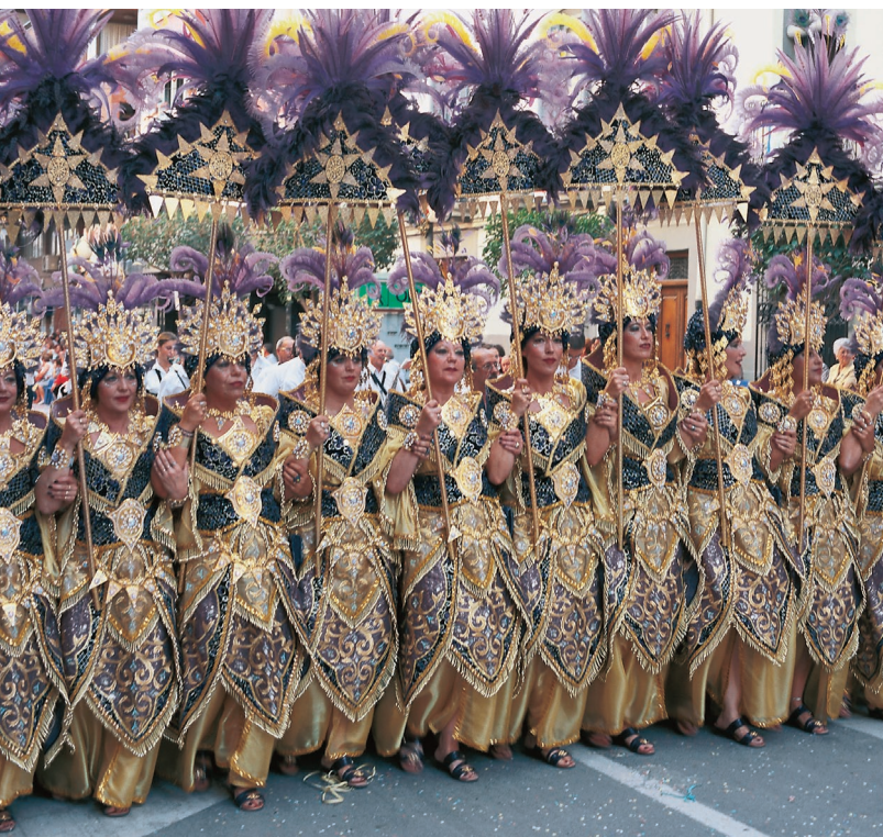
▲ MORI E CRISTIANI VILLENNA, ALICANTE