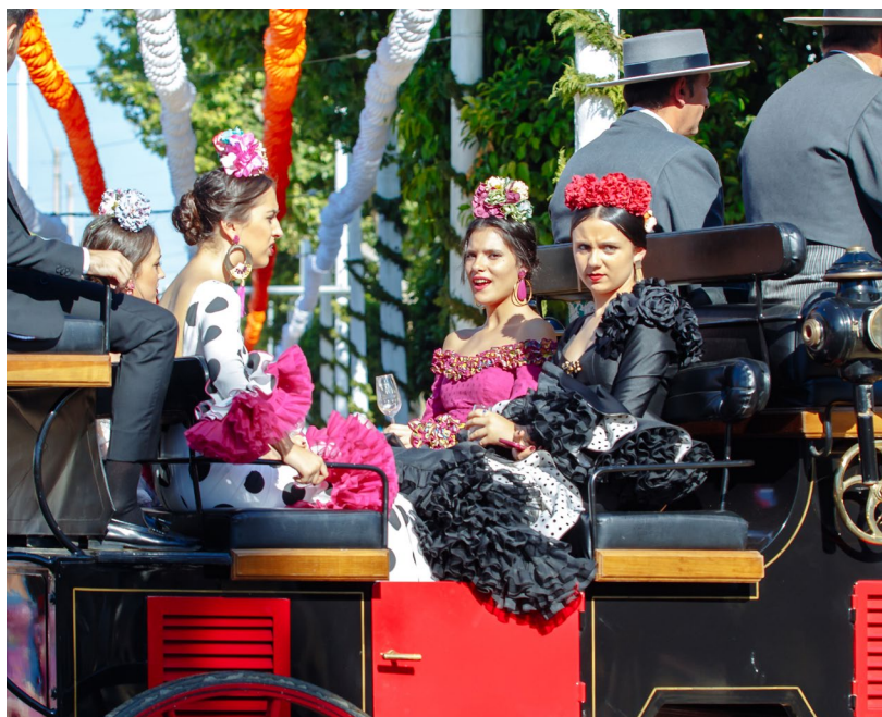
▲ FERIA DE ABRIL SIVIGLIA

📍 Dove: Siviglia (Andalusia) Quando: aprile www.visitasevilla.es