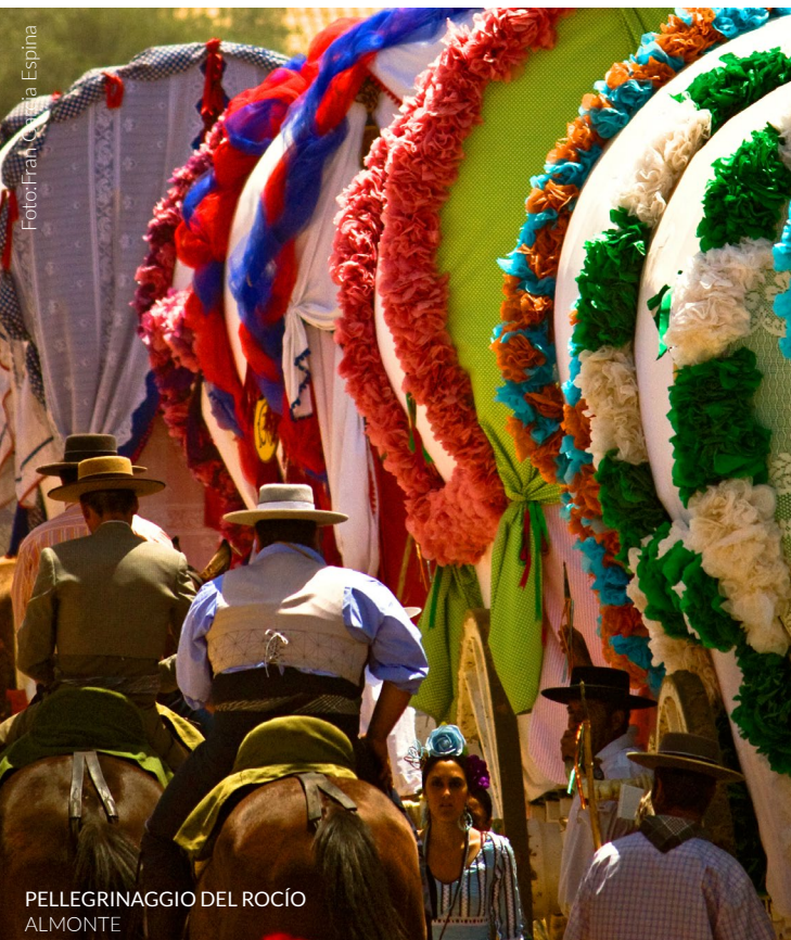
PELLEGRINAGGIO DEL ROCÍO ALMONTE

📍 Dove: Almonte (Huelva, Andalusia) Quando: maggio www.andalucia.org