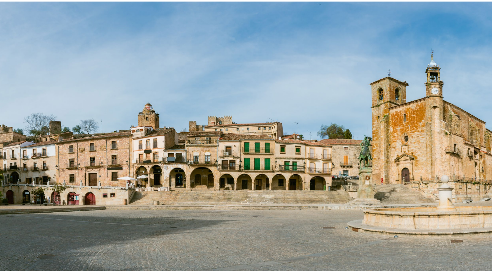
▼ 特鲁希略的马约尔广场 卡塞雷斯

如果你在夏天去阿拉贡地区的韦斯卡，那么千万别错过两个美食节：7月份举行的格拉乌斯(Graus)腌肉肠日以及8月举办的塞尔莱尔(Cerler)羊肉节。