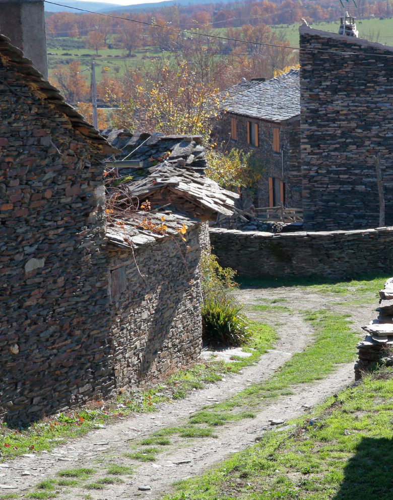
▲ 坎皮略德拉纳斯 瓜达拉哈拉

到瓜达拉哈拉，你可以探索周围的自然风光，也可以参观充斥着黑色建筑的著名村落，这里的建筑以黑板为最主要的建筑材料，以此得名。这座瓜达拉哈拉的城市保留着很有趣的民用建筑的典范，比如因凡达多 (Infantado) 宫殿；以及宗教建筑，比如巴洛克式的圣尼古拉斯埃尔雷阿尔 (San Nicolás el Real) 教堂。