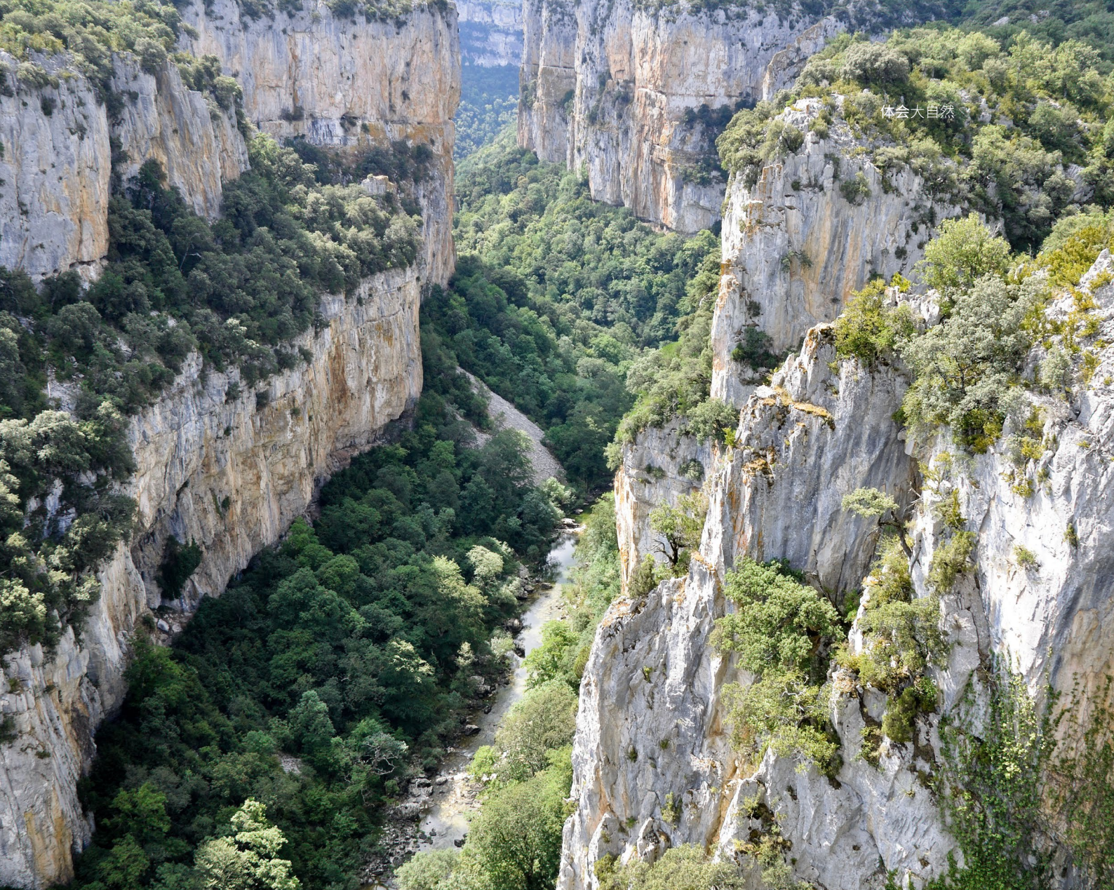
▲ 弗斯德隆比埃尔 纳瓦拉