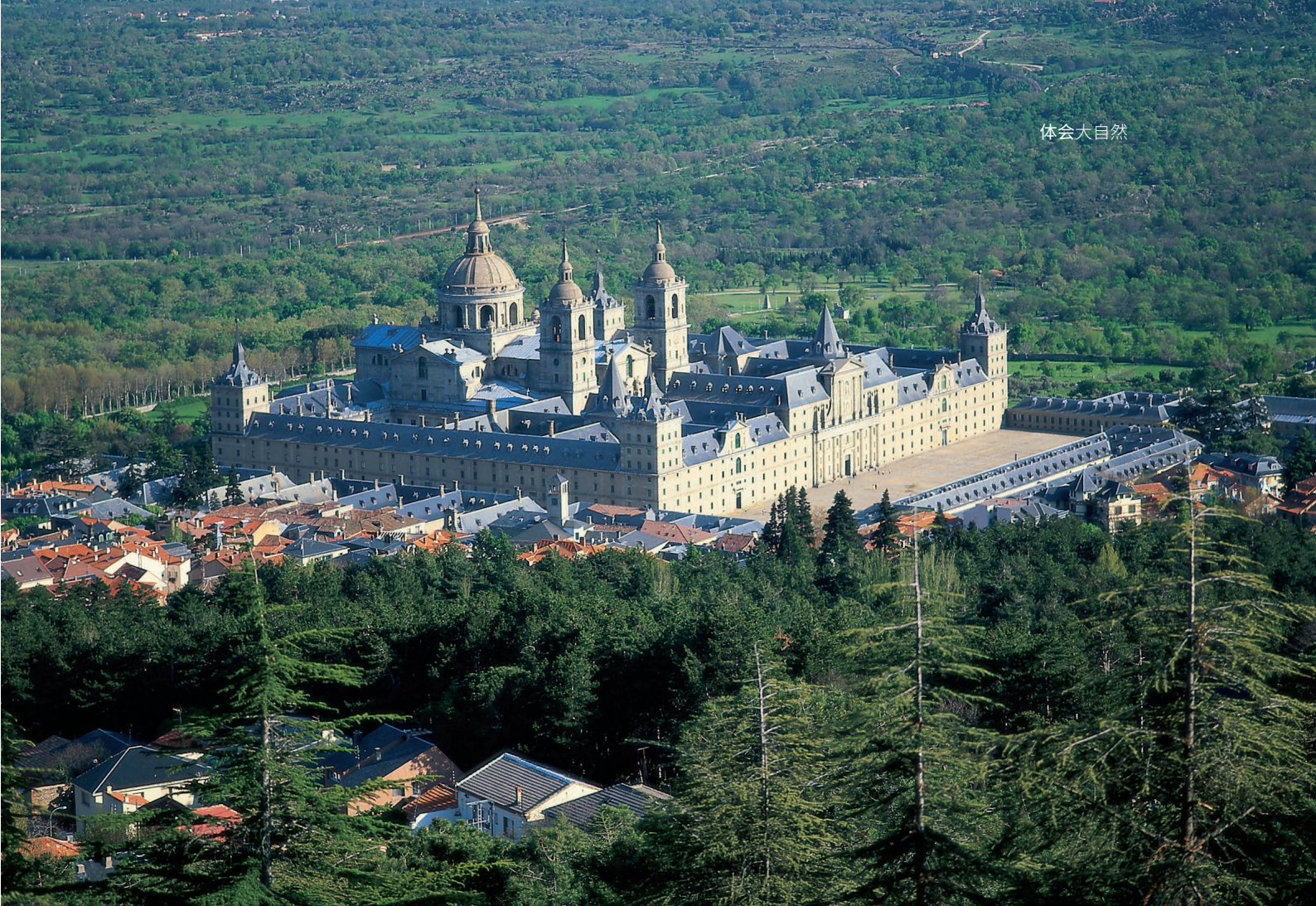
▲ 埃尔埃斯科里亚尔