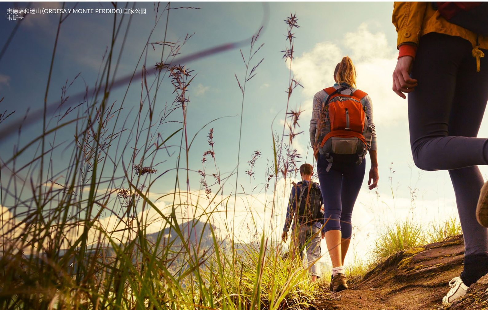
奥德萨和迷山 (ORDESA Y MONTE PERDIDO) 国家公园 韦斯卡

你也可以探访阿拉贡自治区的另一个城市特鲁埃尔，那里保存着一座重要的穆德哈尔建筑，已被联合国教科文组织列为世界遗产。品尝火腿，来一场味觉的盛宴。