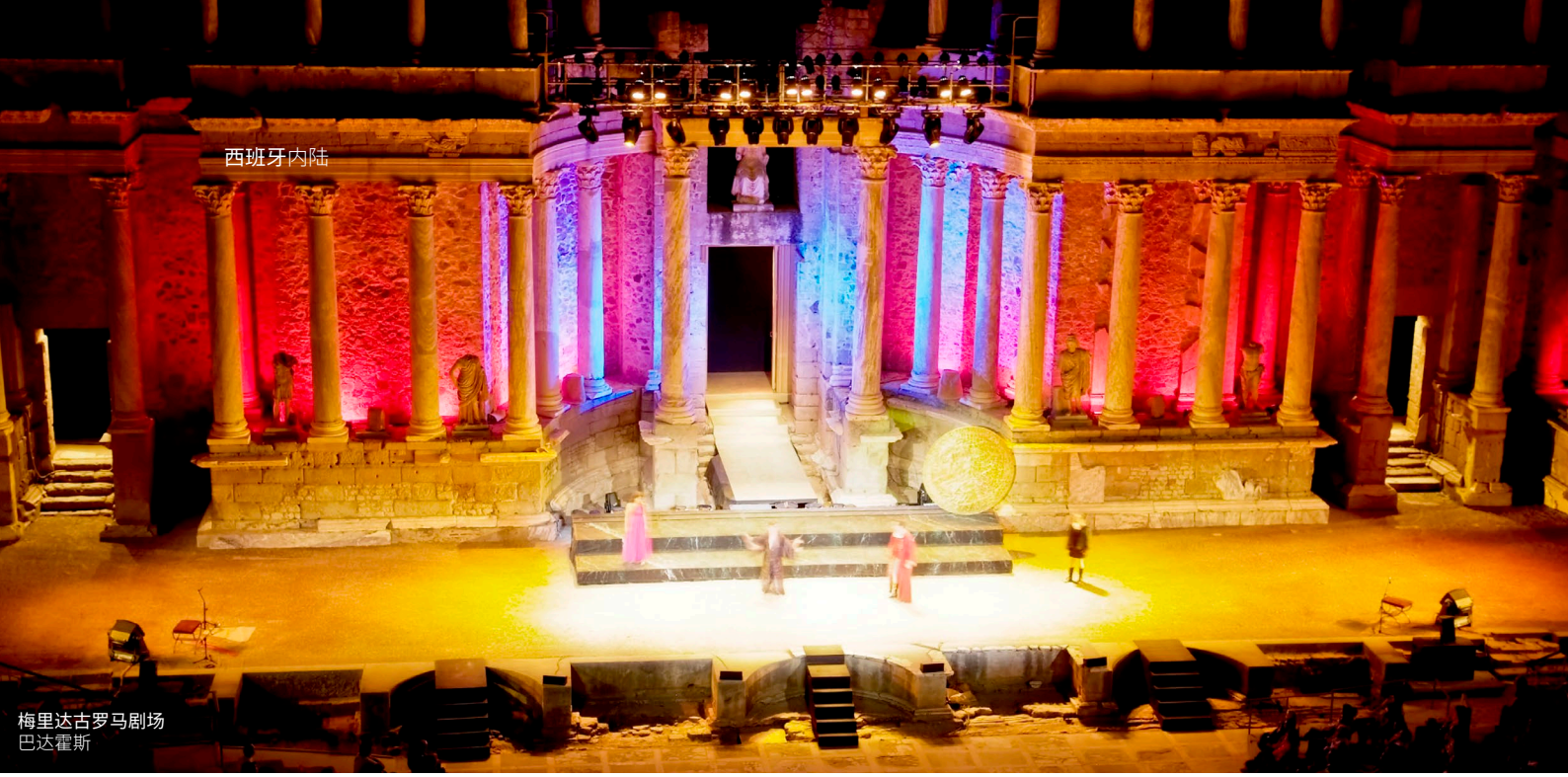
梅里达古罗马剧场 巴达霍斯

如果你喜欢独立音乐，那么就记得预订马德里托马维斯塔斯 (Tomavistas) 音乐节的入场券，该音乐节在5月举办。还是在马德里，千万不要错过狂酷 (Mad Cool) 音乐节，每年夏天都会有最受欢迎的国际乐队前来表演。无论你在何时前往马德里，都会爱上这里精彩的文化活动。选择范围非常广，你可以在大型剧院观赏最知名的音乐剧，或者到比如屠宰场 (Matadero) 这样的前卫艺术中心一探究竟。