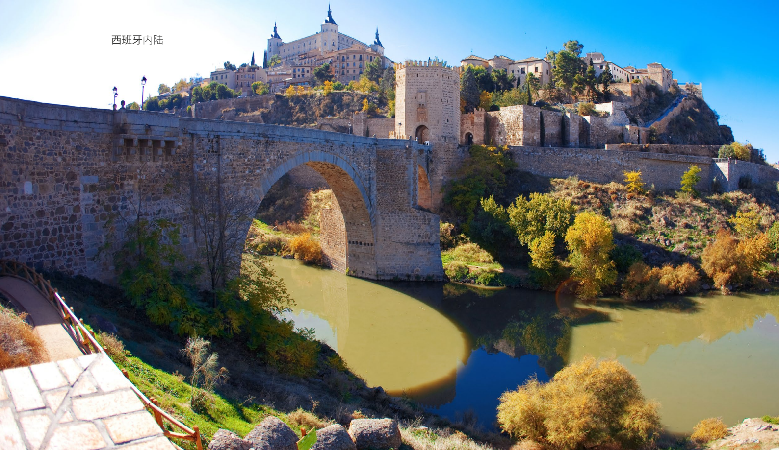
▲ 阿尔坎达拉桥 托莱多