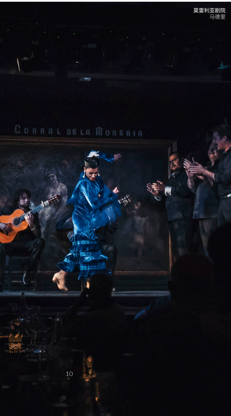
莫雷利亚剧院 马德里