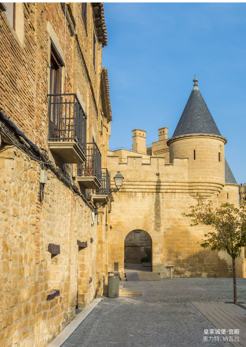
皇家城堡-宫殿 奥力特, 纳瓦拉