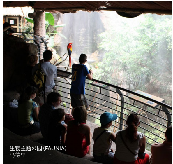
生物主题公园 (FAUNIA) 马德里

另一条激动人心的旅行线路是位于卡斯蒂亚和莱昂地区索里亚的动物化石残骸之路 (Ruta de las Icnitas)。在那里你们可以参观恐龙留下的遗迹，或者参观博物馆和古生物研究和科普中心。准备好了发掘你内心深藏的探险家了吗？在里奥哈的冒险主题公园迷失山谷 (El Barranco Perdido)，你们得上绳索、攀爬楼梯、尝试索道滑行并发掘化石。