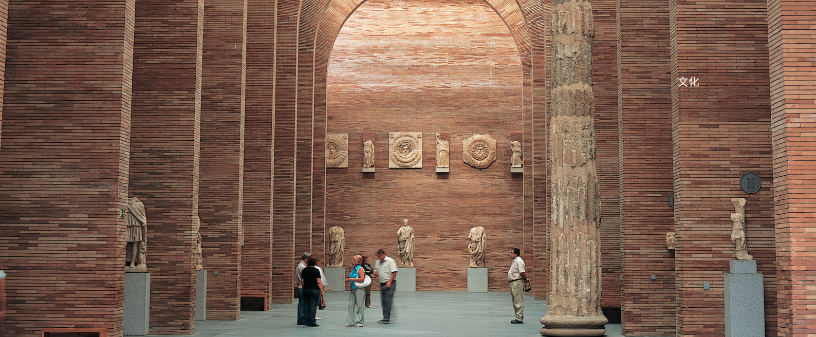
▲ 古罗马艺术国家博物馆 梅里达

在莱昂，你可以在卡斯蒂亚和莱昂当代艺术博物馆（MUSAC）享受与众不同的艺术体验，该博物馆的总部曾因其独具匠心的建筑风格而荣获国际大奖。不用离开卡斯蒂亚和莱昂大区，就可以参观布尔戈斯的人类进化博物馆，了解有关人类起源的方方面面。在这处宏伟而现代的科教中心，还展出阿塔普埃尔卡山（Atapuerca）遗迹中的考古发现。