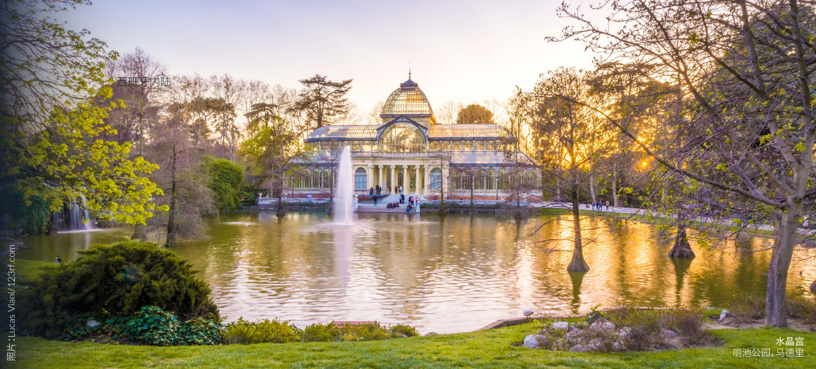
水晶宫 丽池公园, 马德里