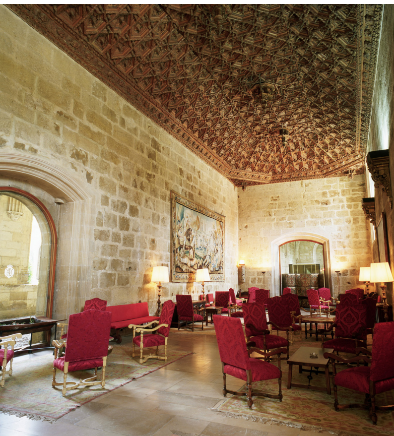
▲ PARADOR DE TURISMO LEÓN

Vous trouverez des hébergements pleins de charme dans toutes les régions d'Espagne. Quel que soit votre choix, vous ne le regretterez pas. Les plus luxueux proposent des services tels que des massages privés, des suites avec hammam ouverts sur la nature, des cuisiniers particuliers, un potager privé... Découvrez l'intense saveur espagnole des cortijos andalous, de charmantes maisons de paysans aux murs blancs savamment décorés, dotées du plus grand confort, pour vous détendre au milieu des champs d'oliviers, dans le parfum de la fleur d'oranger. Entourez-vous de mer et de montagne dans une casona asturienne ou dans un pazo galicien . Ou séjournez dans les Hospederías d'Estrémadure , installées dans des bâtiments historiques à la personnalité forte.