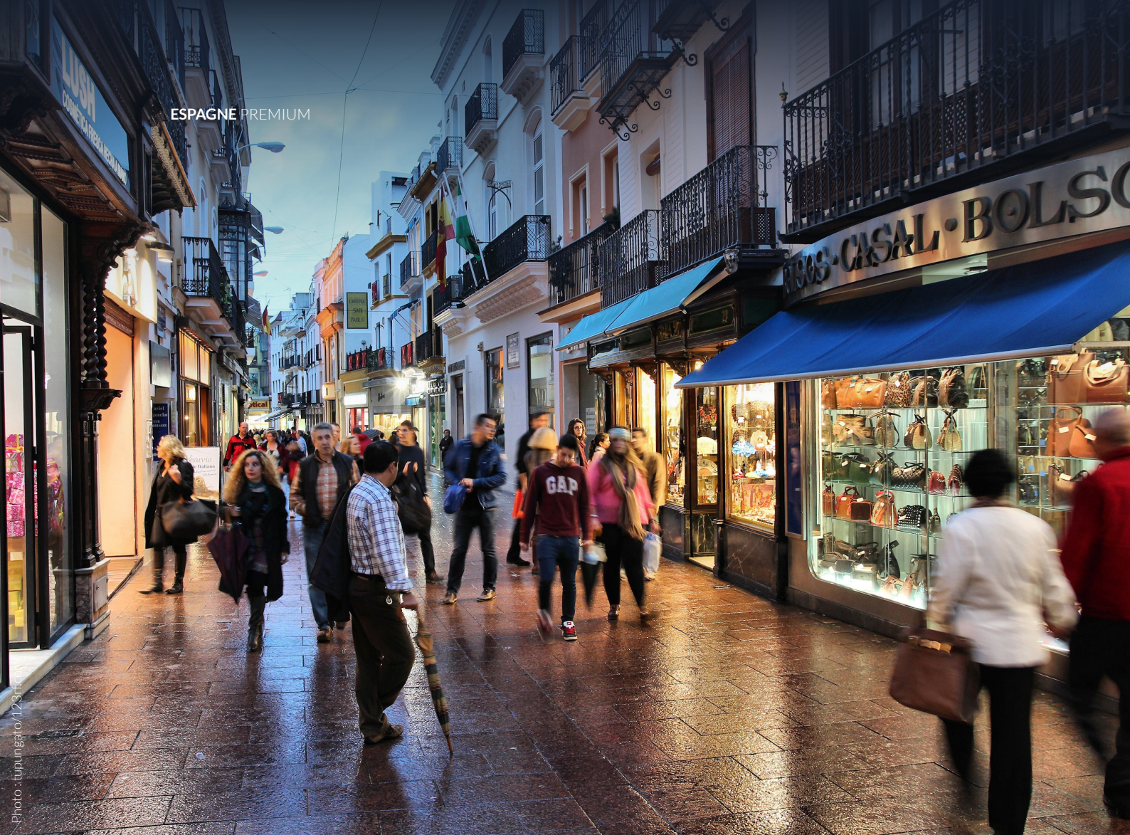
▲ RUE SIERPES SÉVILLE