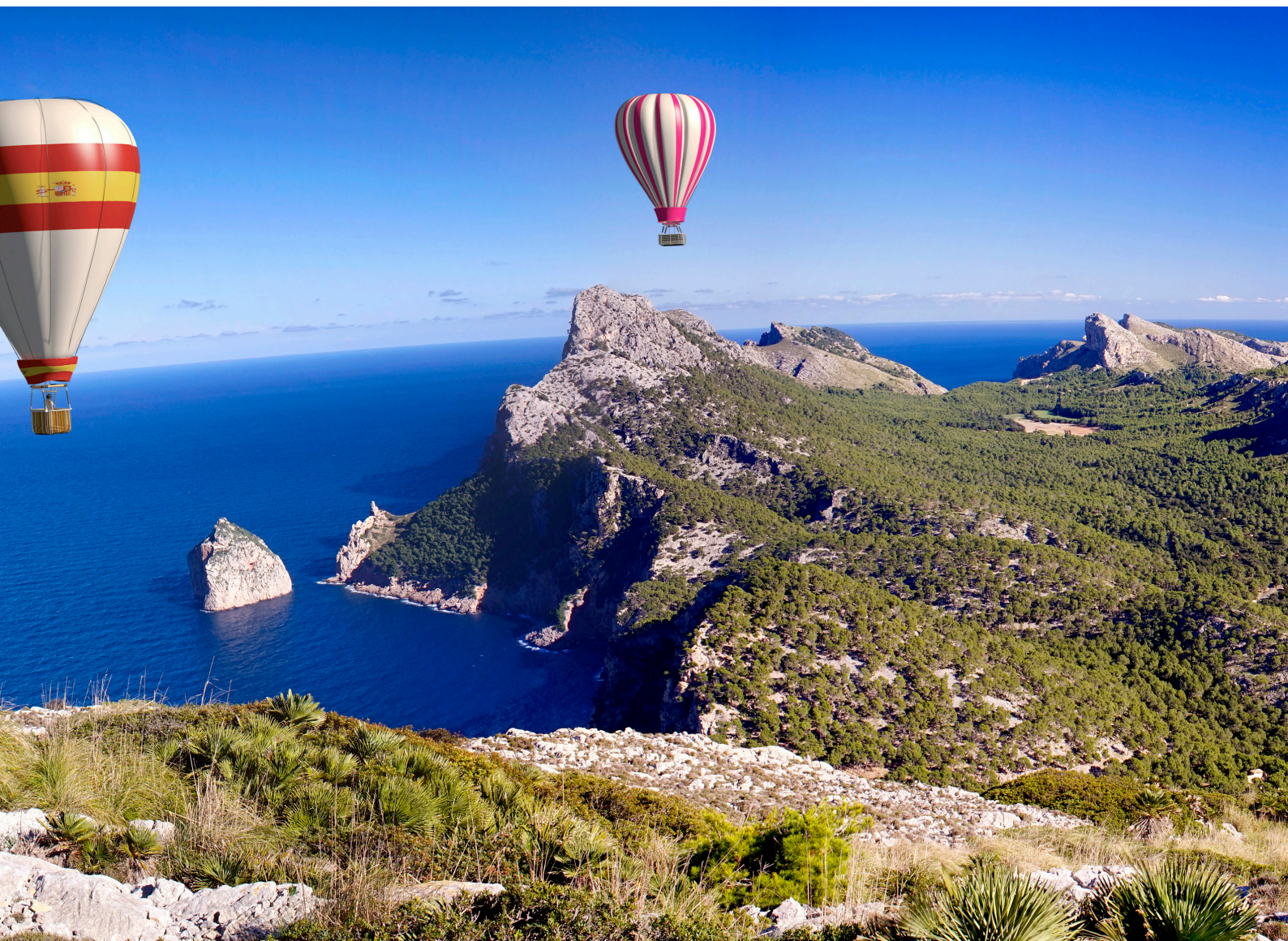
▲ MONTGOLFIÈRES AU-DESSUS DE MAJORQUE