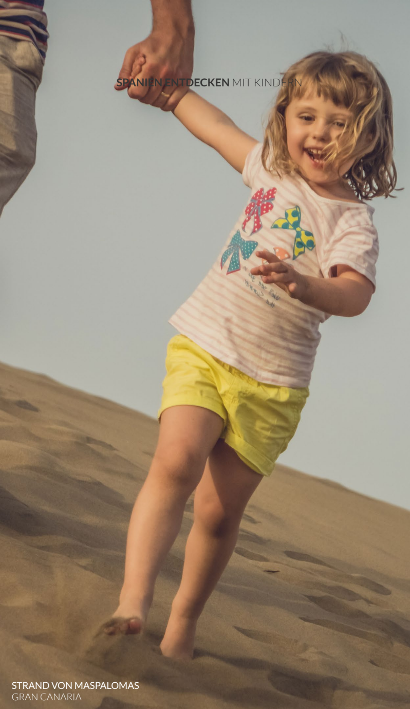
STRAND VON MASPALOMAS GRAN CANARIA

In Spanien finden Sie zu jeder Jahreszeit Strände, an denen Sie sich mit Ihrer Familie entspannen und das Meer, den Sand und die Sonne genießen können. Springen Sie in das kristallklare Wasser des Mittelmeers , das sich von der Grenze zu Frankreich bis nach Südspanien erstreckt und auch die Balearen umspült. Hier finden Sie angenehme Temperaturen, Animation und Ihre wohlverdiente Ruhe. Für Kontraste ist die Atlantikküste das richtige Ziel. Im Norden erwartet Sie in Galicien die zerklüftete Costa da Morte sowie die Fischertradition der Rias Altas und Bajas. In den südspanischen Provinzen Huelva und Cádiz locken lange weiße Sandstrände und auf den Kanarischen Inseln, südwestlich der Iberischen Halbinsel, Strände vulkanischen Ursprungs, endlose Dünen und traumhafte Meeresgründe. Schließlich ist die kantabrische Küste in Nordspanien ein Synonym für grüne Landschaften und kleine Fischerdörfer.