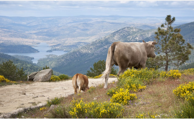
▲ NATURSCHUTZGEBIET VALLE DE IRUELAS ÁVILA