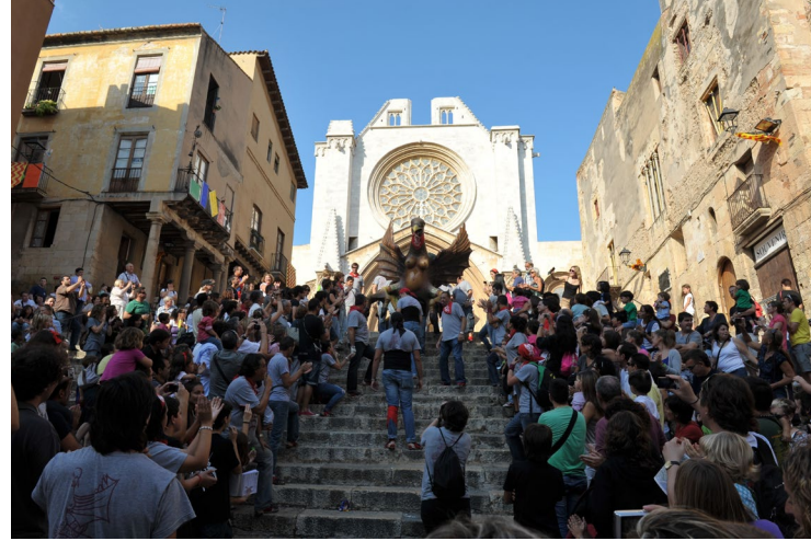
▲ KATHEDRALE SANTA TECLA TARRAGONA