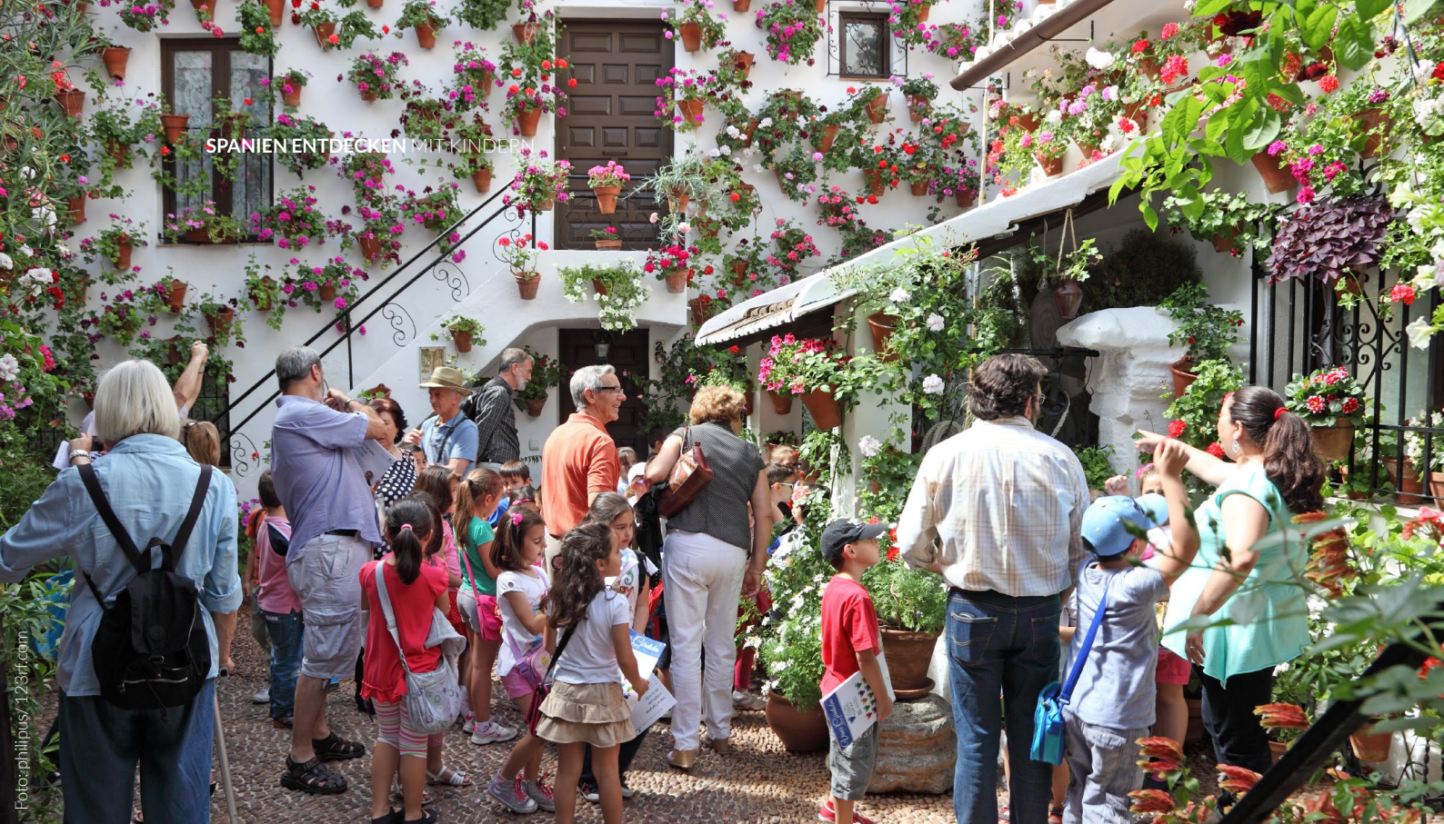
▲ INNENHOF IN CÓRDOBA CÓRDOBA