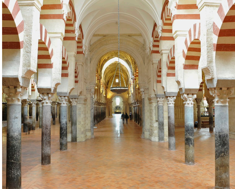
▲ INTÉRIEUR DE LA MOSQUÉE DE CORDOUE