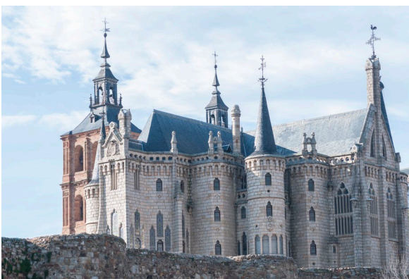
▲ PALAIS ÉPISCOPAL ASTORGA

Ce monument rappelle les châteaux des contes de fées, avec ses créneaux, ses tourelles et même sa douve qui l'entoure. Conçu par l'artiste de génie Gaudí, cet édifice moderniste de facture néogothique accueille aujourd'hui le musée des chemins.