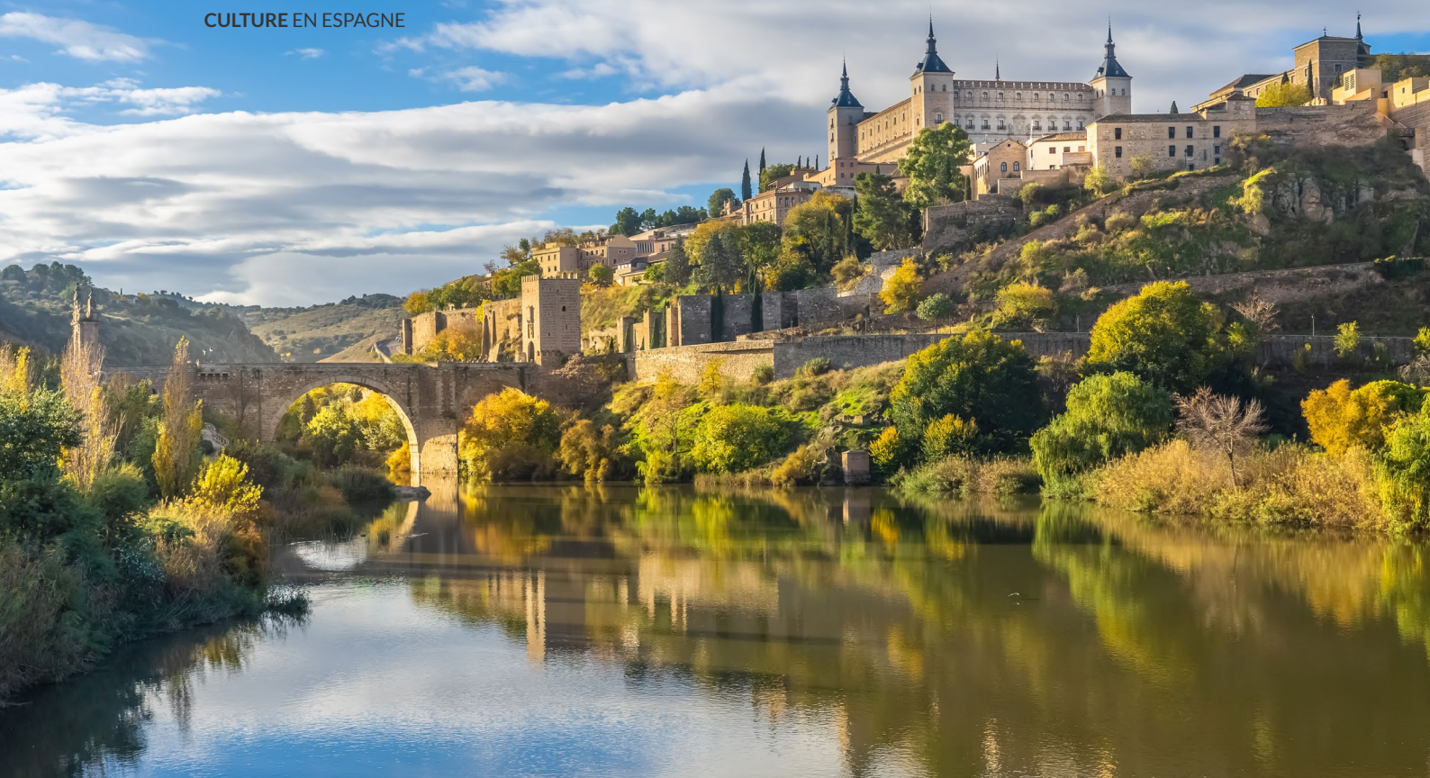
▲ L'ALCAZAR TOLÈDE