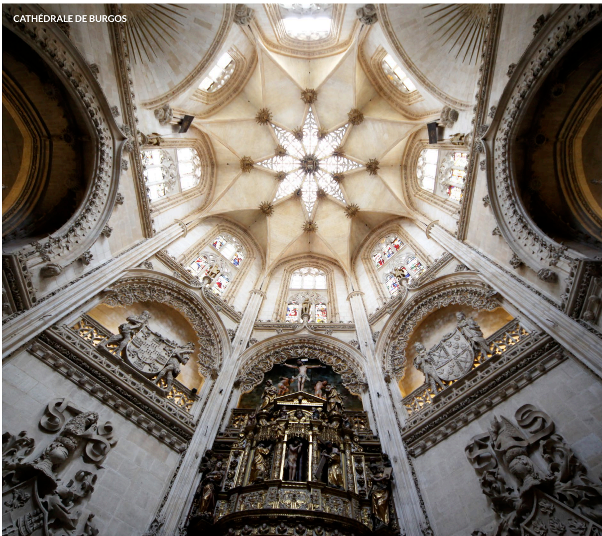
CATHÉDRALE DE BURGOS

Découvrez l' architecture mudéjare d'Aragon, avec le palais de l'Alfajería , un joyau de l'époque arabe au cœur de Saragosse, la cathédrale , l' alcazar et les Archives des Indes de Séville, ou encore l' architecture mudéjare en Aragon ou les remparts romains de Lugo. Les possibilités sont infinies.