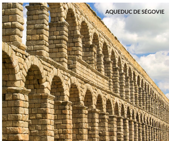
AQUEDUC DE SÉGOVIE