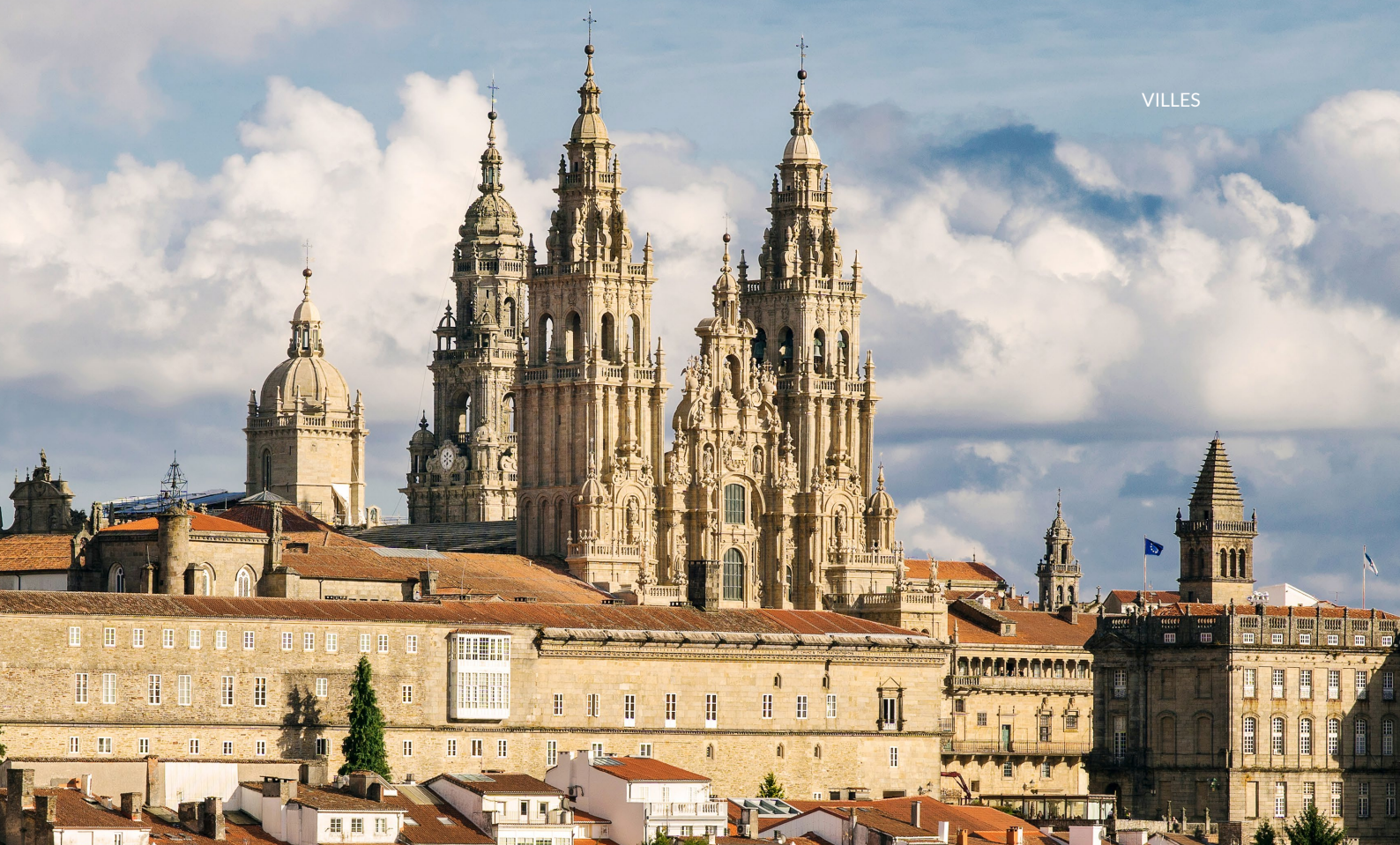
► CATHÉDRALE DE SAINT-JACQUES SAINT-JACQUES-DE-COMPOSTELLE