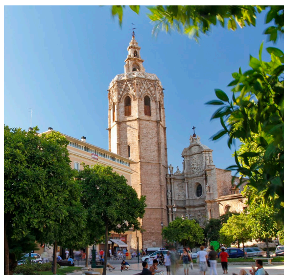
▲ LE MIGUELETE VALENCE

Laissez-vous aussi surprendre par la Cité des arts et des sciences , parmi les plus grands complexes de divulgation scientifique et culturelle d'Europe. Le design avant-gardiste de ses bâtiments est fascinant, notamment l'Hemisfèric , une salle de projection en forme d'œil,