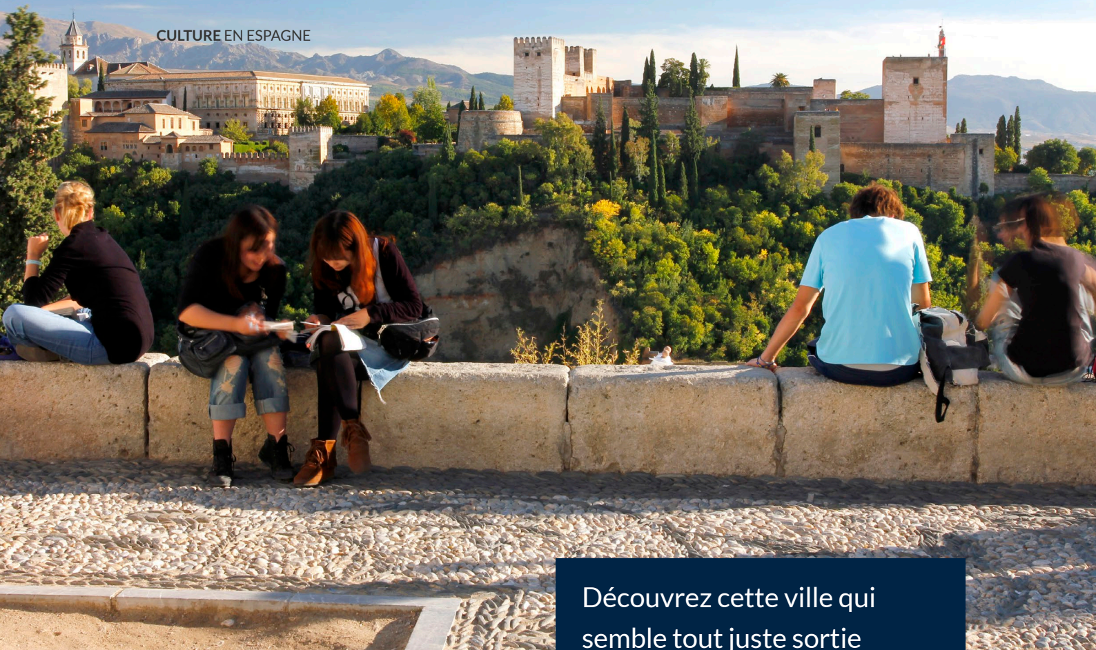
▲ MIRADOR DE SAN NICOLÁS GRENADE

Découvrez cette ville qui semble tout juste sortie d'un conte des Mille et une nuits : près de huit siècles de présence arabe ont laissé à Grenade un précieux héritage d'al-Andalus.