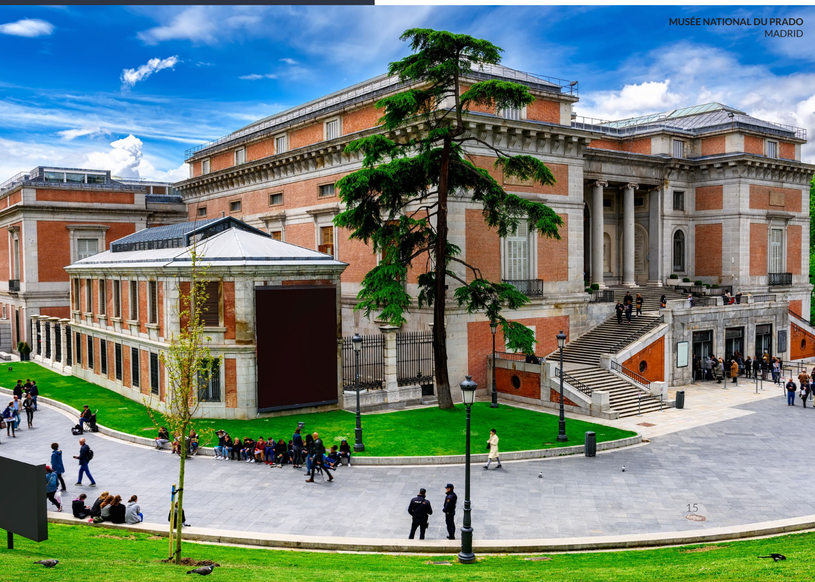
MUSÉE NATIONAL DU PRADO MADRID

Vous pourrez y admirer des trésors tels que les Ménines de Diego Velázquez , le Chevalier à la main sur la poitrine du Greco ou le Jardin des délices de Jérôme Bosch .