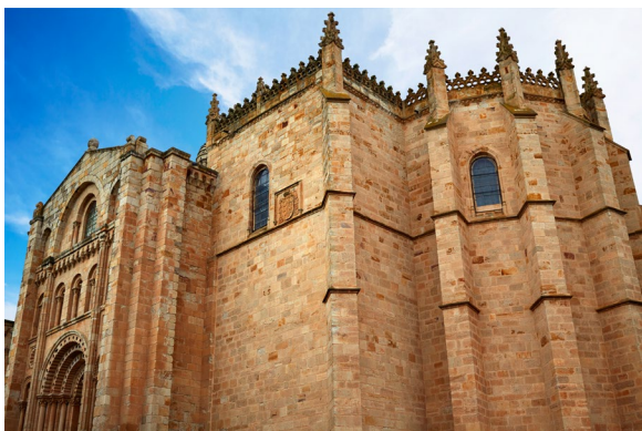
▲ CATHÉDRALE DE ZAMORA