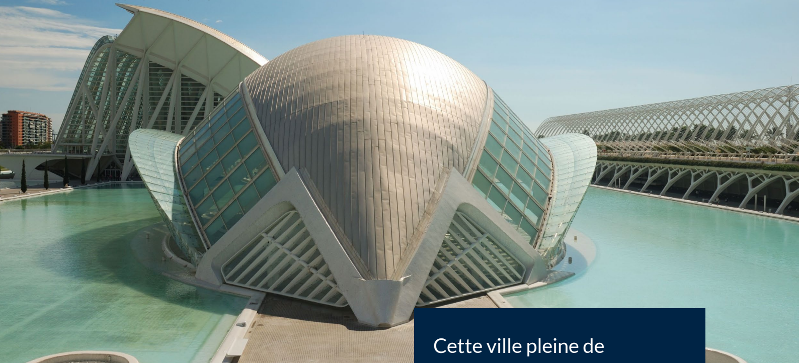
▲ CITÉ DES ARTS ET DES SCIENCES VALENCE

Cette ville pleine de contrastes respire l'essence de la Méditerranée.