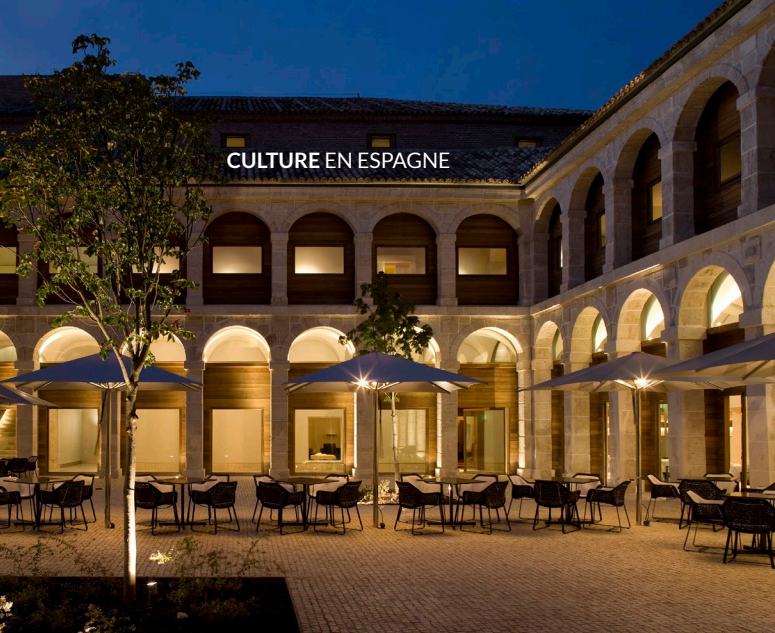
▲ PARADOR D'ALCALÁ DE HENARES MADRID