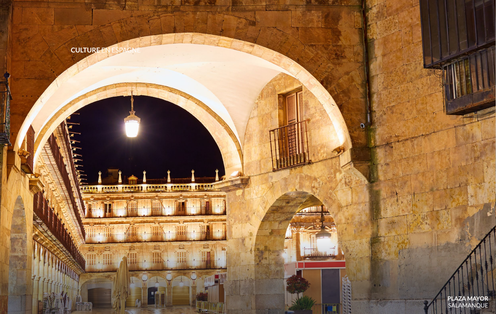
PLAZA MAYOR SALAMANQUE