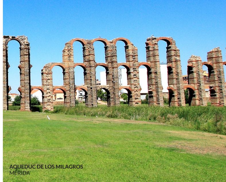
AQUEDUC DE LOS MILAGROS MÉRIDA