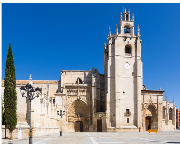
▲ CATHÉDRALE DE PALENCIA

L'Espagne recèle d'innombrables trésors et secrets. Voici 10 bijoux culturels qui n'attendent que vous.