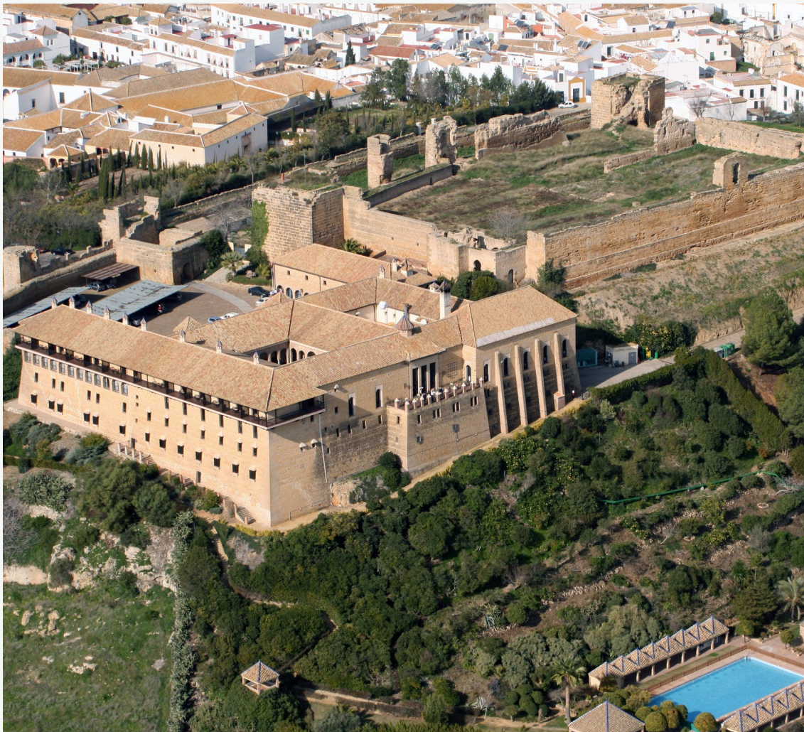
▲ PARADOR DE CARMONA SÉVILLE