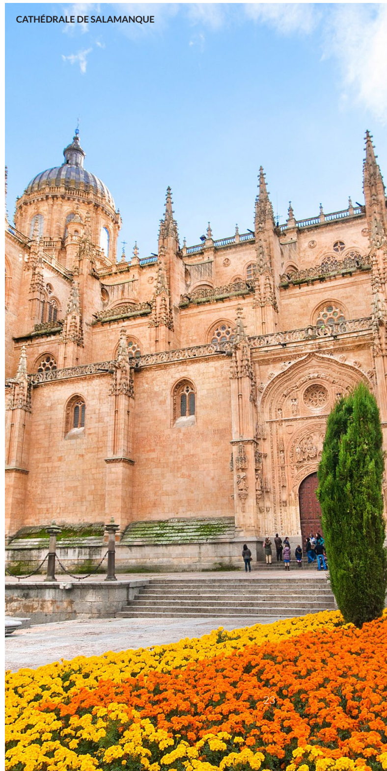
CATHÉDRALE DE SALAMANQUE

Remontez le temps à travers les rues de cette ville pittoresque des Canaries, sur l'île de Tenerife. Son tracé colonial caractéristique abrite une imposante cathédrale et de nombreuses demeures seigneuriales des XVII e et XVIII e siècles.