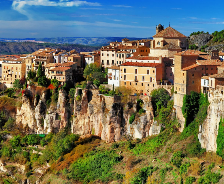
▲ MAISONS SUSPENDUES CUENCA