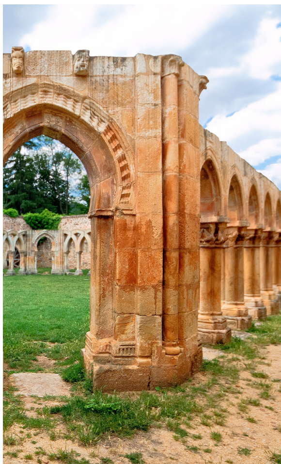
▲ CLOÎTRE SAN JUAN DE DUERO SORIA

Découvrez cet exemple d'architecture chrétienne médiévale. Ses arcatures témoignent des différentes tendances de l'époque : l'art roman, gothique et musulman.