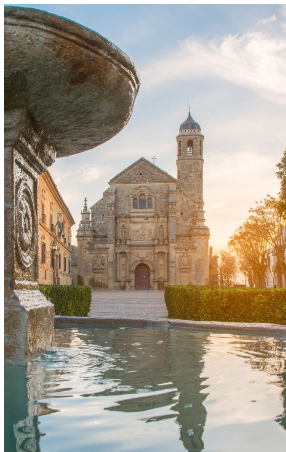
▲ CHAPELLE DU SALVADOR ÚBEDA, JAÉN

La vieille ville d'Ibiza, appelée Dalt Vila , est classée au patrimoine mondial de l'UNESCO. Longez ses remparts Renaissance qui avaient pour but de défendre la ville des attaques turques au XVI e siècle.