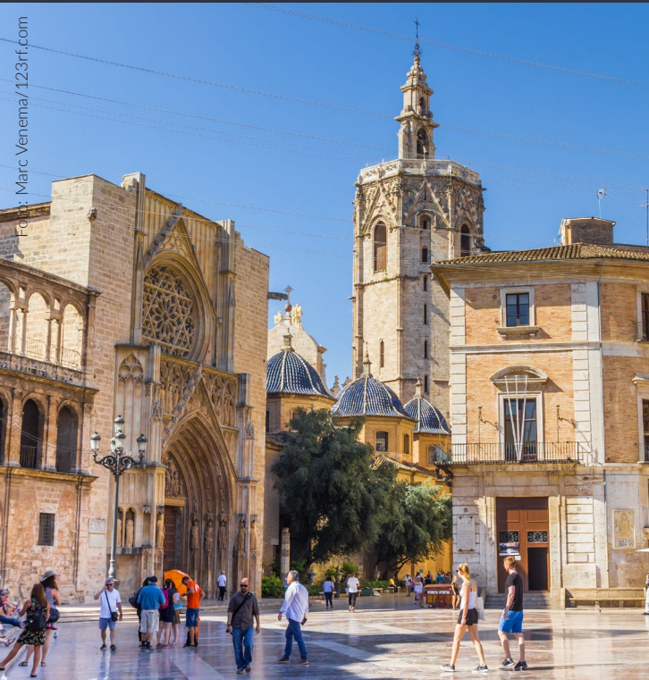
▲ CATEDRAL DE VALÈNCIA VALÈNCIA