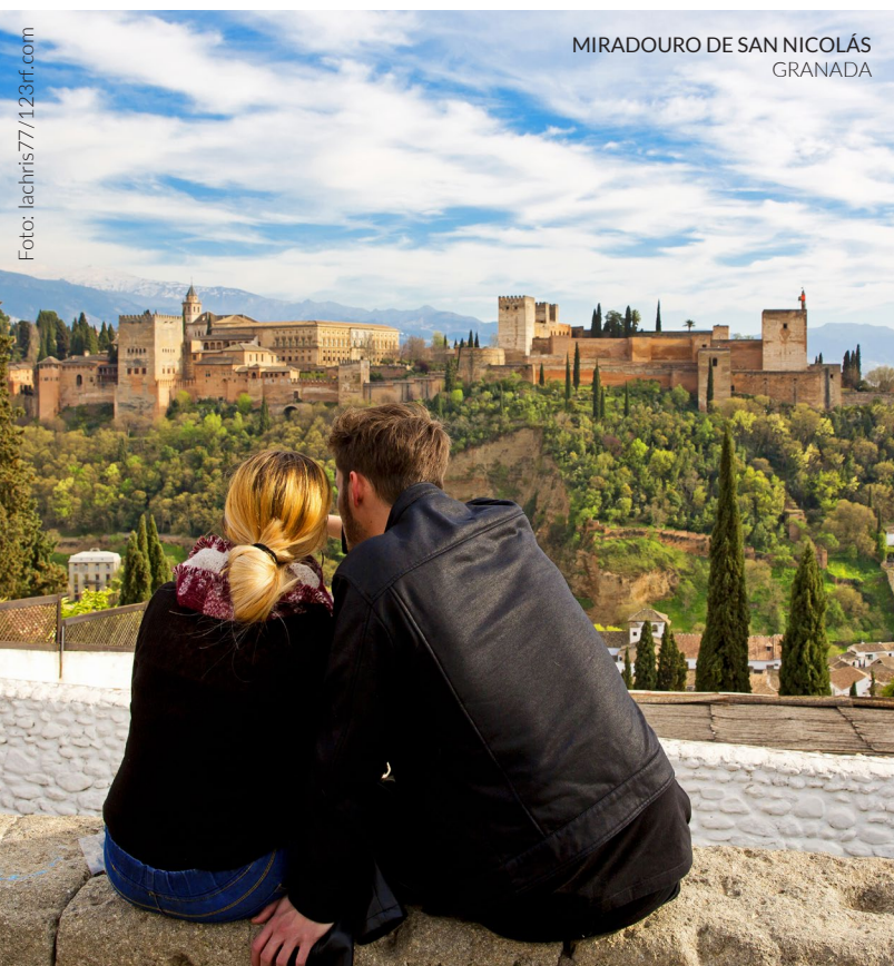
MIRADOURO DE SAN NICOLÁS GRANADA

Para apreciar os valores arquitetónicos e paisagísticos deste monumento considerado Património Mundial pela UNESCO, vai até ao miradouro de San Nicolás no bairro de Albaicín ou ao Sacromonte . Desde estes locais poderás entender a espetacular relação entre a Alhambra com o território e a cidade de Granada.