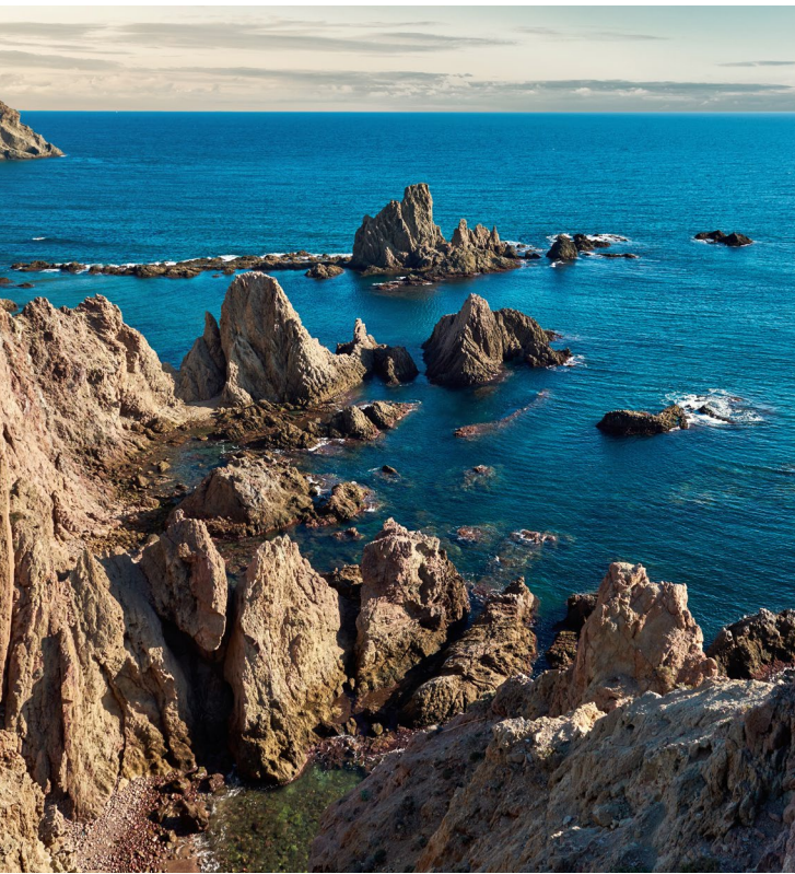
▲ PARQUE NATURAL DO CABO DE GATA ALMERIA