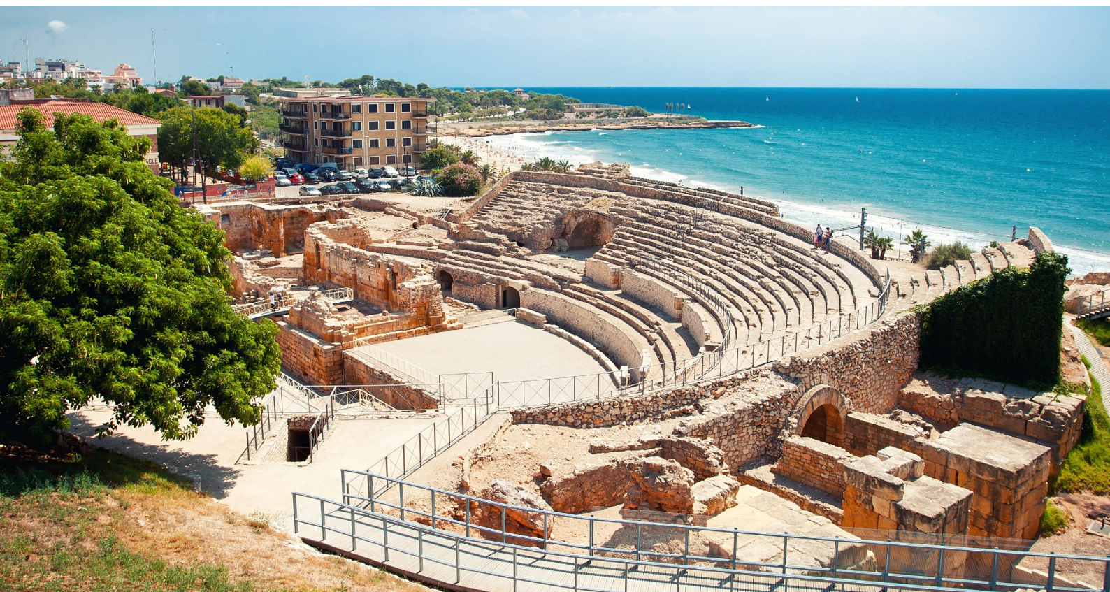
▲ ANFITEATRO ROMANO TARRAGONA