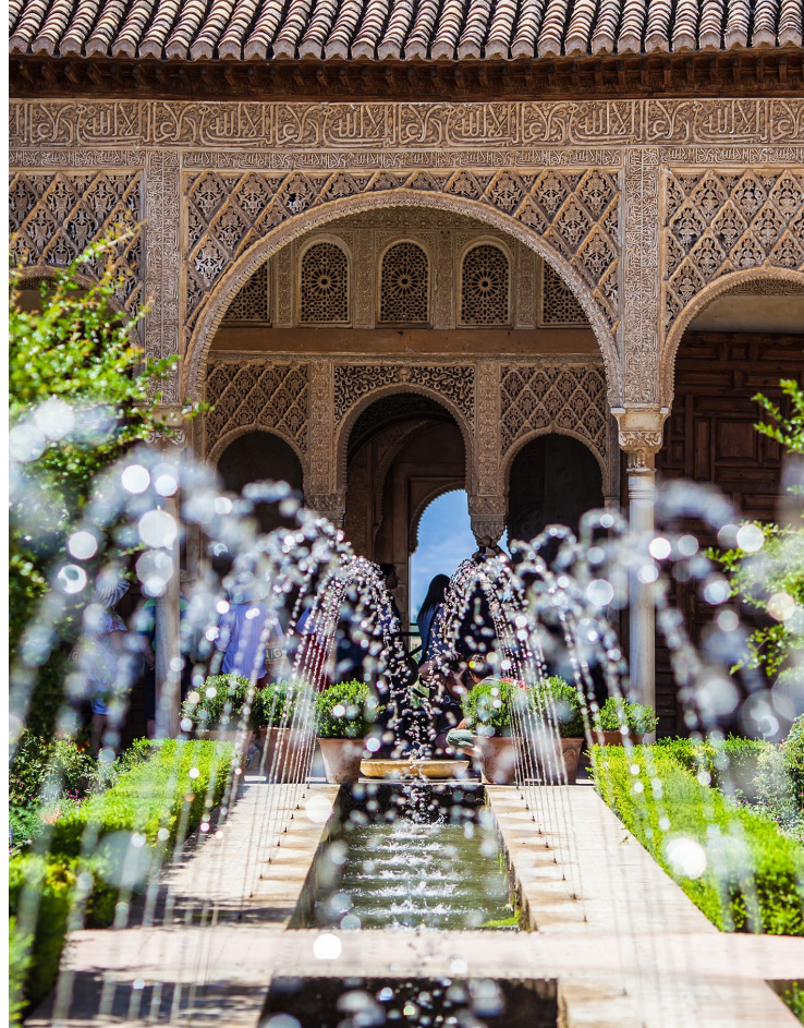
▲ JARDINS DO GENERALIFE, ALHAMBRA GRANADA

O monumento imprescindível em qualquer viagem a Granada é La Alhambra , palácio, cidadela e fortaleza em sucessivas épocas, que atualmente é um dos mais importantes patrimónios artísticos de toda a Espanha.