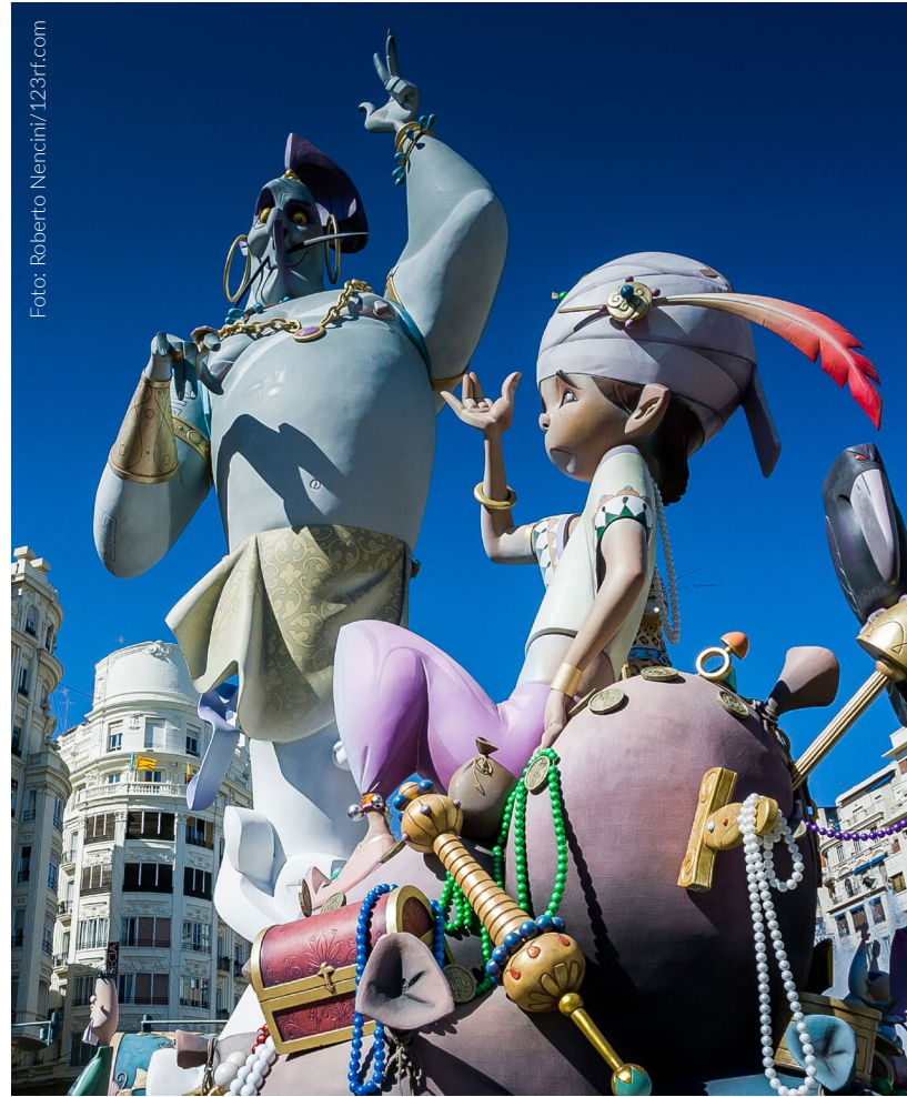
▲ AS FALLAS VALÈNCIA

A poucos passos visita El Miguelete , como é conhecido o campanário da catedral de Valência. Desde os seus 50 metros de altura poderás ver uma impressionante vista panorâmica da cidade.