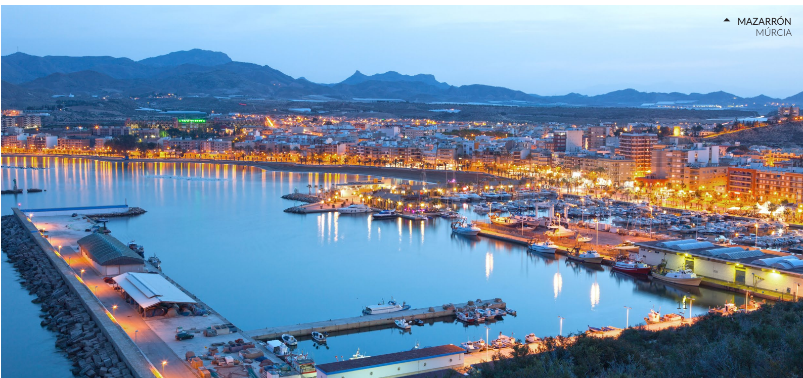
▲ MAZARRÓN MÚRCIA

Aqui perto, após uma boa caminhada de mais de uma hora desde o parque regional, dá um mergulho na cala de las Mulas , em Cartagena, uma praia virgem e rústica, ideal para praticar mergulho.