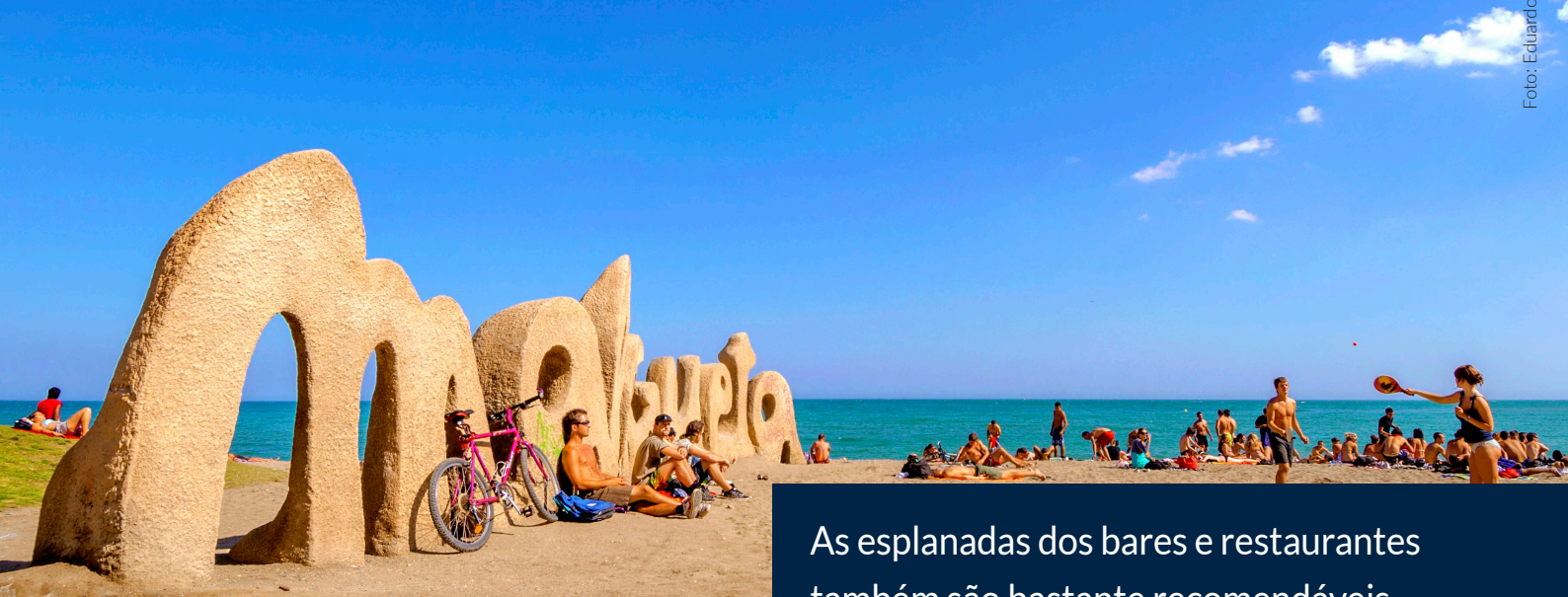
PRAIA DE LA MALAGUETA MÁLAGA

As esplanadas dos bares e restaurantes também são bastante recomendáveis, principalmente ao entardecer, quando poderás desfrutar de um pôr-do-sol inesquecível.