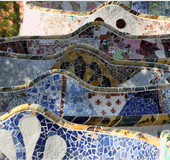
▲ PARK GÜELL BARCELONA

Percorre o passado histórico da cidade no Bairro Gótico . As suas ruas estreitas e construções medievais vão transportar-te no tempo. Admira os palácios da Câmara Municipal e da Generalitat , a catedral de Barcelona ou a basílica gótica de Santa María del Pi .