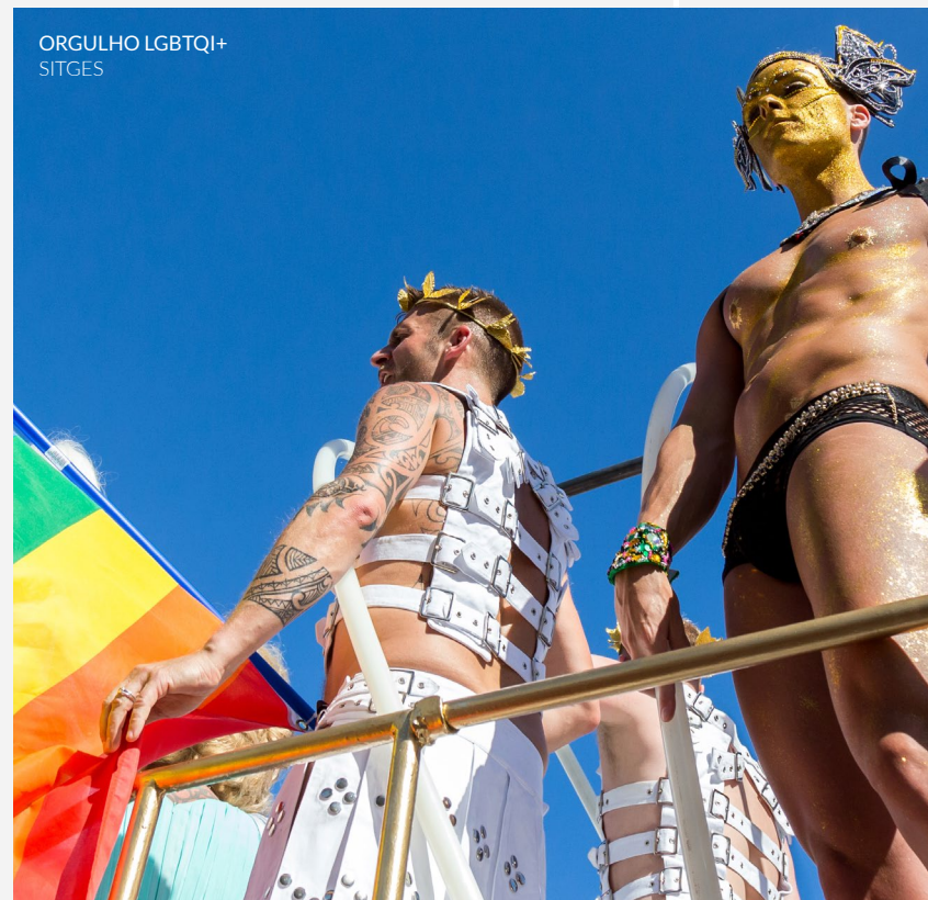
ORGULHO LGBTQI+ SITGES

O Sitges Pride (Barcelona) converteu-se em toda uma referência dentro das celebrações do Orgulho em Espanha. Assiste a várias atuações e festas temáticas em discotecas da cidade e ao grande cortejo reivindicativo e desfruta da cor e do ambiente festivo que se vive na cidade nesses dias de junho.