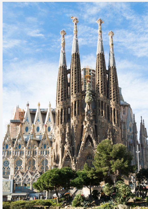
▼ A SAGRADA FAMÍLIA BARCELONA

No coração de Barcelona encontra-se a basílica da Sagrada Família , ícone da cidade e máximo expoente do modernismo. Obra do genial arquiteto Antoni Gaudí , o que mais te vai chamar a atenção vão ser as torres pontiagudas. Poderás aceder à parte superior de algumas delas para contemplar uma bonita vista panorâmica de Barcelona desde as alturas.