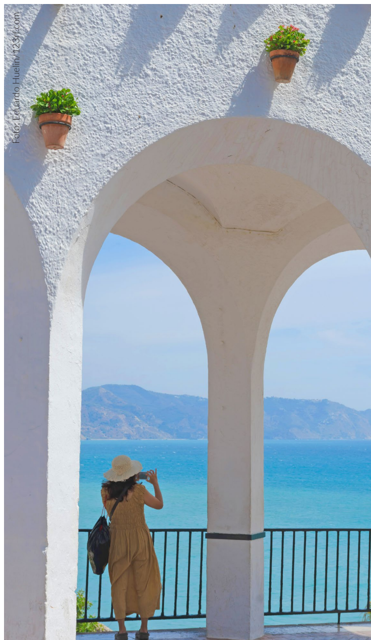
▲ Balcão da Europa Nerja, Málaga

Debaixo do Balcão da Europa , uma praça circular sobre o mar que se tornou no lugar mais emblemático de Ner-