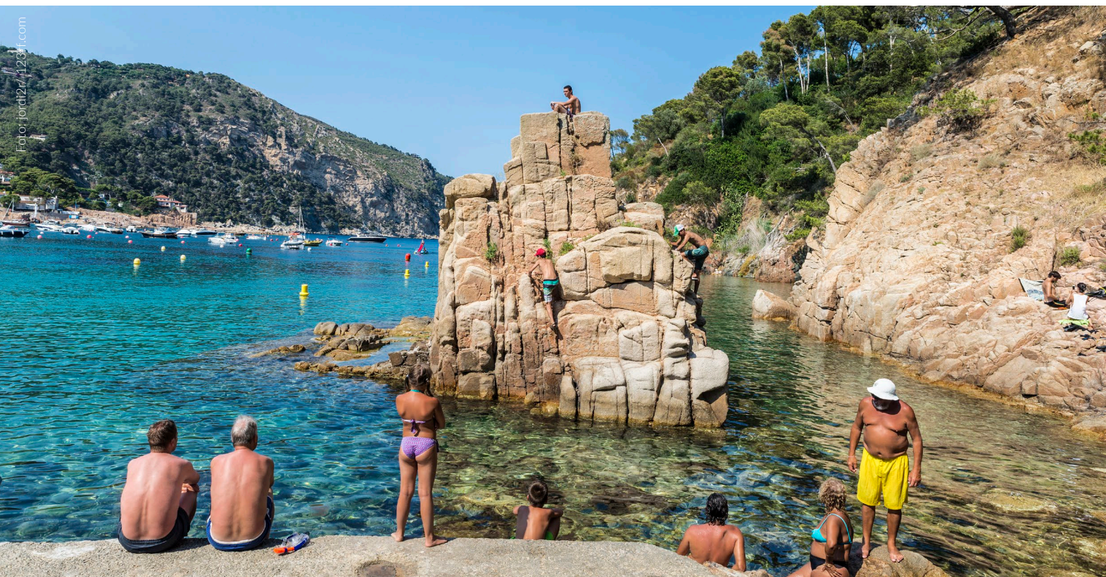
▲ PRAIA DE AIGUABLAVA BEGUR, GIRONA

seio pelas escadas de madeira que nos transportam a um miradouro fantástico da baía de Roses e ao centro urbano de L'Escala. Muito perto da praia também se encontram as ruínas greco-romanas de Empúries , uma das jazidas arqueológicas mais importantes de Espanha.