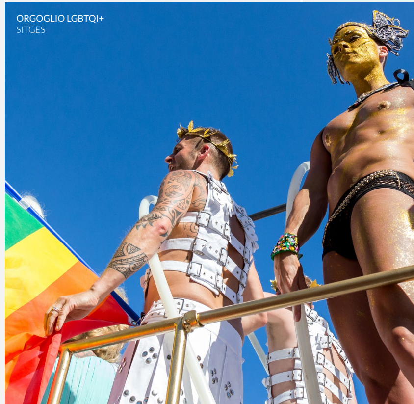
ORGOGGIO LGBTQI+ SITGES

Il Sitges Pride (Barcellona) è diventato un punto di riferimento nell'ambito degli eventi legati all'orgoglio gay in Spagna. Innumerevoli spettacoli, feste a tema nelle discoteche della città e naturalmente la grande sfilata rivendicativa ti inviteranno a godere dei colori e dell'atmosfera gioiosa che si respira in questi giorni di giugno.