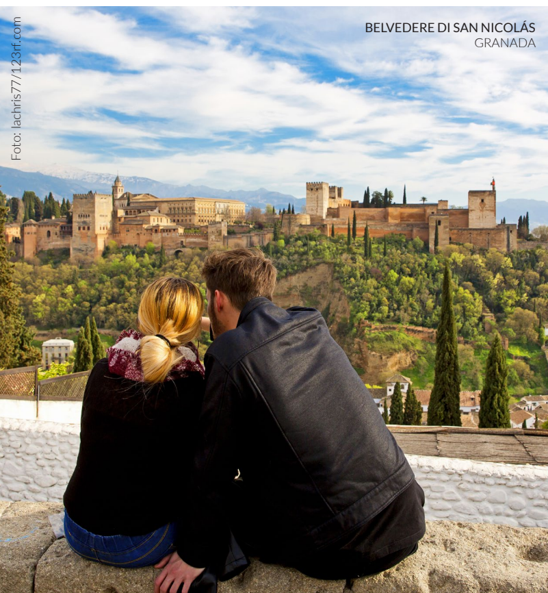
BELVEDERE DI SAN NICOLÁS GRANADA

Tappa fissa di qualsiasi tour nella città di Granada, La Alhambra , palazzo, cittadella e fortezza in diverse epoche storiche, oggi è uno dei più importanti patrimoni artistici di tutta la Spagna.