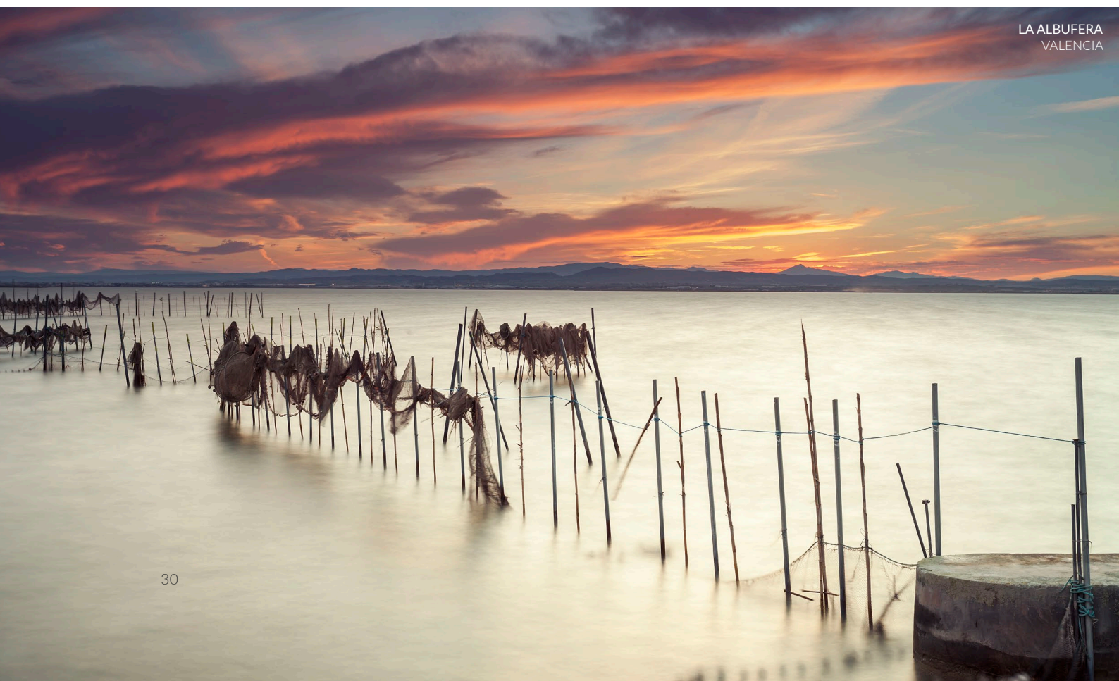
LA ALBUFERA VALENCIA

Se ami il birdwatching, la zona umida più importante della Murcia ti sta aspettando. Alla fine di luglio migliaia di fenicotteri si concentrano nella zona tingendo di rosa questo paesaggio spettacolare. Un breve percorso all'alba tra le saline, una passeggiata a piedi lungo i sentieri segnalati o un bagno di fanghi terapeutici sono esperienze di benessere in un ambiente tranquillo e privilegiato.