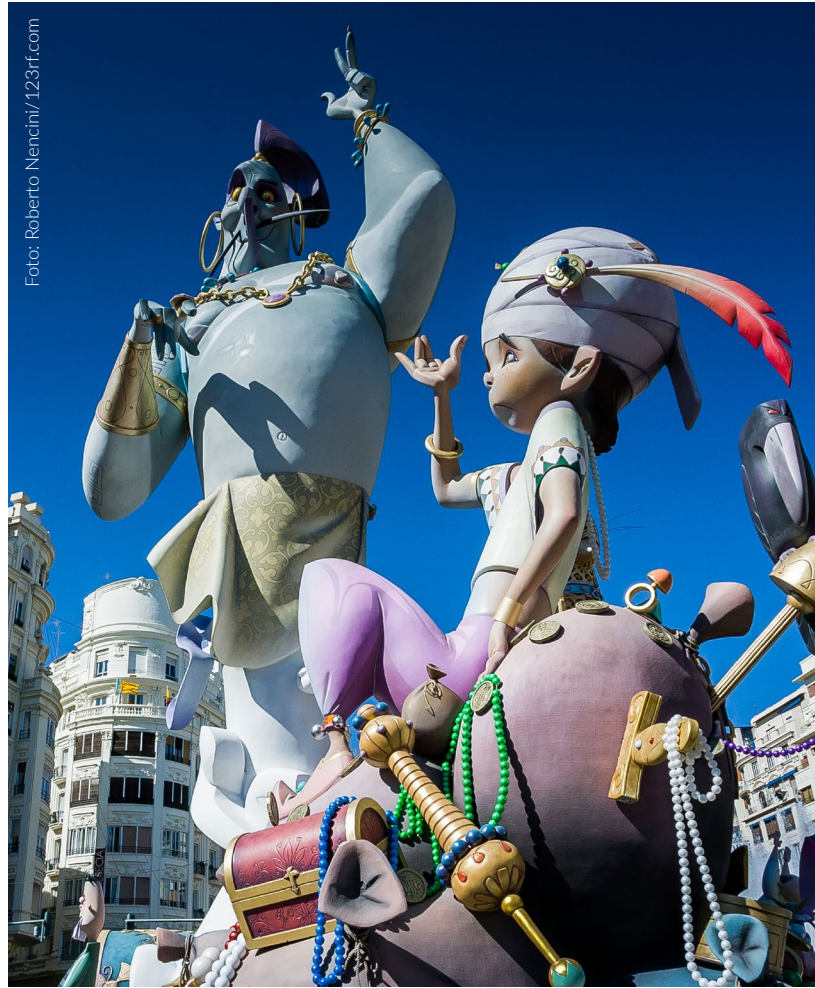
▲ LE FALLAS VALENCIA

A pochi passi di distanza si trova il campanile della cattedrale di Valencia, popolarmente noto come El Miguelete . Dai suoi 50 metri d'altezza offre un'impressionante veduta panoramica della città.