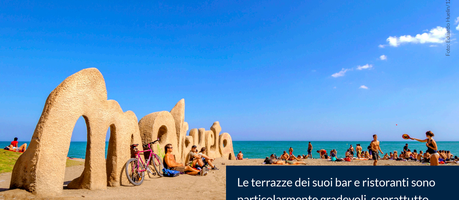
SPIAGGIA DELLA MALAGUETA MALAGA

Le terrazze dei suoi bar e ristoranti sono particolarmente gradevoli, soprattutto a fine giornata, quando potrai contemplare un tramonto indimenticabile.