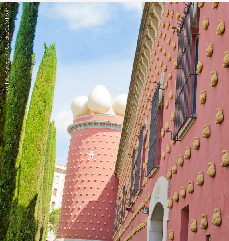
▲ TEATRO-MUSEO DALÍ FIGUERES

Nel magnifico scenario di Cadaqués si trova il piccolo villaggio marinaro di Portlligat, dove potrai visitare la Casa-Museo Dalí , un'abitazione di pescatori in cui l'artista trascorse lunghi periodi della sua vita. Potrai osservare gli strumenti di lavoro nel suo laboratorio e una zona esterna con numerosi riferimenti surrealisti.