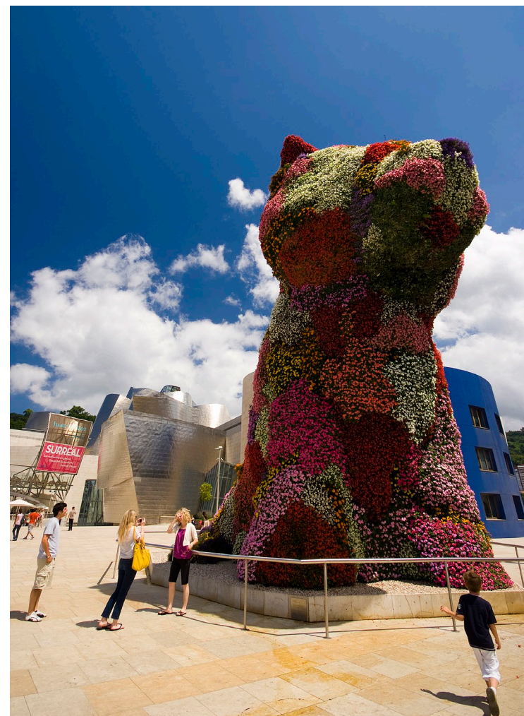
▼ MUSEO GUGGENHEIM DE BILBAO

El 11 de octubre, día de Nuestra Señora de Begoña, se celebra una animada romería amenizada con conciertos, pasacalles, actividades infantiles, danza y deporte rural vasco. Desde la plaza de Unamuno se alzan unas escaleras con mucha historia, llamadas las Calzadas