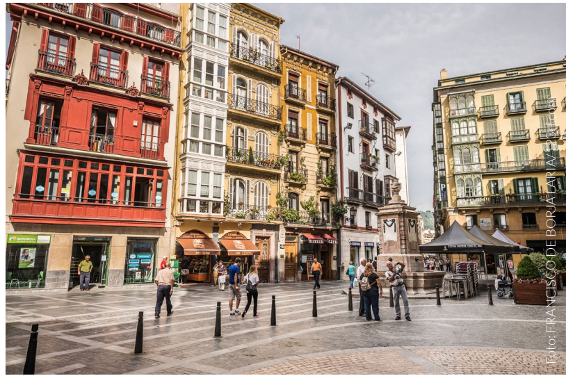
▲ CASCO VIEJO

Podrás pasear por anchas calles en forma de cuadrícula, que confluyen en lugares como la plaza Circular. Allí se encuentra el monumental edificio de la Sociedad Bilbaína , una construcción de aires eclécticos con un exquisito acabado interior de estilo inglés y sede del club más selecto y exclusivo de Bilbao.