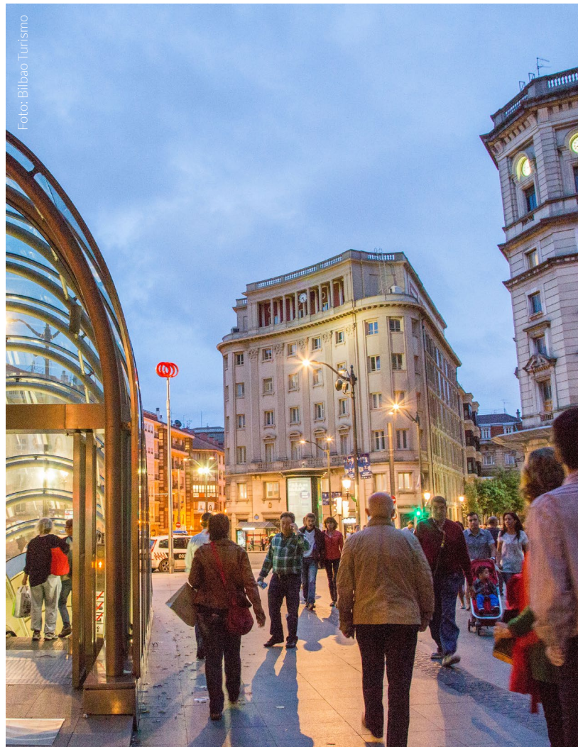
▼ PLAZA CIRCULAR