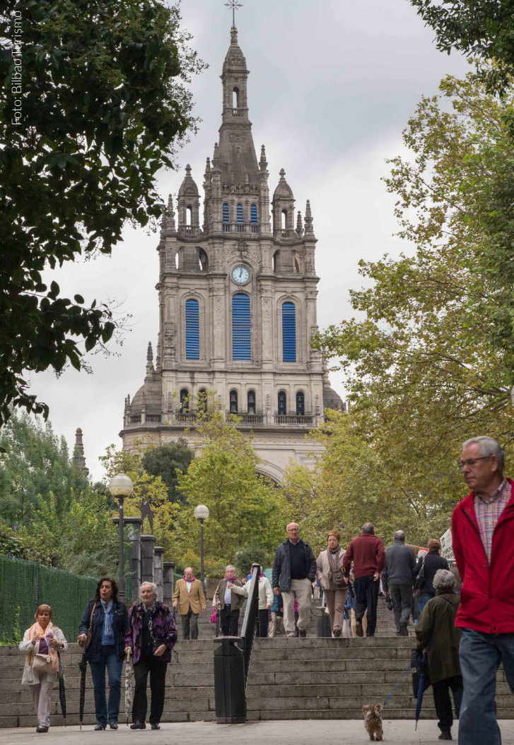
▲ BASÍLICA DE BEGOÑA