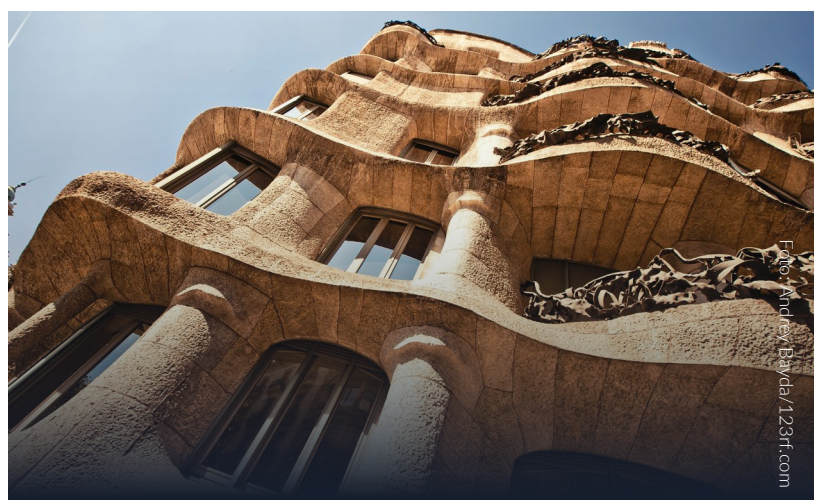
▲ LA PEDRERA