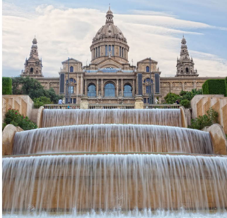
▲ PALAU NACIONAL DE MONTJUÏC

Ai piedi del Montjuïc si estende Plaza de Espanya , dove confluiscono alcune delle strade più vivaci di Barcellona,