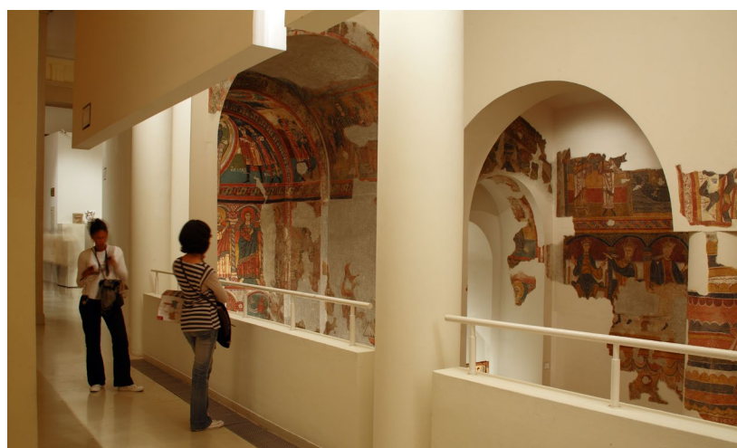
▲ INTERNO DEL MUSEU NACIONAL D'ART DE CATALUNYA (MNAC)

CaixaForum: usufruisci della ricca offerta di uno dei centri culturali più prestigiosi della Spagna. Propone mostre temporanee, conferenze e attività educative per tutta la famiglia.