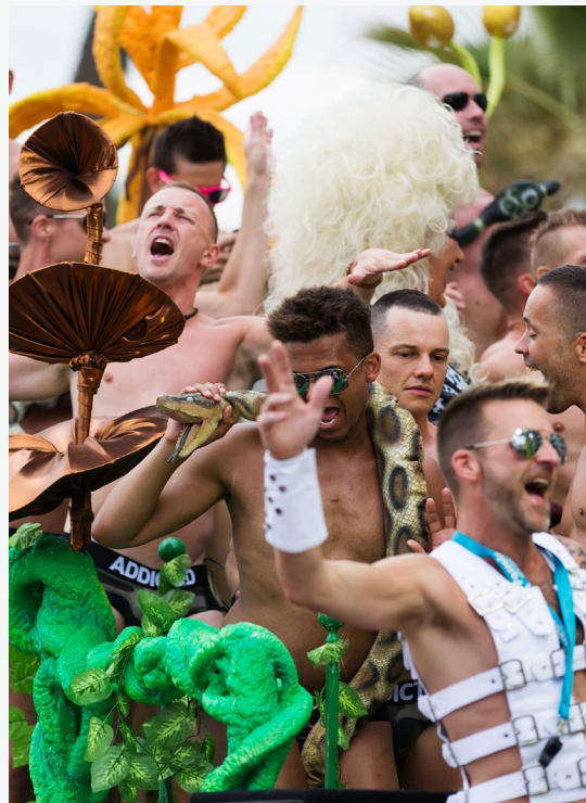
▲ PARATA SITGES PRIDE SITGES

A poco più di 20 minuti da Barcellona si trova Sitges , una bellissima località, paradiso LGBTI+. Passeggia per le spiagge e le strade che furono motivo di ispirazione per un'intera generazione di artisti catalani alla fine del XIX secolo.