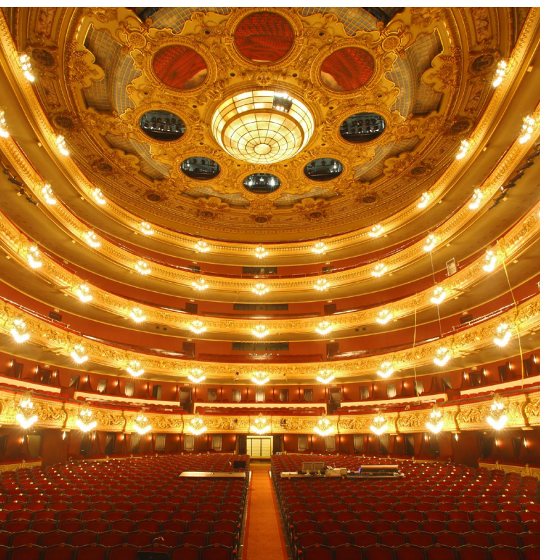
▼ GRAN TEATRE DEL LICEU