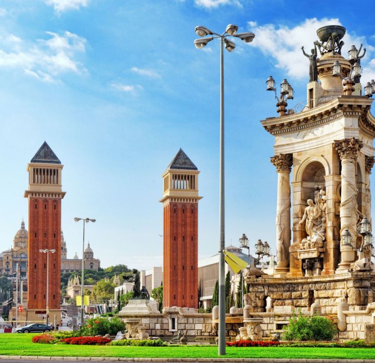
▲ PLAZA DE ESPANYA