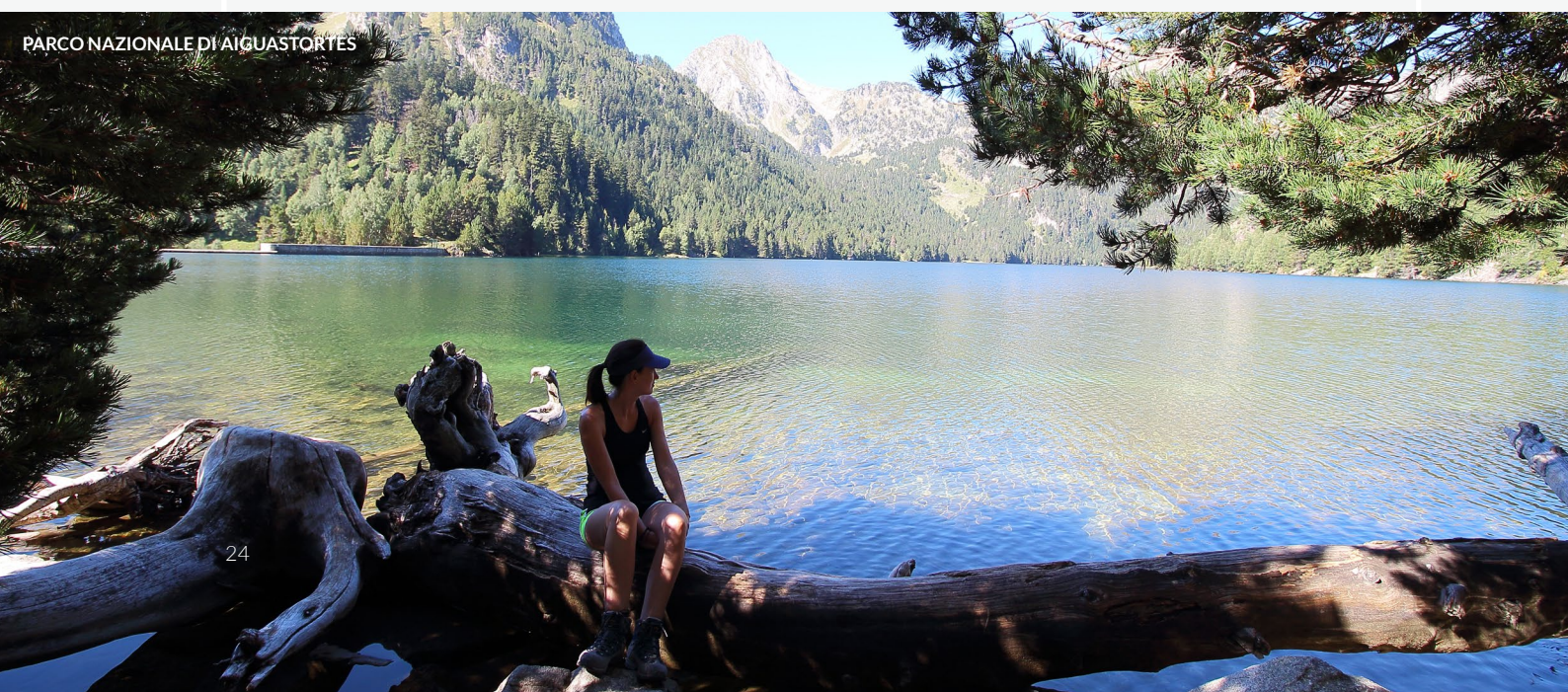
PARCO NAZIONALE DI AIGUASTORTES

Il parco naturale del Cadí-Moixeró , tra le province di Barcellona, Girona e Lleida, è l'ideale per visite a piedi, a cavallo o in bicicletta. Un altro scenario di singolare bellezza è il parco naturale della Zona Vulcanica della Garrotxa (Girona): esploralo e lasciati sorprendere da uno dei migliori esempi di paesaggio vulcanico della Spagna.