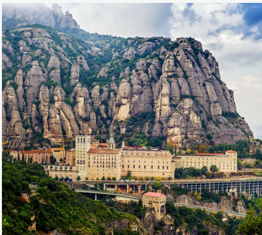
▲ MONASTERO DI SANTA MARÍA DI MONTSERRAT

A Figueres (Girona) troverai il surrealista Teatro-Museo Dalí e la fortezza del XVIII secolo considerata la più grande d'Europa: il castello di Sant Ferran . Un'altra tappa obbligatoria sono le sorgenti del fiume Llobregat , presso la località di Castellar de n'Hug. Lasciati deliziare dalla vista dell'acqua che sgorga formando una bella cascata.