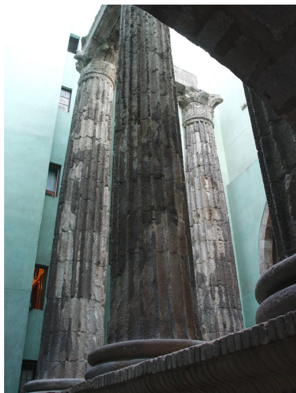
▲ TEMPIO DI AUGUSTO

María del Mar e il monastero romanico di Sant Pere de les Puelles .