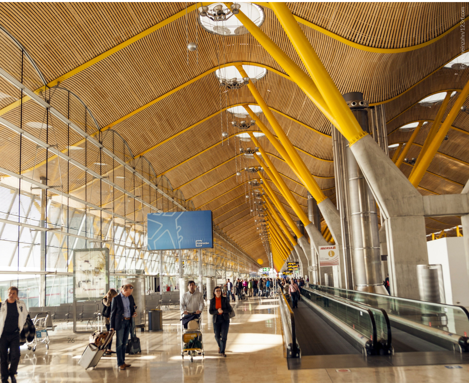
▼ TERMINAL 4 DES FLUGHAFENS MADRID-BARAJAS ADOLFO SUÁREZ MADRID

„Eine Zelebration der Reise, bei der es um das Leben des Bürgers geht“, meinte Rogers, der seine Erfahrungen mit bioklimatischer Architektur für sein avantgardistisches Design umsetzte. Um die Orientierung der Passagiere zu verbessern, ändert sich die Farbe der Pfeiler im Einstiegsbereich, wodurch eine farbliche Vielfalt entstanden ist, die Sie faszinieren wird.