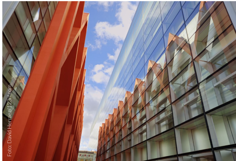
▲ MUSEUM DER EVOLUTIONSGESCHICHTE DES MENSCHEN BURGOS

Beim Betreten des Hauptgebäudes stellt sich bei Ihnen sogleich ein Ge-