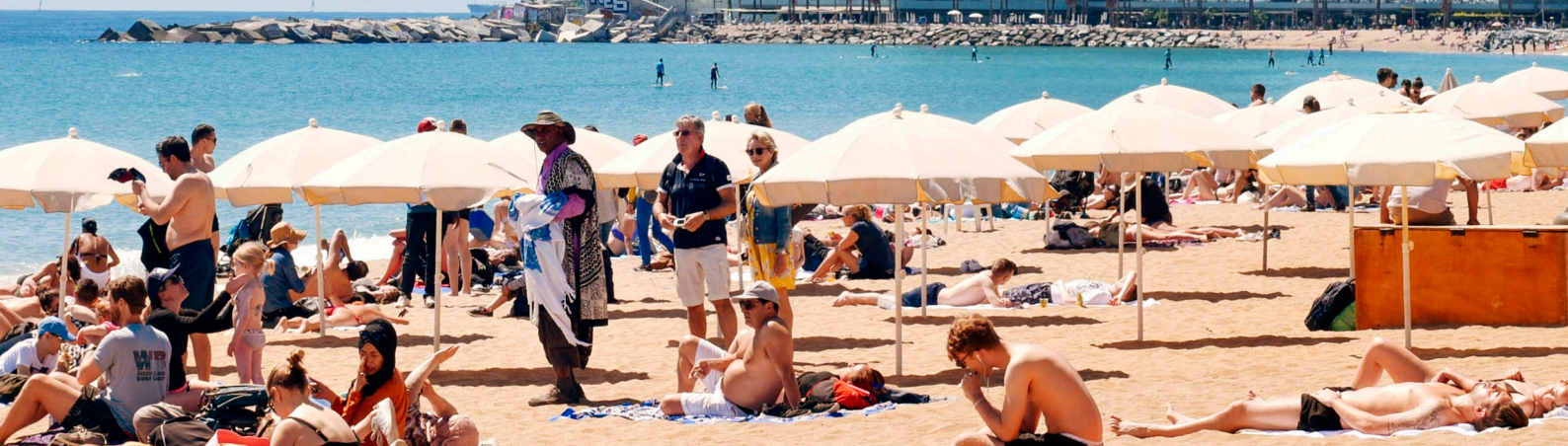
▲ W HOTEL BARCELONA

Im Gebäude selbst erleben Sie nicht zuletzt dank des Mobiliars und der Beleuchtung ein durch und durch avantgardistisches Interieur. Begeben Sie sich in das Restaurant im obersten Stockwerk, fast hundert Meter über dem Boden, und genießen Sie dort einen unvergleichlichen Blick auf Barcelona.