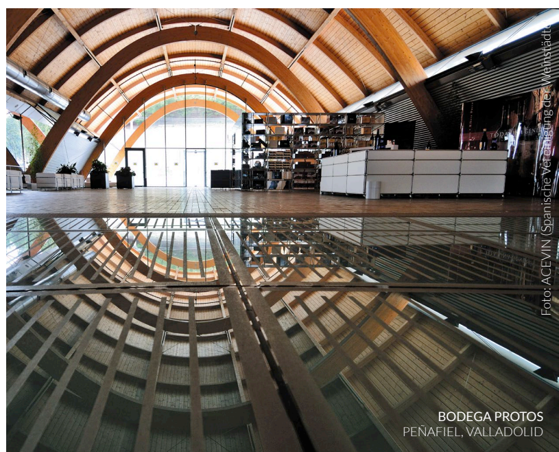
BODEGA PROTOS PEÑAFIEL, VALLADOLID

Das auffälligste optische Element der Weinkellerei ist ihr Dach. Am besten sieht man es von dem erhöhten Standort der Burg aus: fünf Gänge, die mit großformatigen Keramikstücken abgedeckt sind , die an die Farbe und Form der traditionellen Dachpfannen der Gegend erinnern.