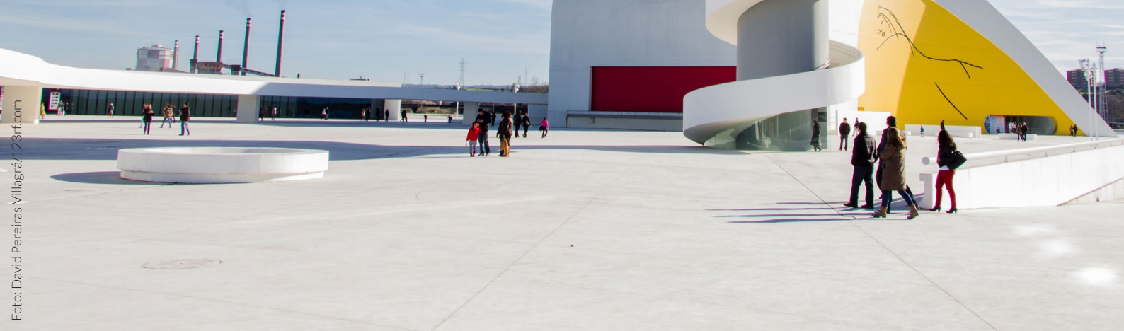
▲ NIEMEYER-ZENTRUM AVILÉS

Auf einem leeren Blatt Papier begann der brasilianische Architekt Oscar Niemeyer Kurven zu zeichnen, um Asturien, wo er 1989 mit dem renommierten Prinz-von-Asturien-Preis für Kunst ausgezeichnet wurde, ein wundervolles Geschenk zu machen.