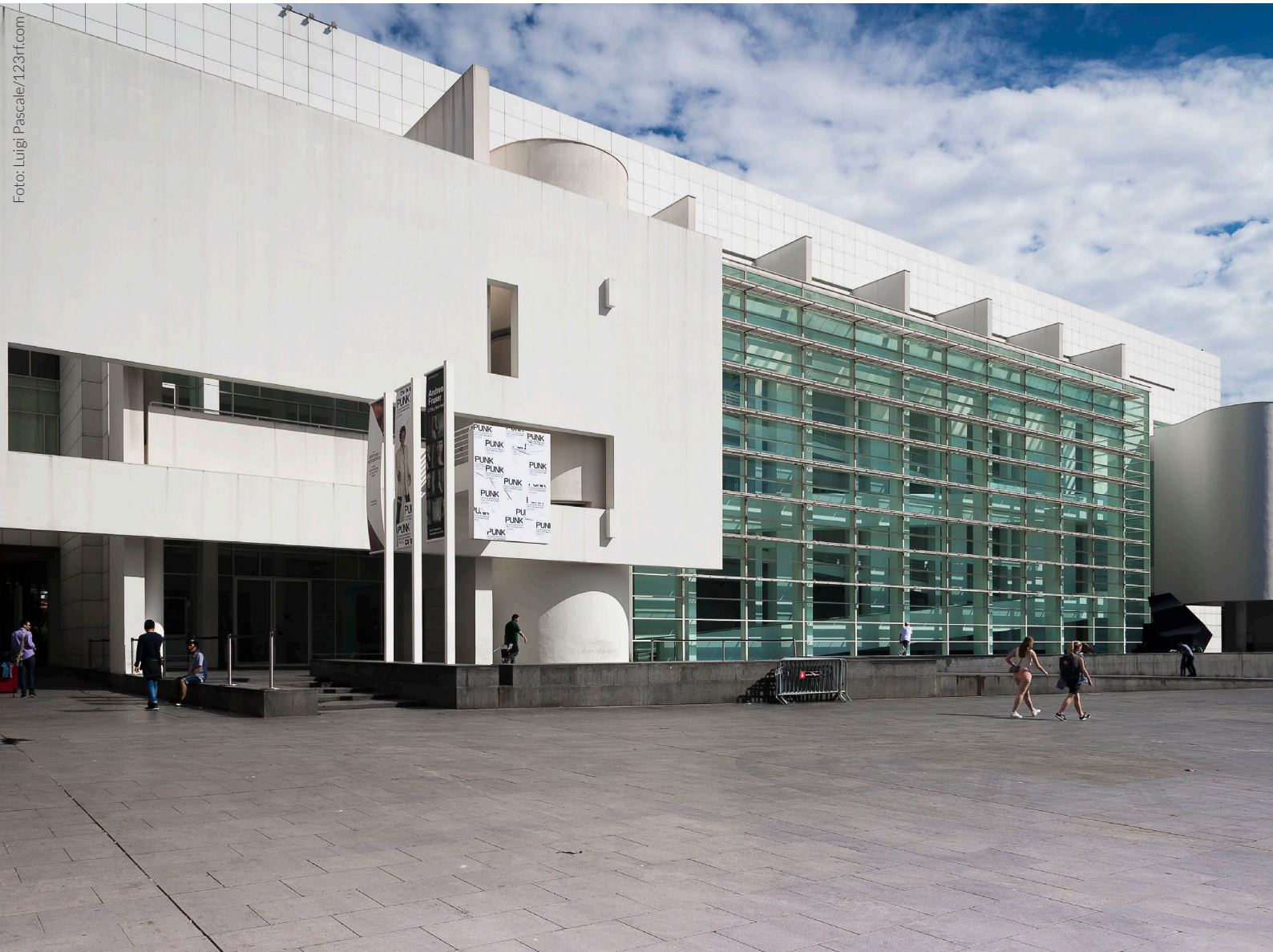
▲ MACBA BARCELONA