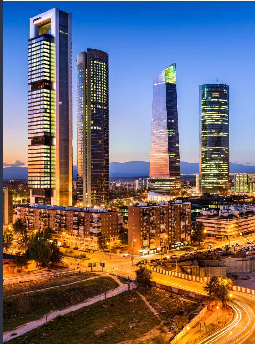
▲ BUSINESSKOMPLEX LAS CUATRO TORRES MADRID

Erleben Sie das Gefühl des Schwindels, das der Torre de Cristal (Glasturm) verursacht, das mit einer Höhe von 249 Metern höchste Gebäude Spaniens. Es wurde von dem Architekten César Pelli , der auch die berühmten Petronas Towers in Kuala Lumpur entworfen hat, in Zusammenarbeit mit dem Madrider Architekturbüro Ortiz León erbaut. Seine wie geschliffenes Glas anmutende Fassade und der vertikale Garten seiner Kuppel lassen dieses Hochhaus als eines der eindrucksvollsten Gebäude der Madrider Architektur erstrahlen