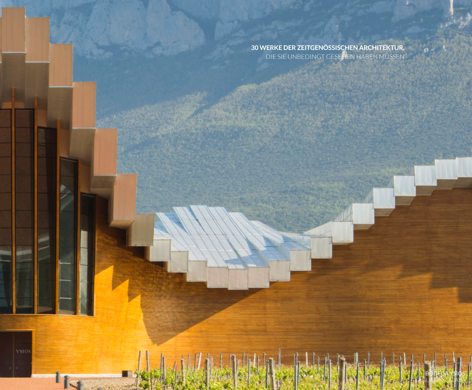
BODEGA YSIOS LAGUARDIA, ALAVA

Der Entwurf ist eine zeitgemäße Neuinterpretation der traditionellen Bauweise in der Weinwirtschaft. Das Untergeschoss des Gebäudes sind neue Kellerräume im Boden , die mit denen verbunden wurden, die es schon seit jeher unter dem Hang des Hügels gibt, auf dem die Burg von Peñafiel steht.