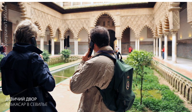
ДЕВИЧИЙ ДВОР АЛЬКАСАР В СЕВИЛЬЕ

проходит ваш путь. Рискните преодолеть несколько участков пути на лошади, велосипеде или пешком.