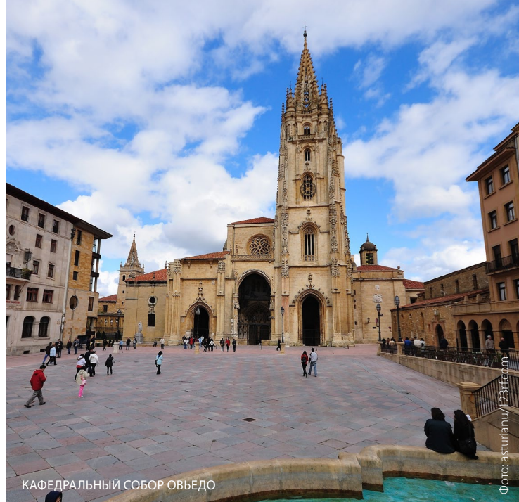
КАФЕДРАЛЬНЫЙ СОБОР ОВЬЕДО

Если вы хотите получить «компостелу» — свидетельство, которое выдается тем, кто прошел Путь из религиозных или духовных побуждений, — вам придется преодолеть не менее 100 километров пешком или на лошади, либо не менее 200 километров на велосипеде.