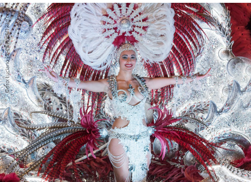
▲ КАРНАВАЛ НА ТЕНЕРИФЕ

Народные праздники в Испании сменяют друг друга на протяжении всего года. Приобщитесь, почувствуйте и получите удовольствие от Испании, побывав на местных праздниках.