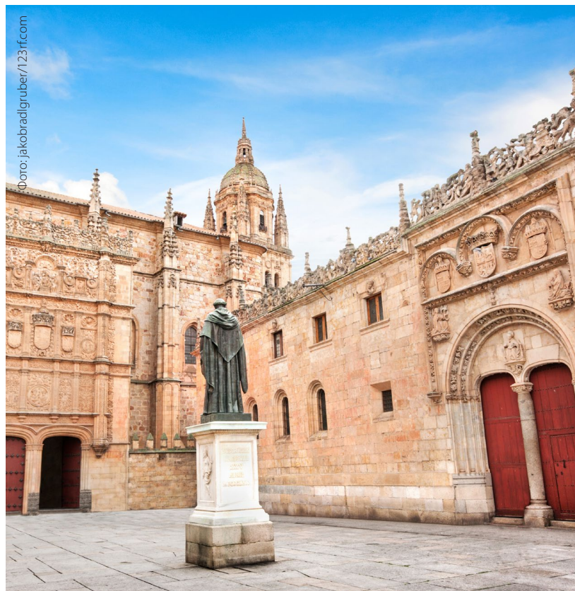
▲ УНИВЕРСИТЕТ САЛАМАНКИ

Университет Саламанки , один из старейших в Испании, обладает лучшими традициями и высочайшим престижем в области преподавания испанского языка.