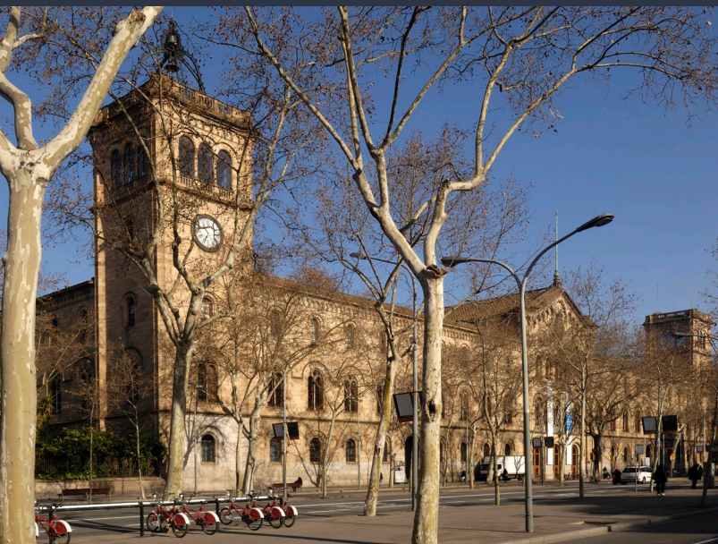
▲ УНИВЕРСИТЕТ БАРСЕЛОНЫ

Географическое расположение, а также возможности для отдыха и знакомства с культурой этого космополитичного и открытого города превращают его в незабываемое место для изучения языка. В Барселоне находятся одни из крупнейших университетов Испании, такие как университет Помпеу Фабра, Барселонский университет и Автономный университет Барселоны.