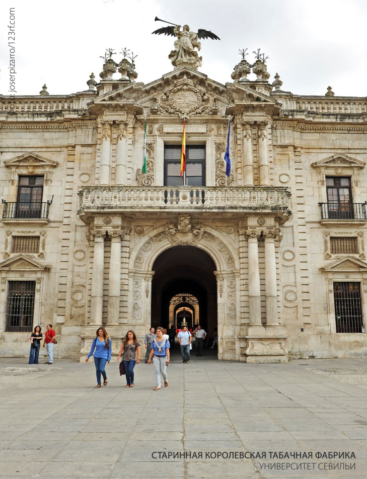
СТАРИННАЯ КОРОЛЕВСКАЯ ТАБАЧНАЯ ФАБРИКА УНИВЕРСИТЕТ СЕВИЛЬИ