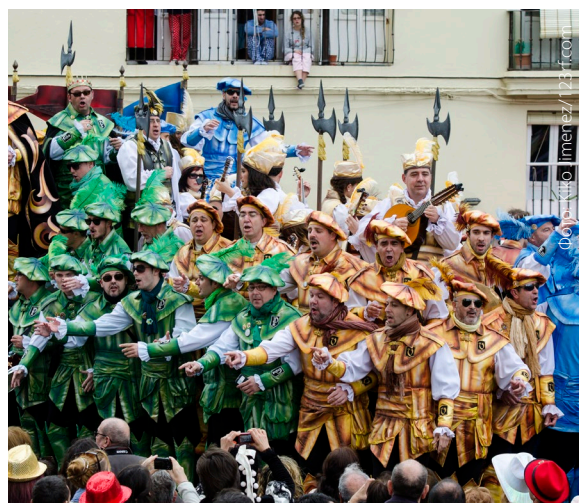
▲ КАРНАВАЛ В КАДИСЕ

С наступлением праздника Фальяс, известного во всем мире и признанного ЮНЕСКО нематериальным наследием человечества, Валенсия наполняется весельем и звуками музыки. В течение недели в городе можно увидеть куклы нинотс (гигантские фигуры, с юмором изображающие общественные явления), которые в конце праздника сжигаются на больших кострах.