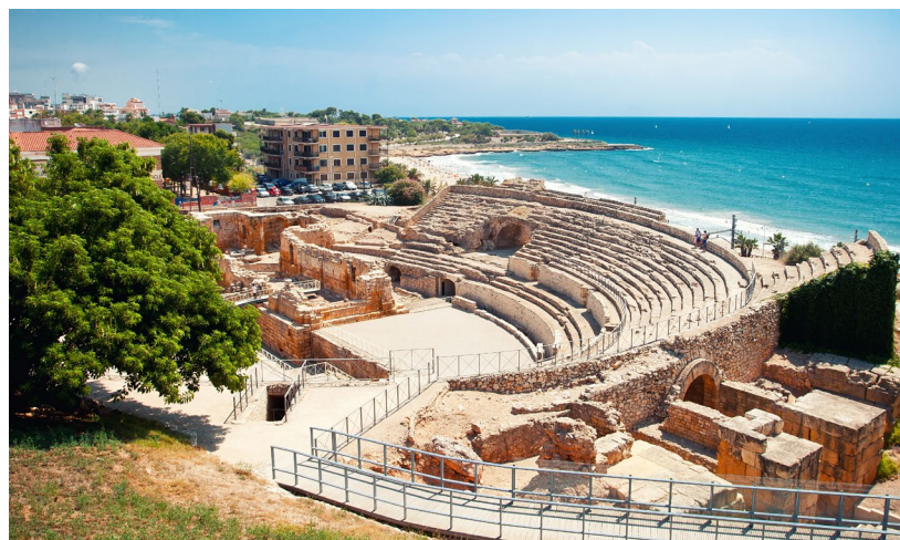
▲ РИМСКИЙ АМФИТЕАТР ТАРРАГОНА

Маршрут римской Бетики проходит через четырнадцать андалузских городов провин-