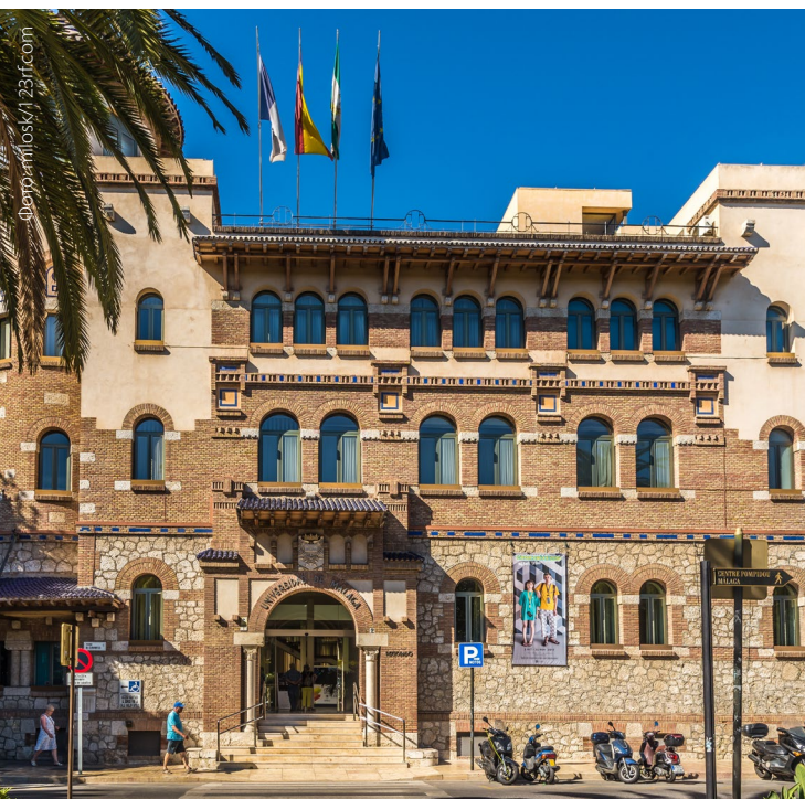
▲ УНИВЕРСИТЕТ МАЛАГИ