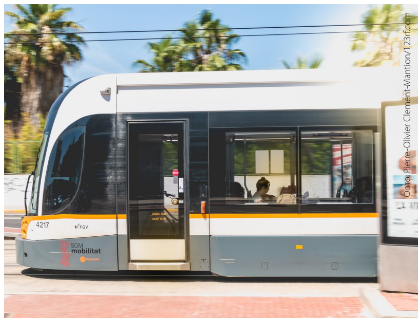
▲ ТРАМВАЙ ВАЛЕНСИЯ

❶ Дополнительную информацию можно найти на сайтах www.studyinspain.info и www.spain.info