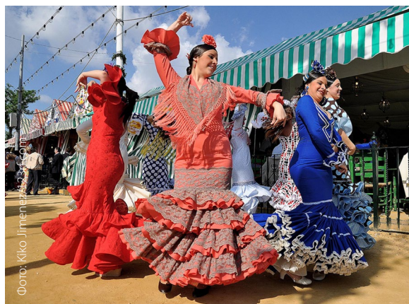
▲ АПРЕЛЬСКАЯ ЯРМАРКА СЕВИЛЬЯ

Ярмарочная Севилья — это синоним круглосуточного веселья. Выставочный комплекс и павильоны наполняются музыкой, смехом, едой и бокалами с андалузским хересом фино или «ребухито» (вином мансанилья с газировкой). Не уходите, не попробовав жареной мелкой рыбки пескаито фрито, и станьте свидетелем зрелищной процессии всадников и карет.